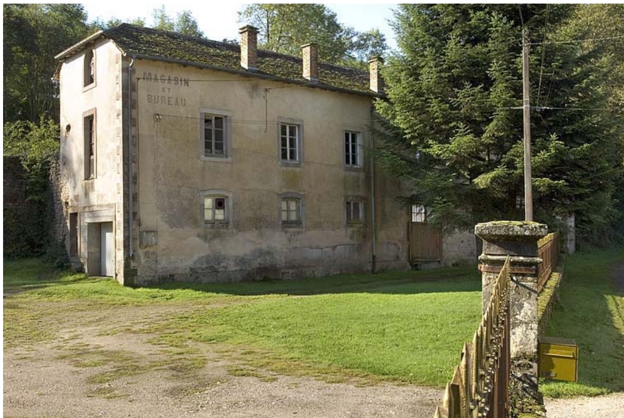
Vue depuis l'entrée du bâtiment des chais et des magasins.