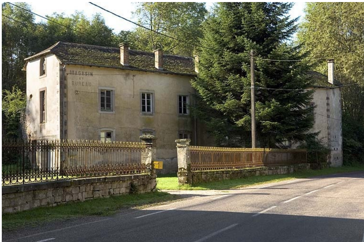
Bâtiment abritant les chais, les magasins et les bureaux.