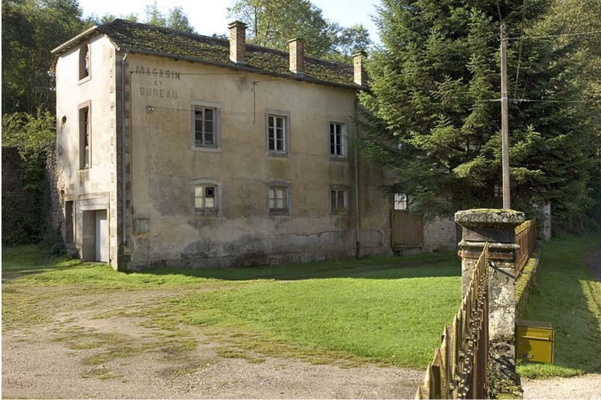
Vue depuis l'entrée du bâtiment des chais et des magasins.