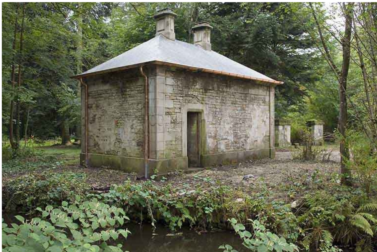
Rendez-vous de chasse. Vue de trois quarts arrière.

70, Aillevillers-et-Lyaumont, lieudit : la Chaudeau