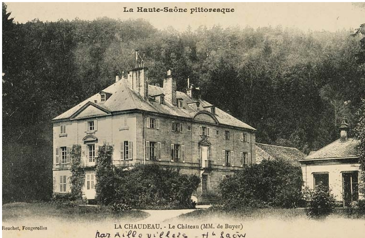
Aillevillers (Hte-Saône). La Chaudeau - Le château (MM. de Buyer).

70, Aillevillers-et-Lyaumont, lieudit : la Chaudeau