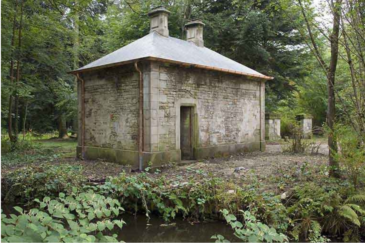
Rendez-vous de chasse. Vue de trois quarts arrière.

70, Aillevillers-et-Lyaumont, lieudit : la Chaudeau