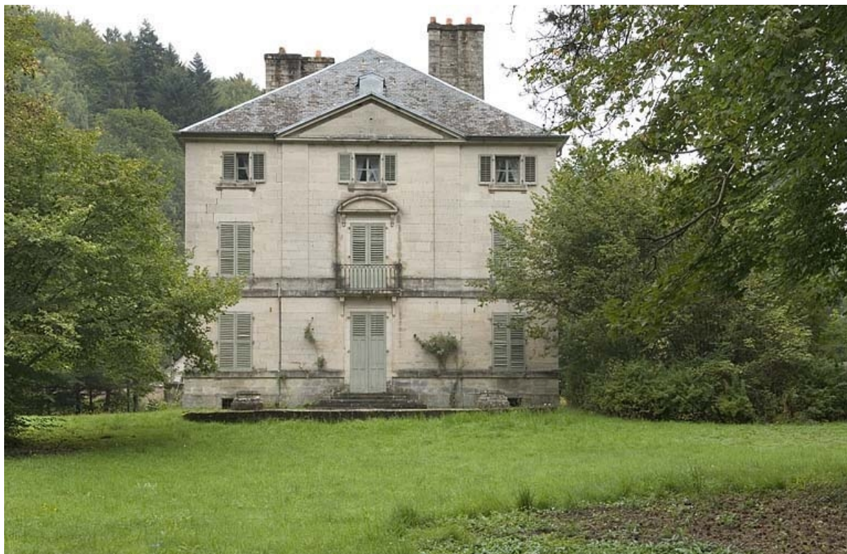
Façade sud de la demeure.

70, Aillevillers-et-Lyaumont, lieudit : la Chaudeau