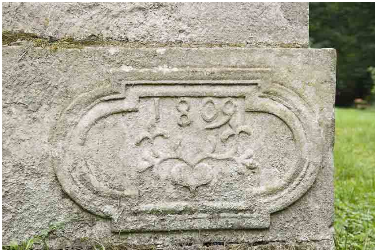
Cartouche situé à l'angle nord-ouest de la demeure.

70, Aillevillers-et-Lyaumont, lieudit : la Chaudeau