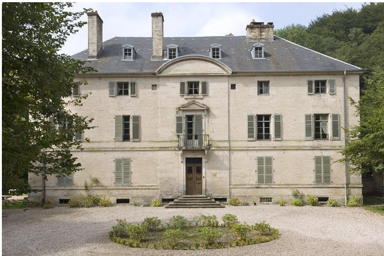
Façade antérieure de la demeure.

70, Aillevillers-et-Lyaumont, lieudit : la Chaudeau