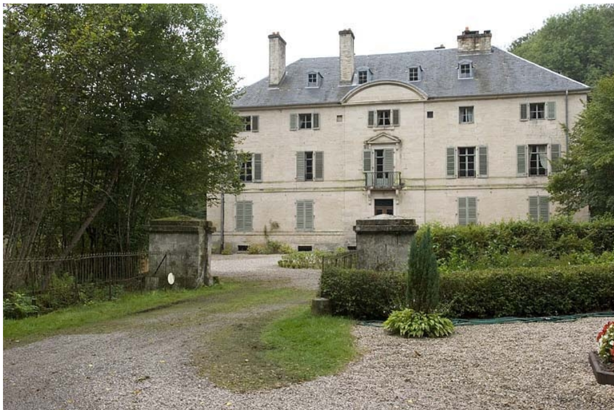
Façade antérieure de la demeure depuis l'entrée.

70, Aillevillers-et-Lyaumont, lieudit : la Chaudeau