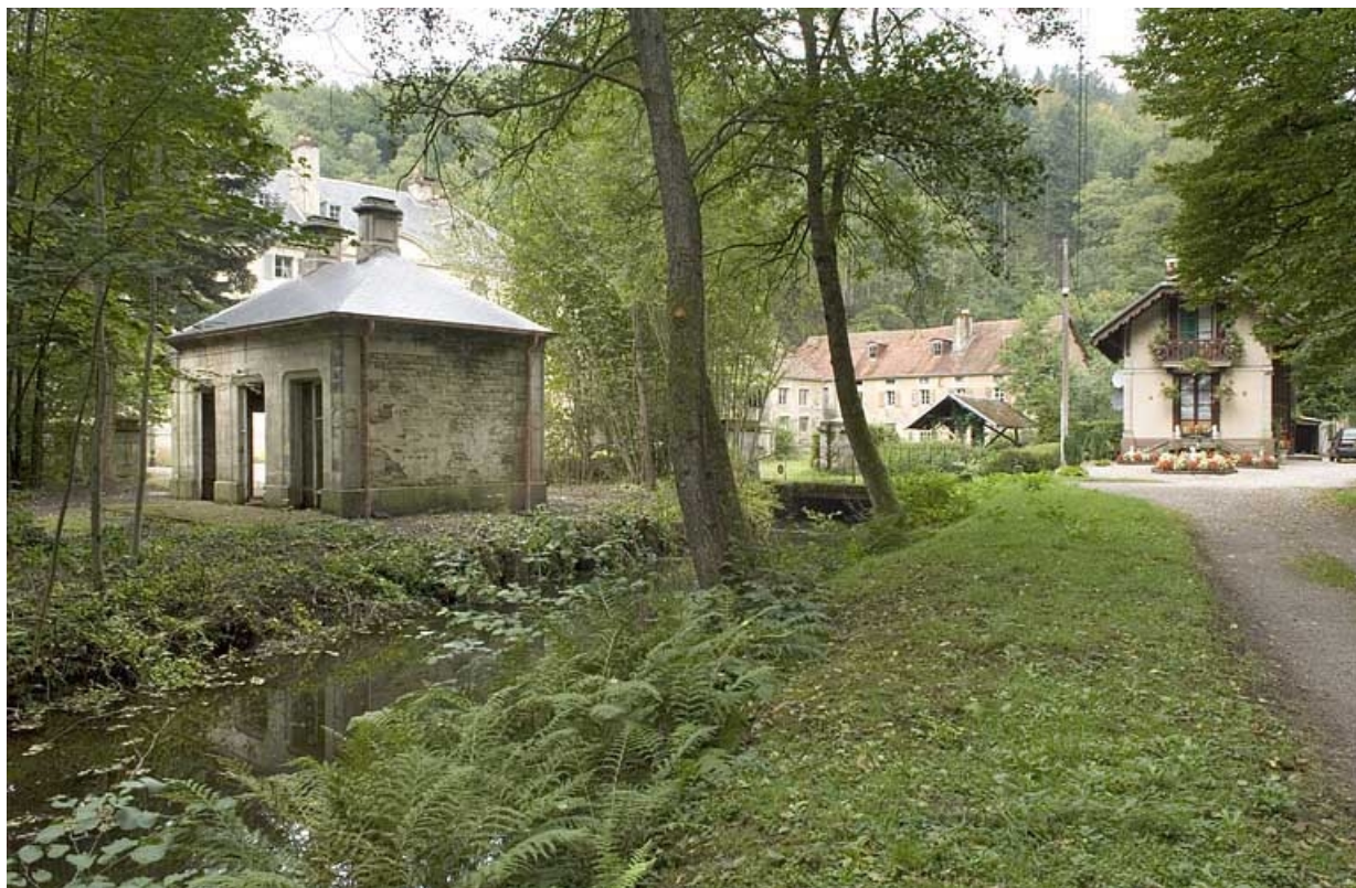
Vue d'ensemble depuis l'allée d'entrée.

70, Aillevillers-et-Lyaumont, lieudit : la Chaudeau