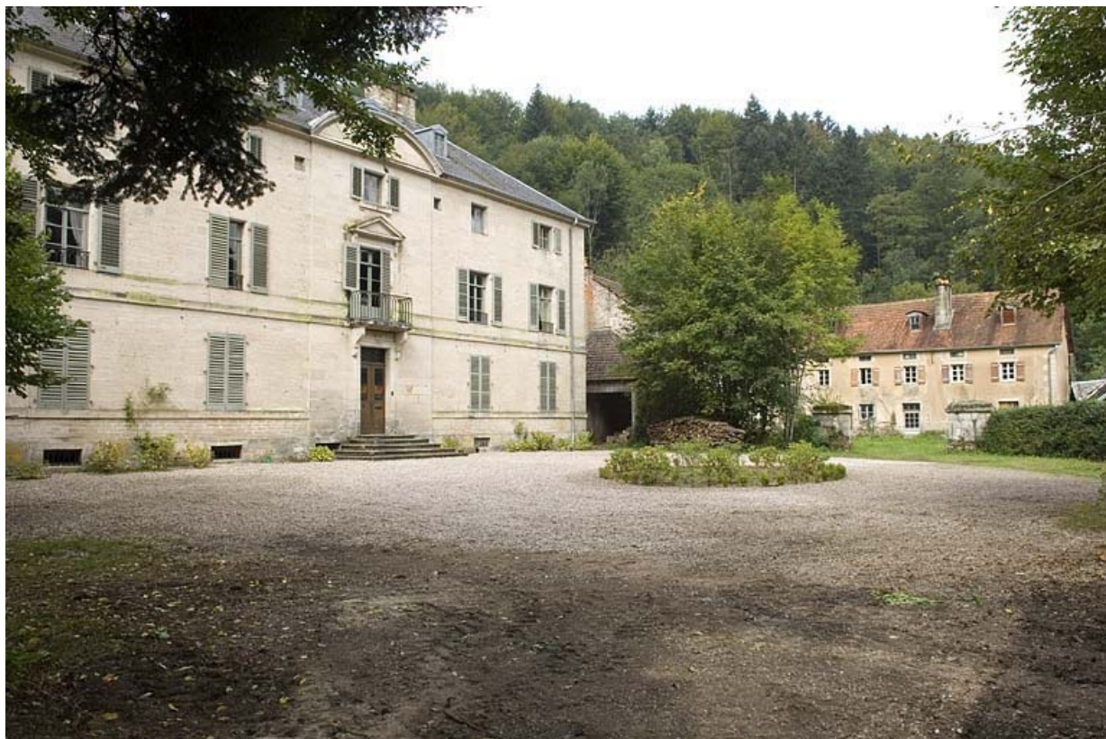
La demeure et la ferme depuis le sud.

70, Aillevillers-et-Lyaumont, lieudit : la Chaudeau