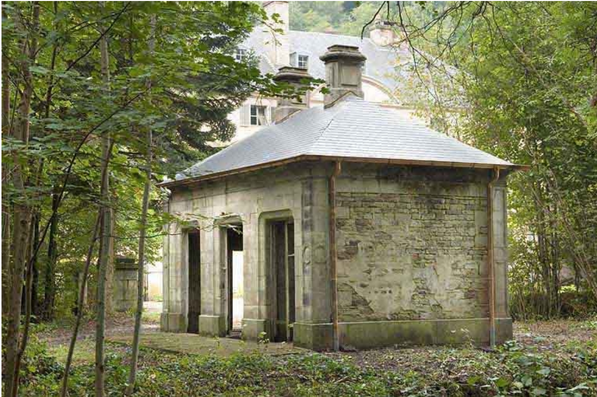
Rendez-vous de chasse. Vue de trois quarts. 70, Aillevillers-et-Lyaumont, lieudit : la Chaudeau