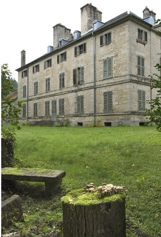
La demeure vue de trois quarts arrière.

70, Aillevillers-et-Lyaumont, lieudit : la Chaudeau