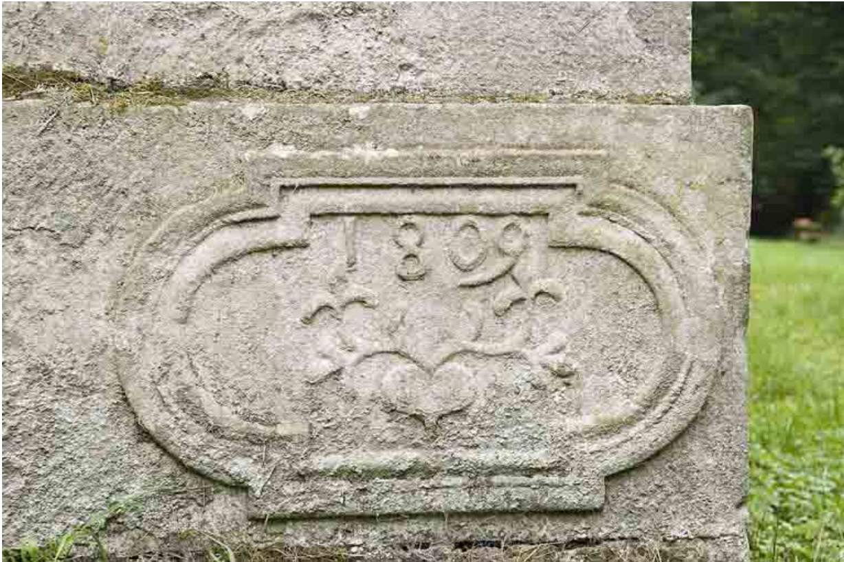
Cartouche situé à l'angle nord-ouest de la demeure.

70, Aillevillers-et-Lyaumont, lieudit : la Chaudeau