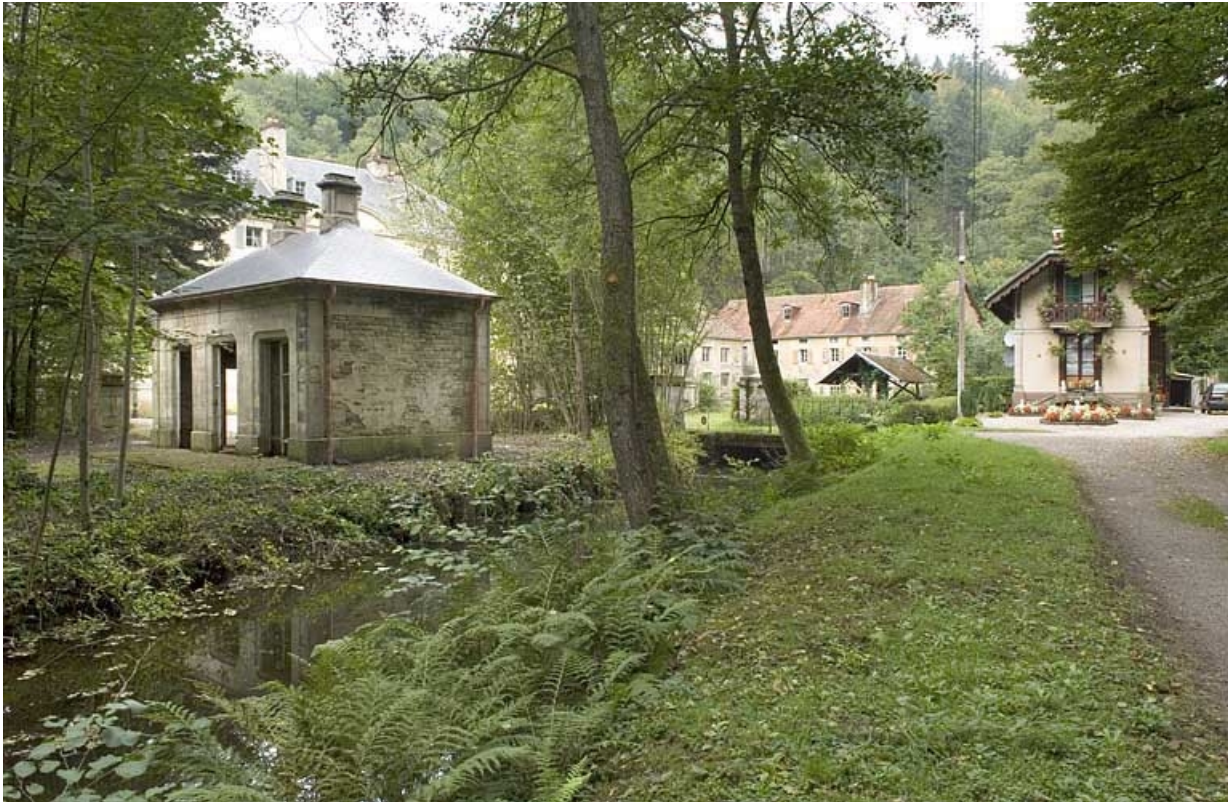
Vue d'ensemble depuis l'allée d'entrée.

70, Aillevillers-et-Lyaumont, lieudit : la Chaudeau