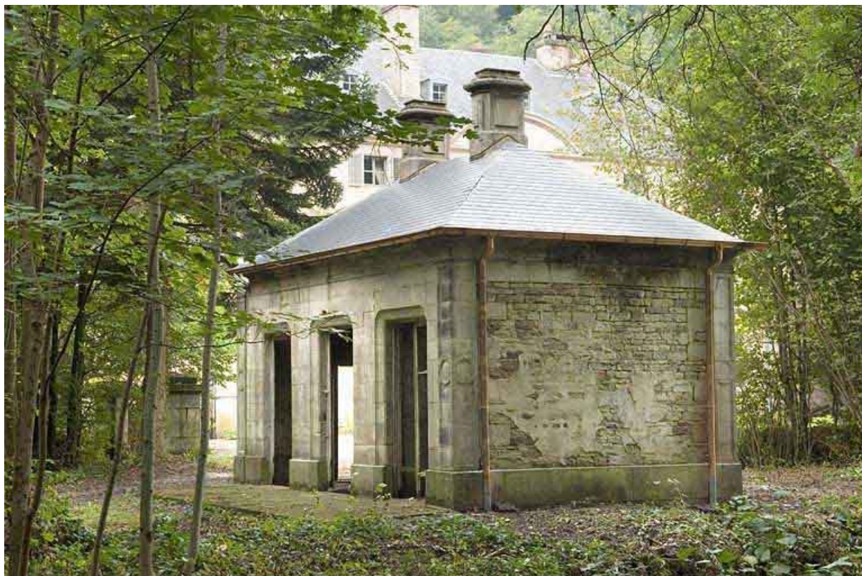
Rendez-vous de chasse. Vue de trois quarts. 70, Aillevillers-et-Lyaumont, lieudit : la Chaudeau