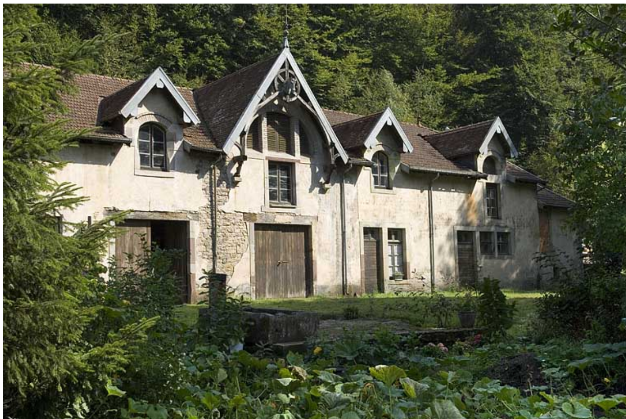
Façade antérieure du bâtiment des écuries et du chenil.

70, Aillevillers-et-Lyaumont, lieudit : la Chaudeau