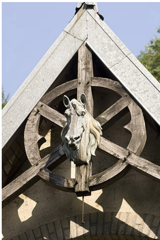
Pignon central des écuries. Décor sculpté.

70, Aillevillers-et-Lyaumont, lieudit : la Chaudeau