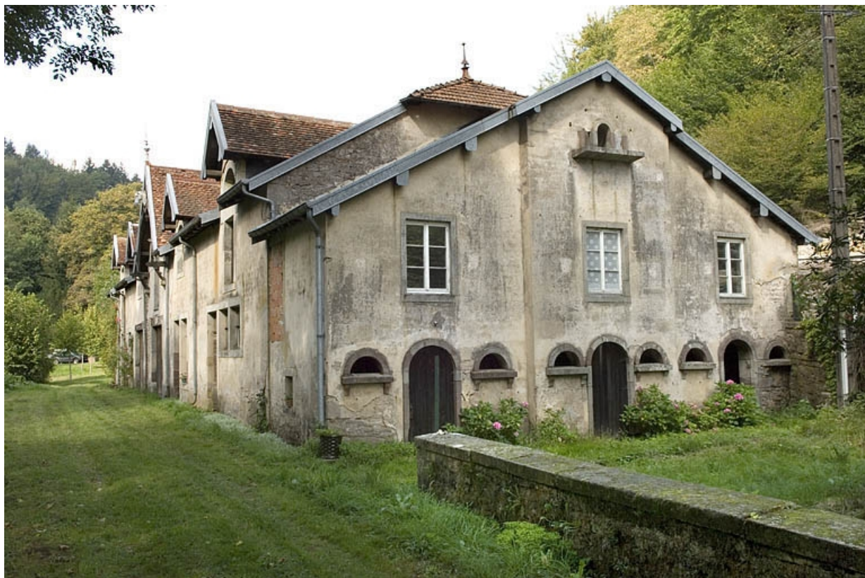
Ecuries et chenil vus de trois quarts.

70, Aillevillers-et-Lyaumont, lieudit : la Chaudeau