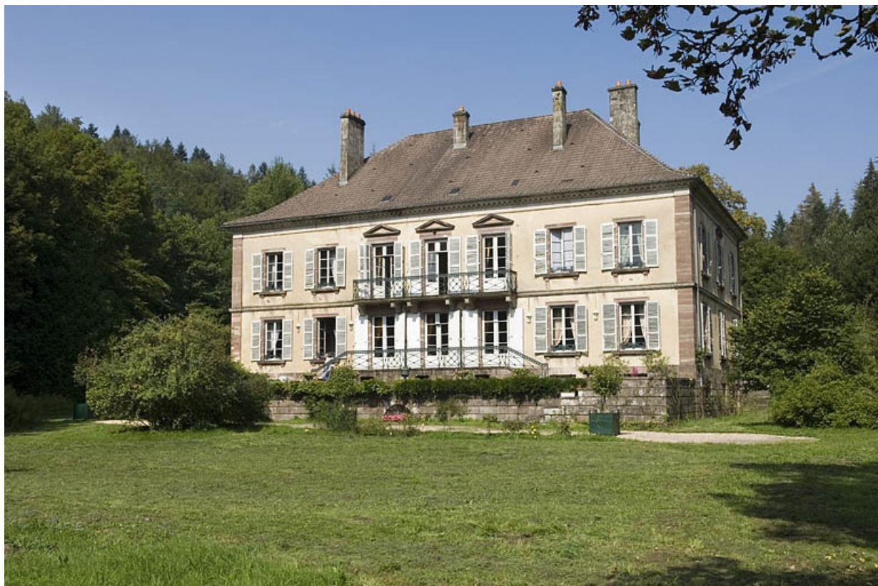
Façade sud vue de trois quarts droite.

70, Aillevillers-et-Lyaumont, lieudit : la Chaudeau