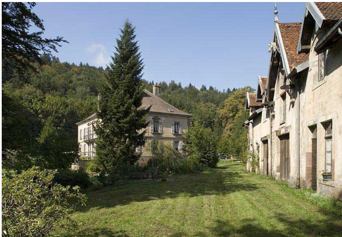
Demeure patronale et bâtiment abritant les écuries et le chenil.

70, Aillevillers-et-Lyaumont, lieudit : la Chaudeau