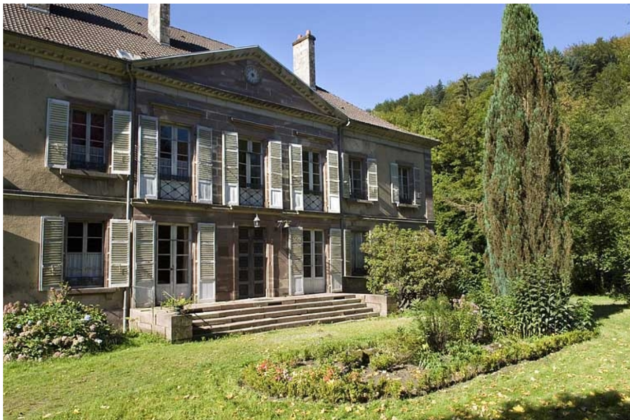
Façade nord vue de trois quarts.

70, Aillevillers-et-Lyaumont, lieudit : la Chaudeau