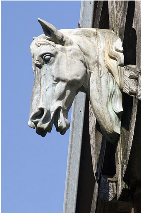
Pignon central des écuries. Détail de la tête de cheval.

70, Aillevillers-et-Lyaumont, lieudit : la Chaudeau