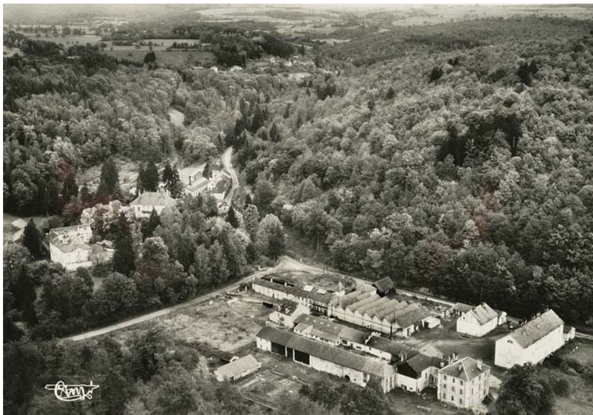
Aillevillers (Hte-Saône) - La Chaudeau - Vue générale aérienne.

70, Aillevillers-et-Lyaumont, lieudit : la Chaudeau