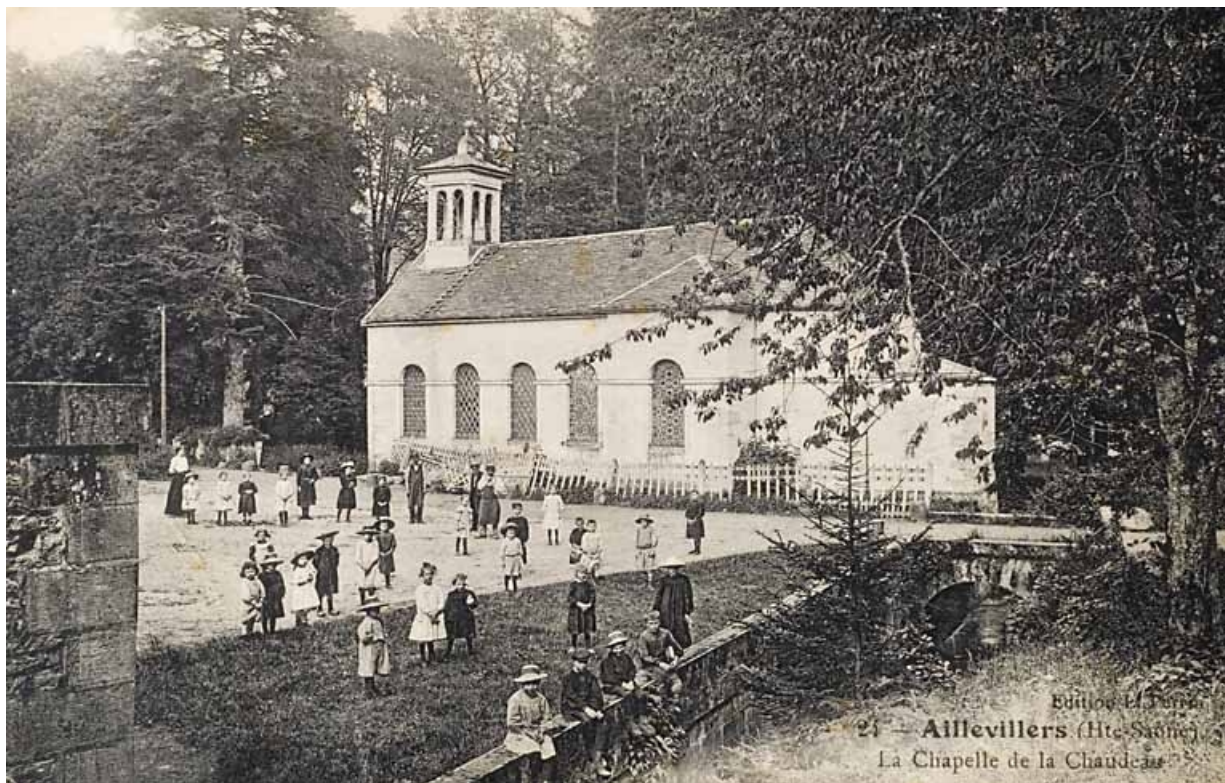
Aillevillers (Hte-Saône) - La Chapelle de la Chaudeau.

70, Aillevillers-et-Lyaumont, lieudit : la Chaudeau