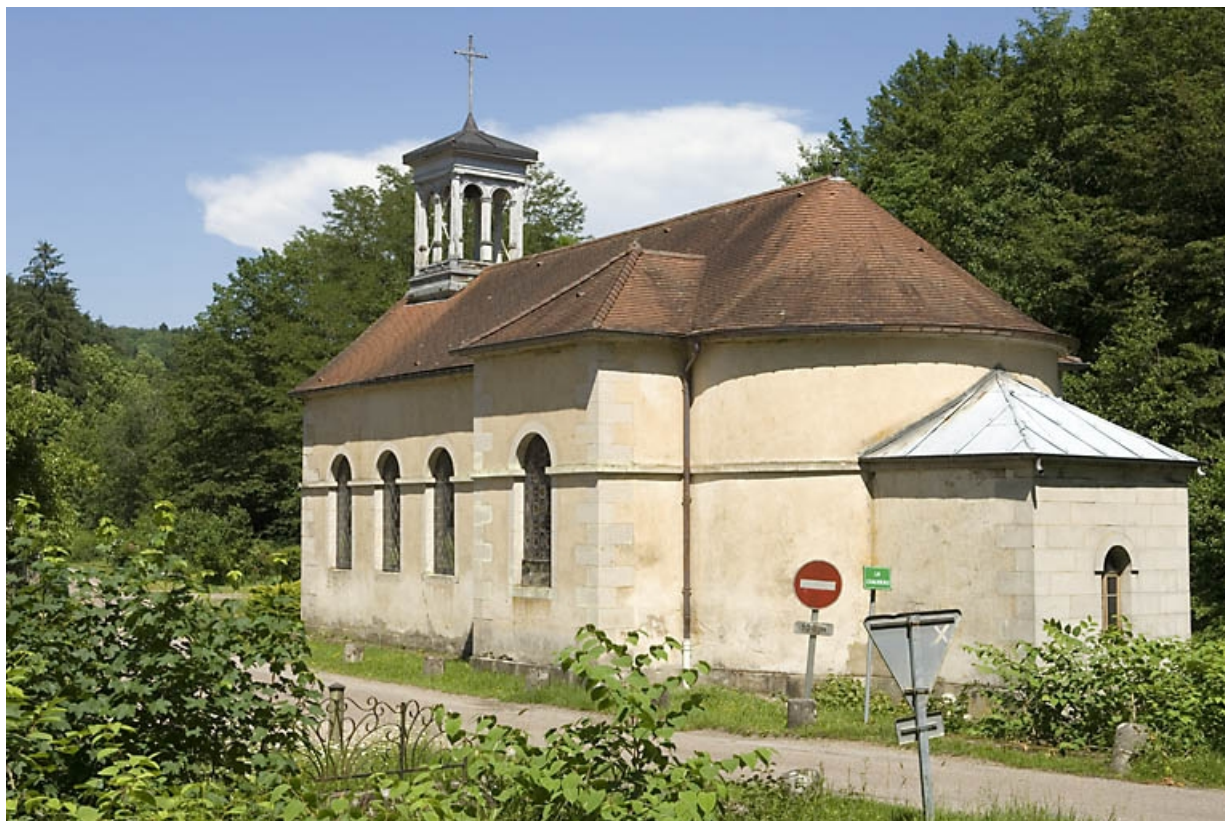
La chapelle (commune du Clerjus, 88).

70, Aillevillers-et-Lyaumont, lieudit : la Chaudeau