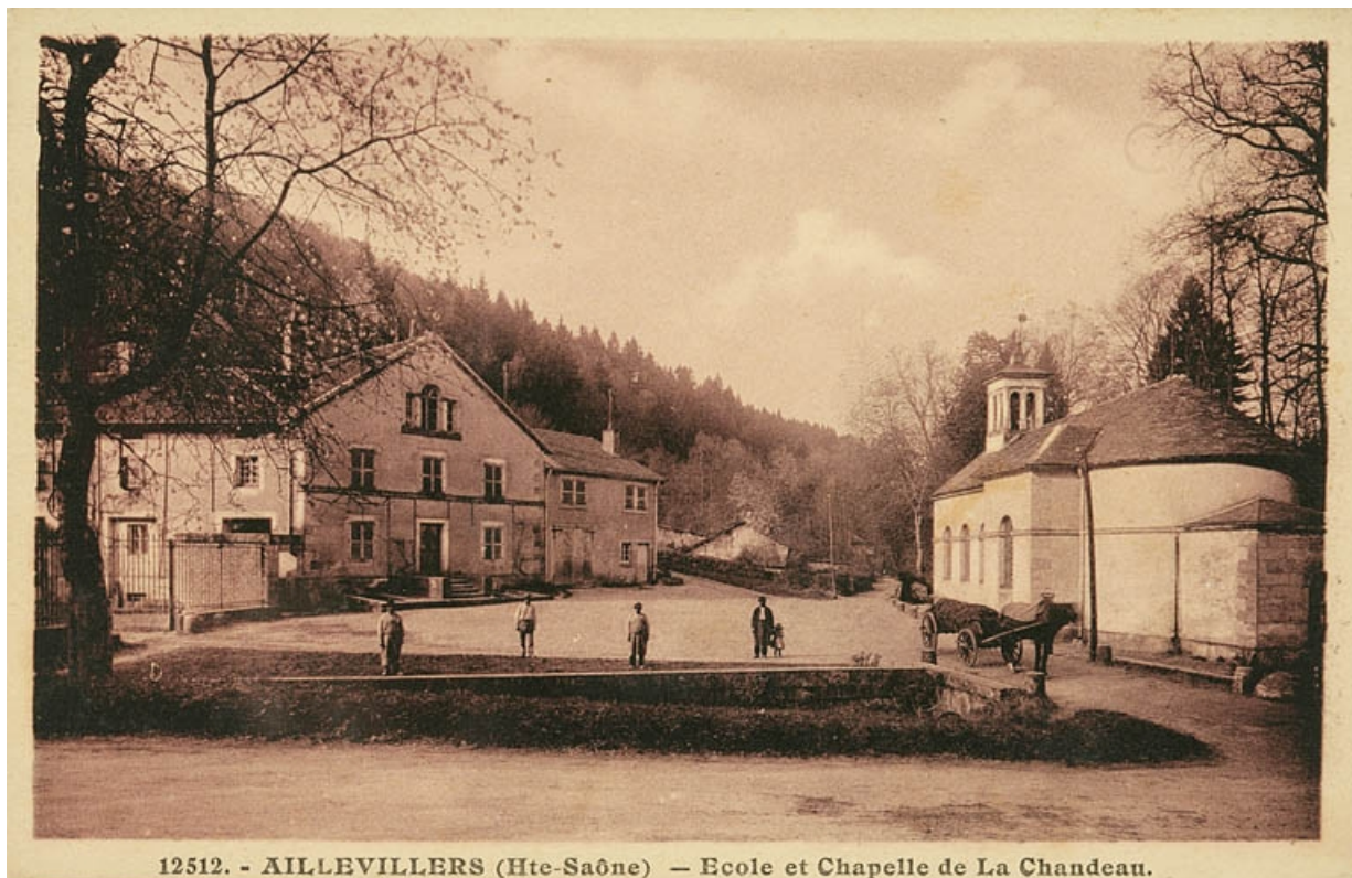
Aillevillers (Hte-Saône). Ecole et chapelle de la Chaudeau.

70, Aillevillers-et-Lyaumont, lieudit : la Chaudeau