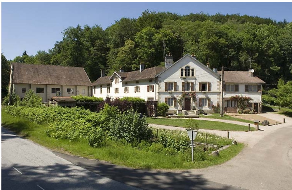
Ecole et logement (commune du Clerjus, 88). 70, Aillevillers-et-Lyaumont, lieudit : la Chaudeau