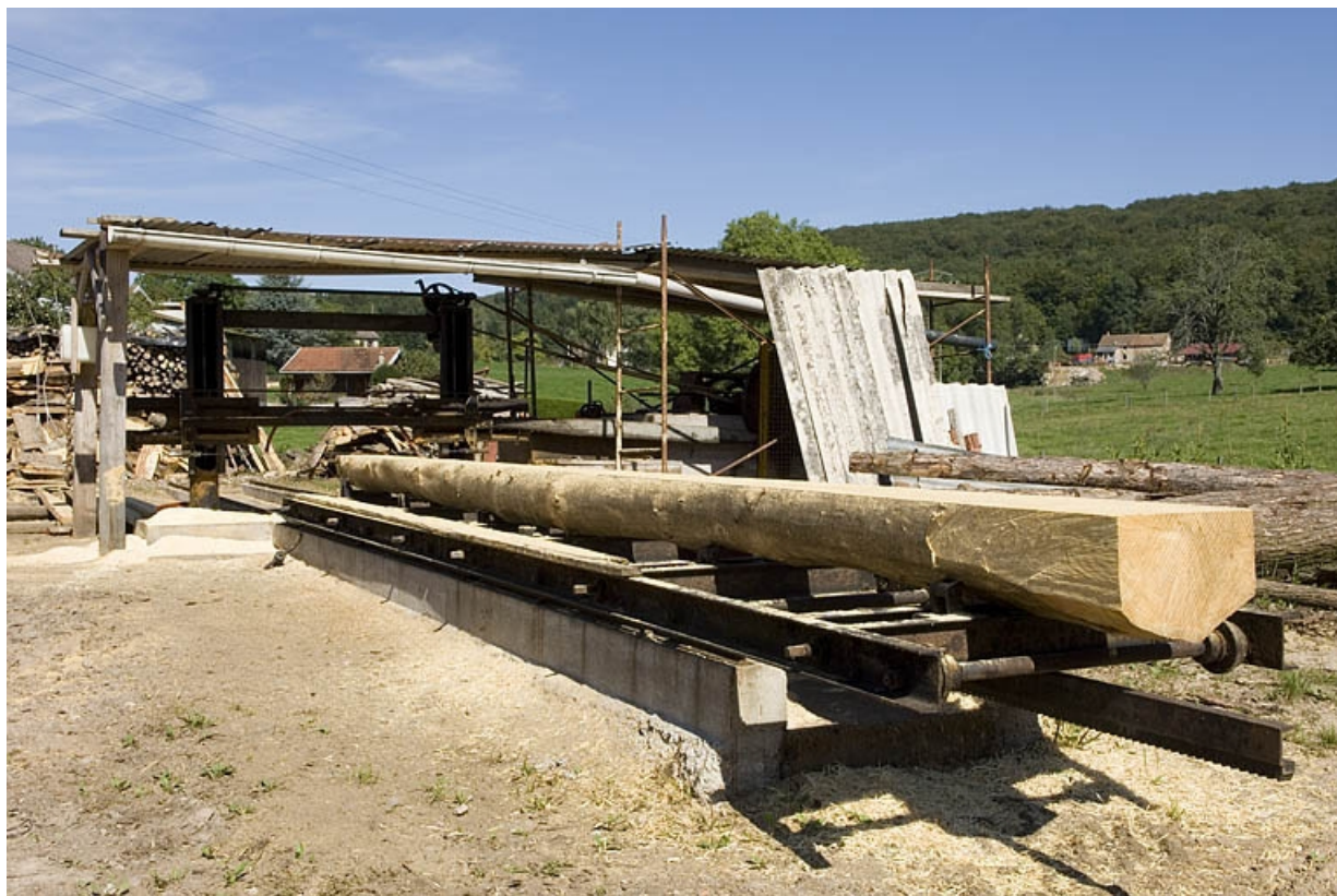
Châssis de scie horizontale monolame. Vue d'ensemble (hameau de la Louvière).