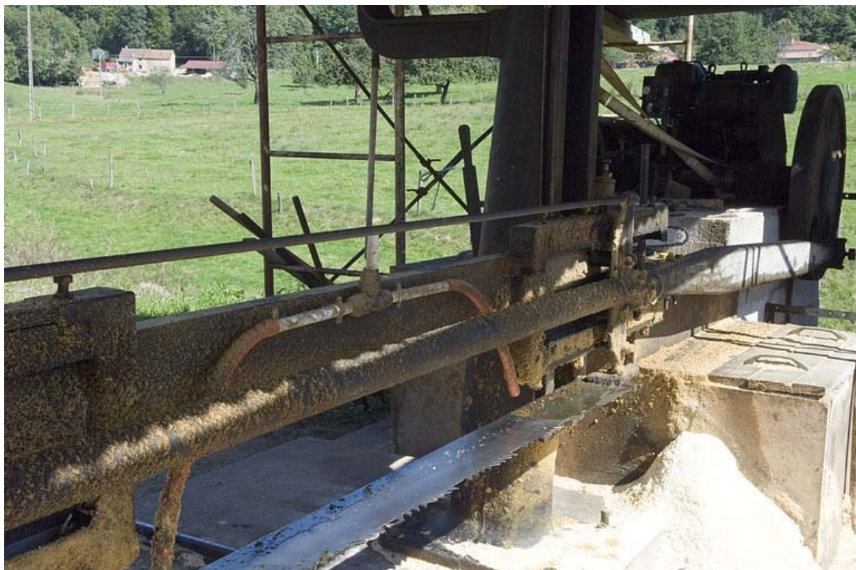
Scie horizontale monolame. Détail de lame, de la transmission (bielle et manivelle) et du moteur (hameau de la Louvière). 70, Aillevillers-et-Lyaumont, lieudit : Pont les Ports