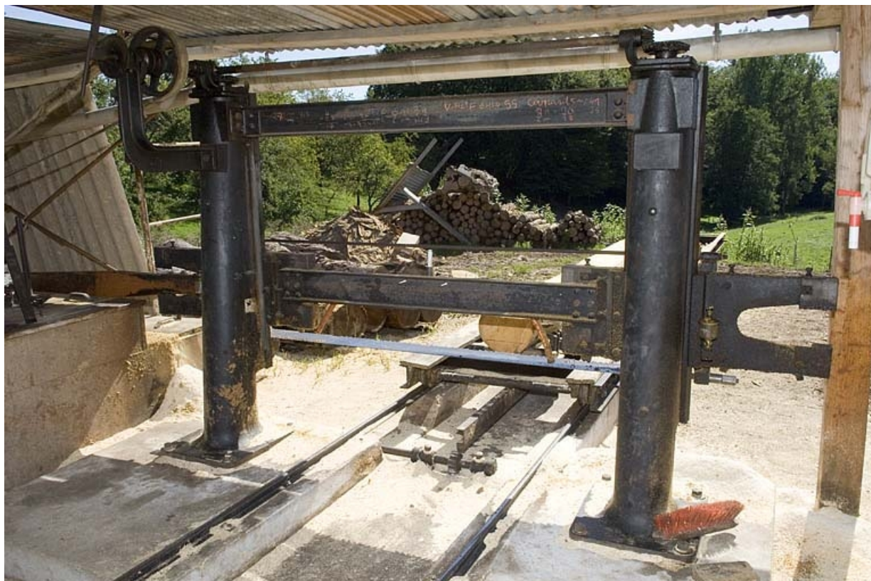
Scie horizontale monolame. Détail du châssis (hameau de la Louvière).