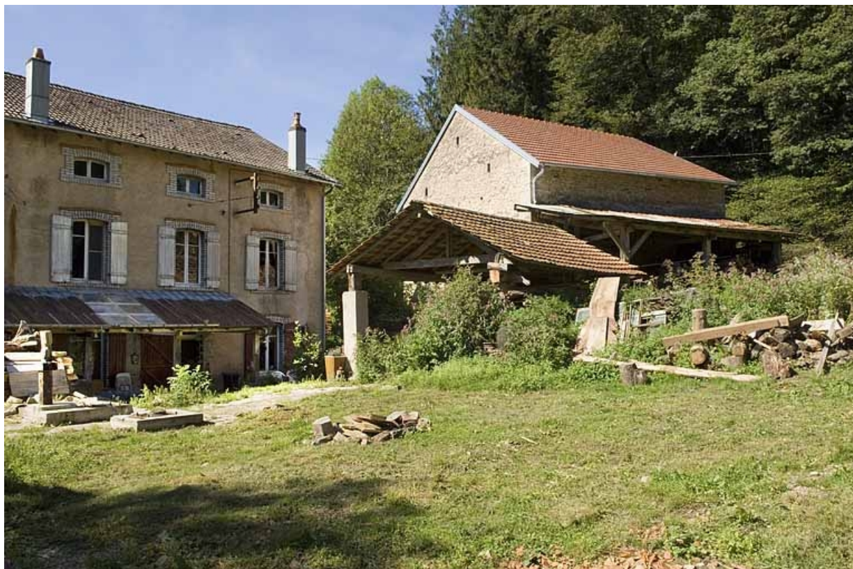
Façade postérieure, avec l'emplacement du châssis de scie.

70, Aillevillers-et-Lyaumont, lieudit : Pont les Ports