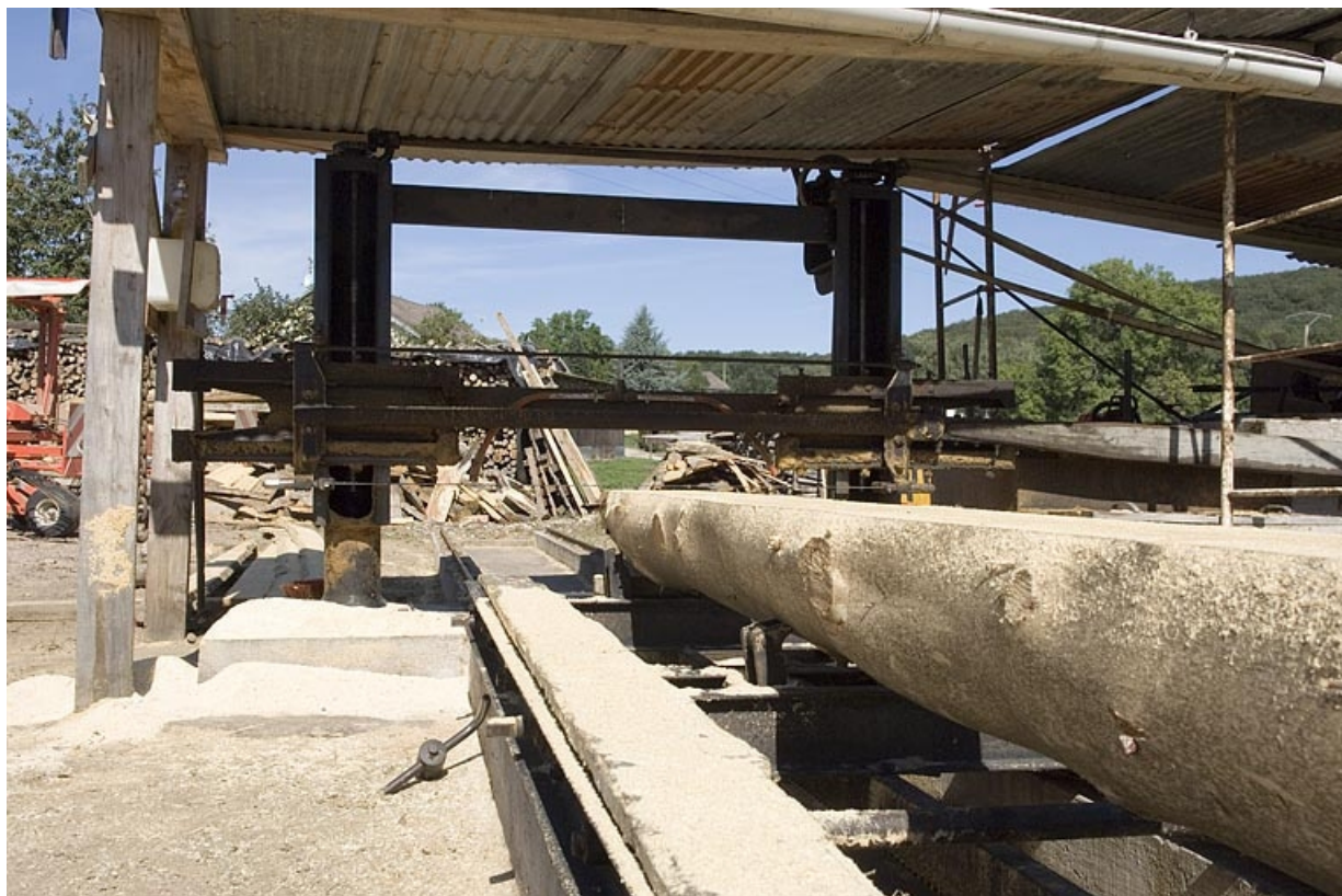
Scie horizontale monolame. Chariot et châssis (hameau de la Louvière).

70, Aillevillers-et-Lyaumont, lieudit : Pont les Ports