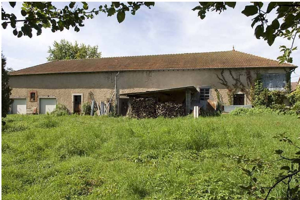
Atelier de distillation. Façade sur le jardin. 70, Aillevillers-et-Lyaumont, 3 rue du Bambois