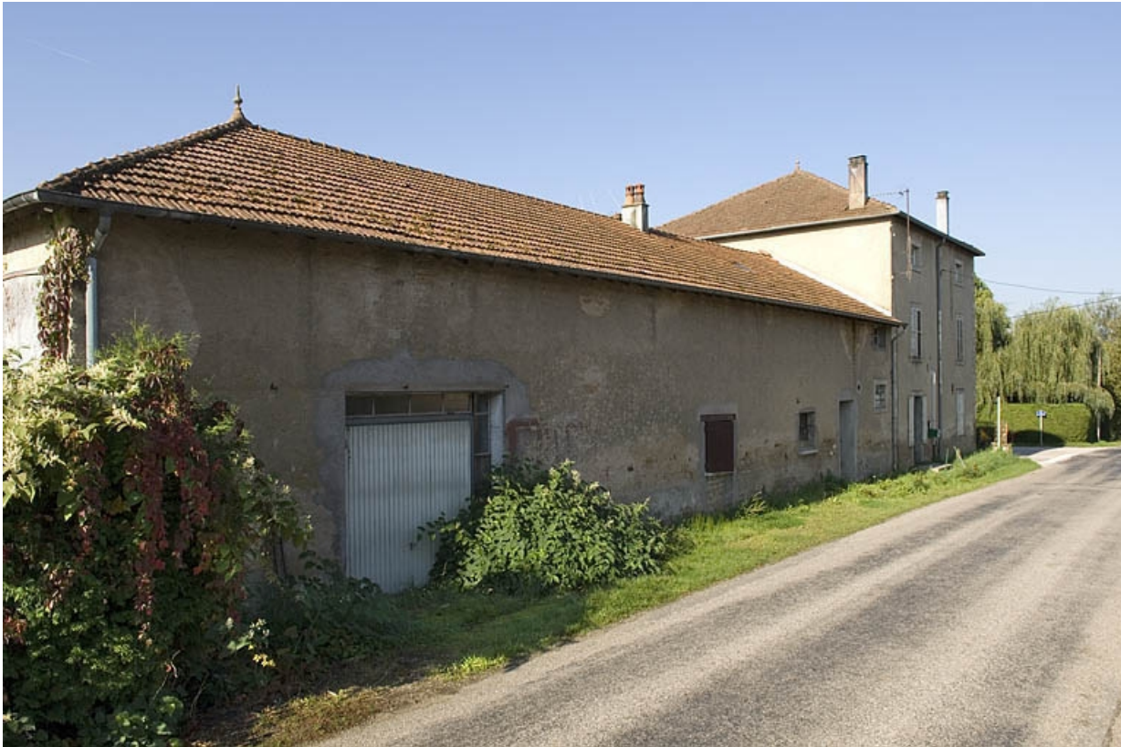
Atelier et logement depuis l'est.

70, Aillevillers-et-Lyaumont, 3 rue du Bambois