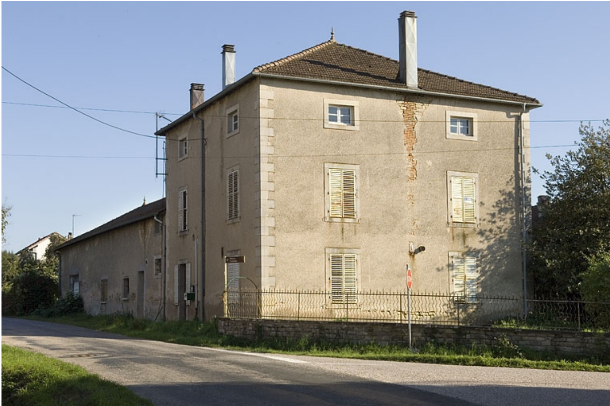
Logement et atelier depuis la route départementale.

70, Aillevillers-et-Lyaumont, 3 rue du Bambois