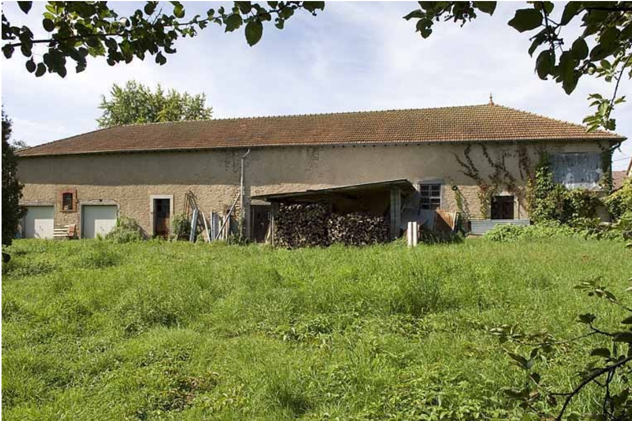
Atelier de distillation. Façade sur le jardin. 70, Aillevillers-et-Lyaumont, 3 rue du Bambois