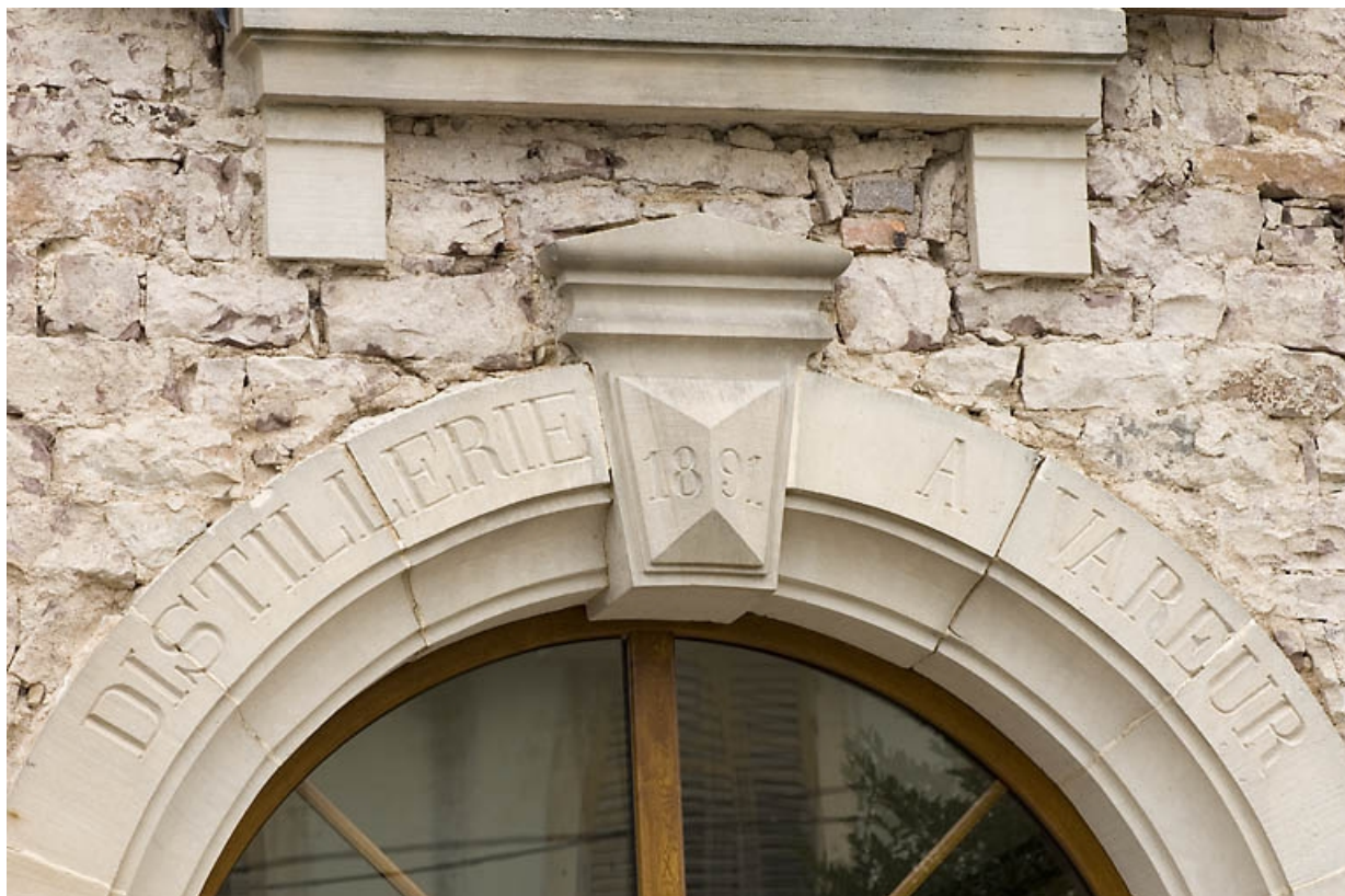
Façade antérieure. Inscription sur l'arc en plein-cintre de la porte.

70, Aillevillers-et-Lyaumont, 10 route de Plombières