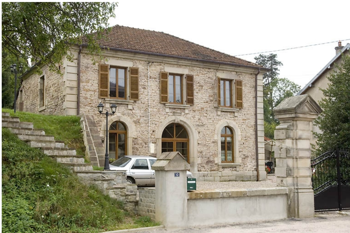
Façade antérieure. Vue de trois quarts.

70, Aillevillers-et-Lyaumont, 10 route de Plombières