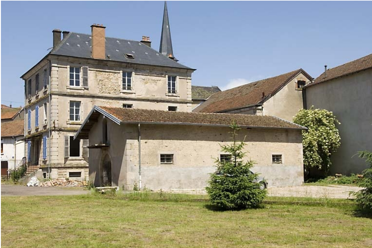
Logement patronal et chai (?) depuis l'ouest.

70, Aillevillers-et-Lyaumont, 31 rue Charles Demandre