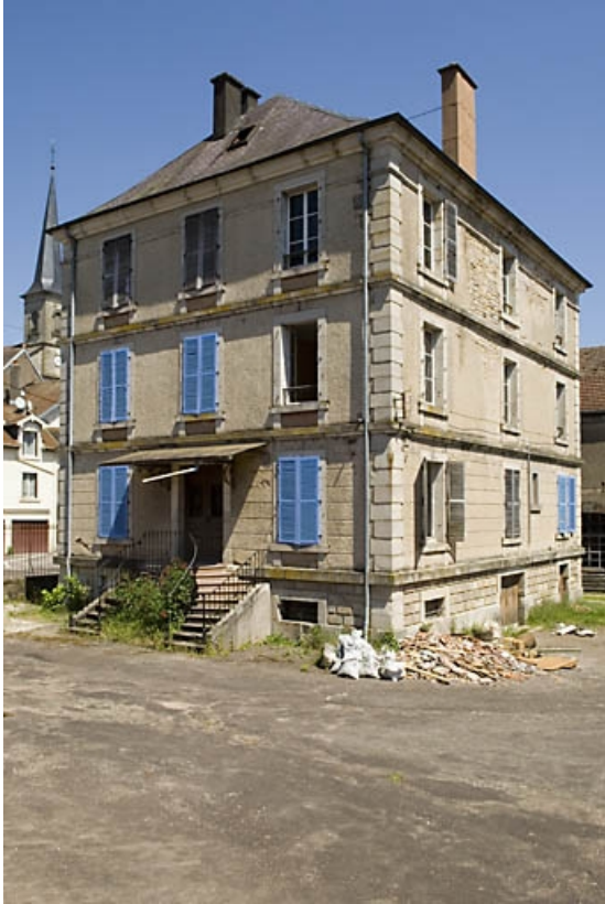
Logement patronal vu de trois quarts arrière.

70, Aillevillers-et-Lyaumont, 31 rue Charles Demandre