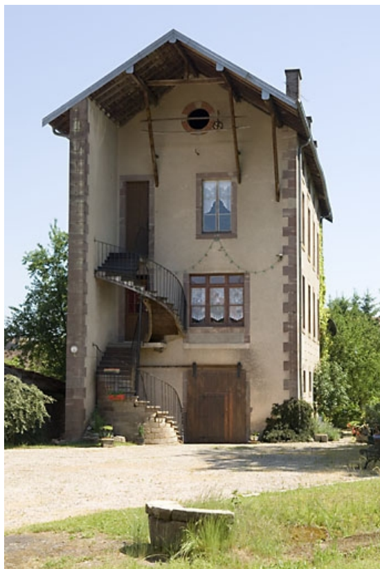
Atelier de distillation et chai (?) depuis le nord-ouest. 70, Aillevillers-et-Lyaumont, 31 rue Charles Demandre