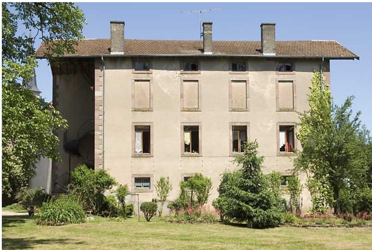
Atelier de distillation et chai (?). Façade sud-ouest. 70, Aillevillers-et-Lyaumont, 31 rue Charles Demandre