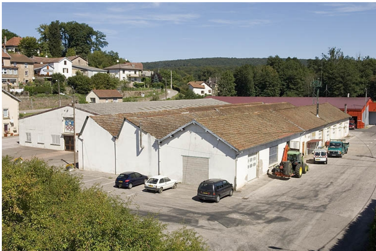
Vue depuis le sud-ouest.

70, Aillevillers-et-Lyaumont rue du Martinet