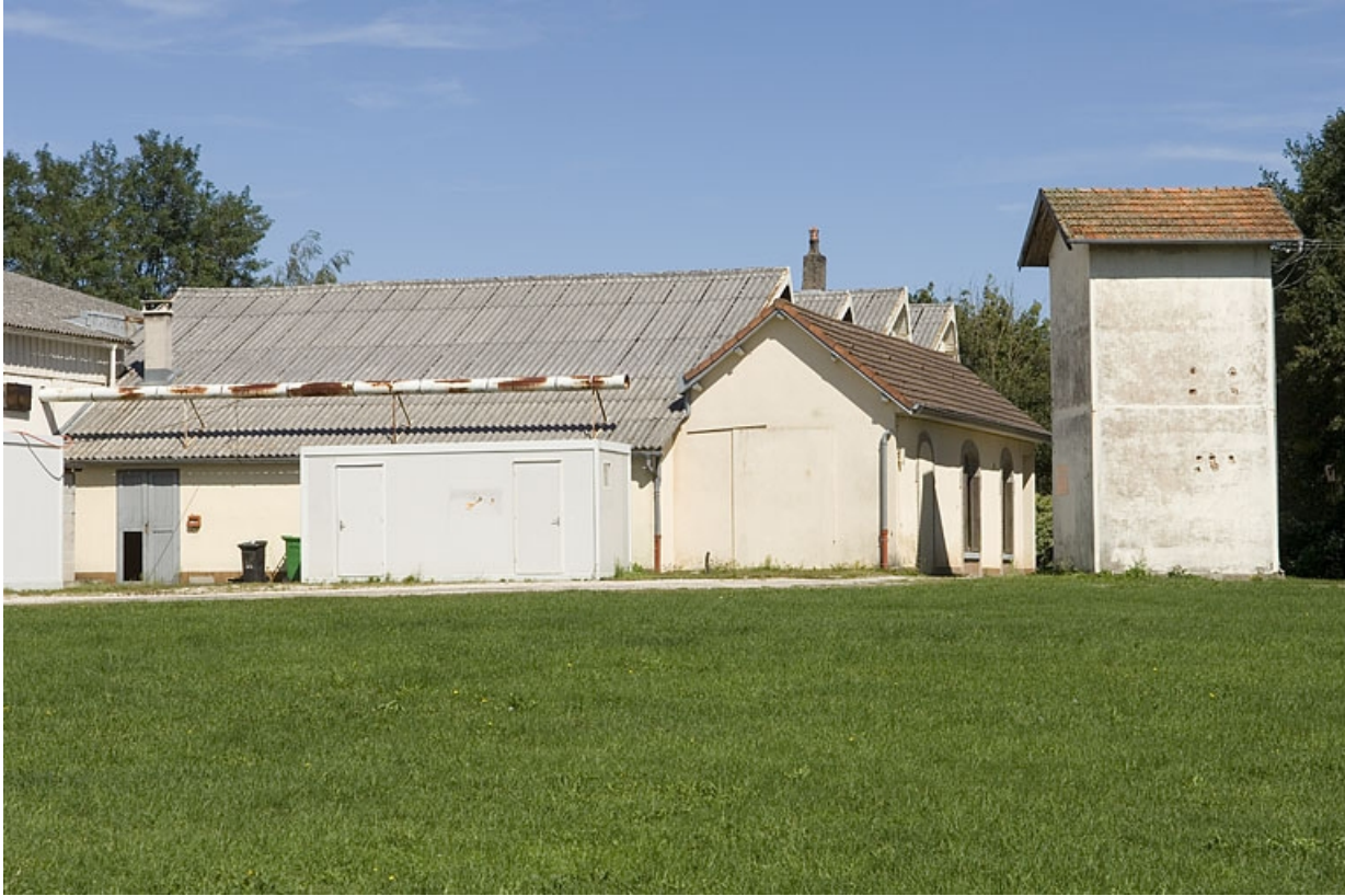
Atelier de fabrication et transformateur depuis le sud-ouest.

70, Aillevillers-et-Lyaumont, lieudit : zone industrielle des Corbillottes