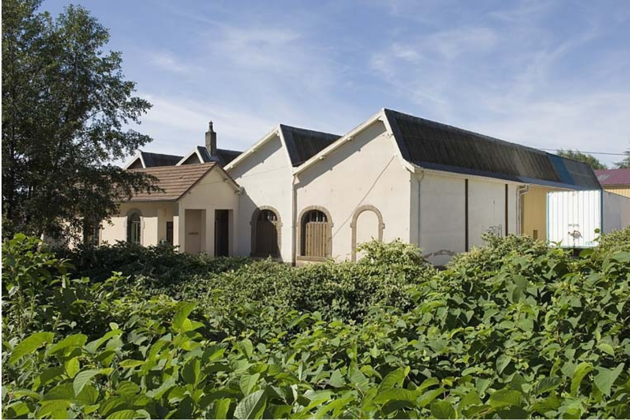
Bureau et atelier de fabrication vus de trois quarts.

70, Aillevillers-et-Lyaumont, lieudit : zone industrielle des Corbillottes