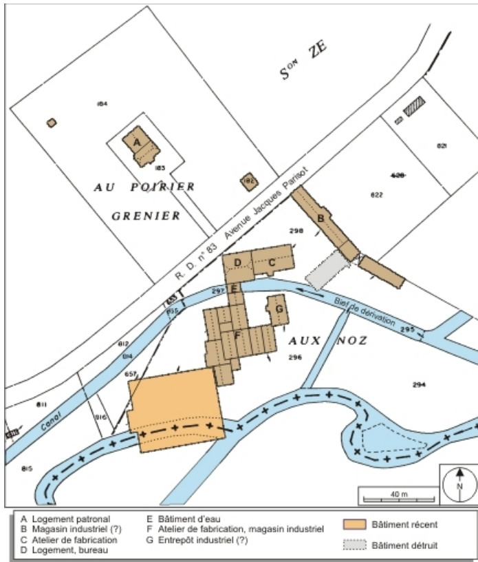
Plan-masse et de situation. Extrait du plan cadastral, 2008, section C, 1:1250 réduit à 1:1500.