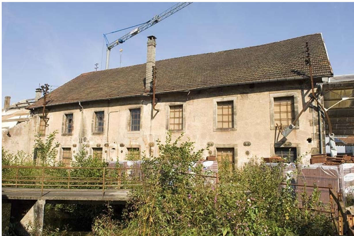
Façade sud de l'atelier de fabrication.