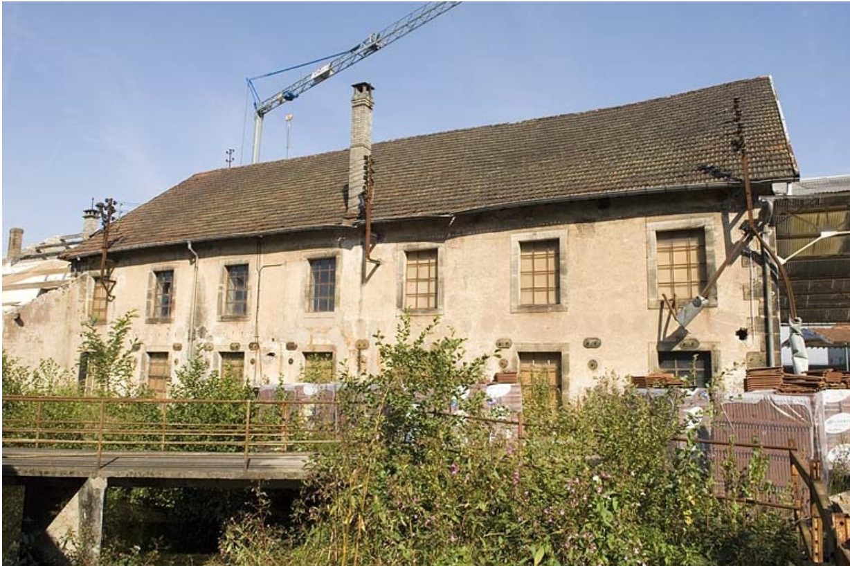
Façade sud de l'atelier de fabrication.