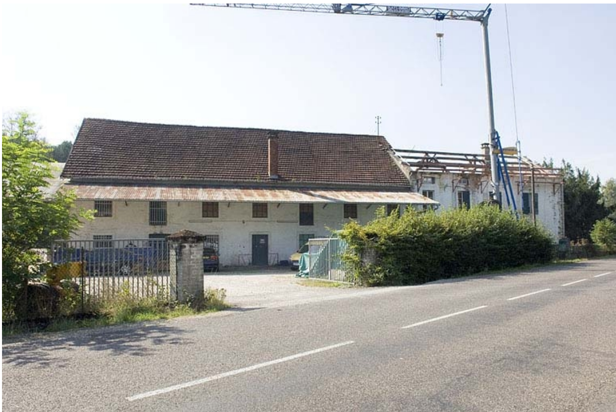
Vue d'ensemble depuis la rue.