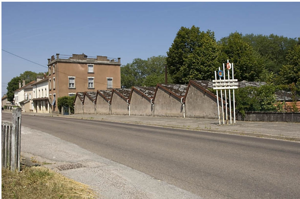
Logement, bureau et atelier de fabrication le long de l'avenue.