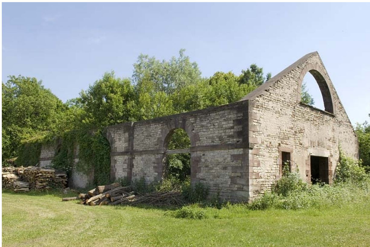
Atelier du laminier (en ruines). Vue de trois quarts droite.