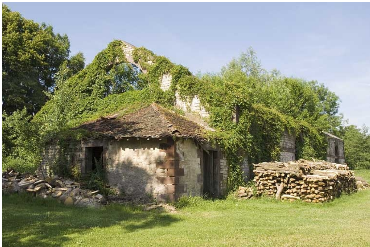
Atelier du laminier (en ruines) depuis l'est. 70, Magnoncourt rue de la Forge