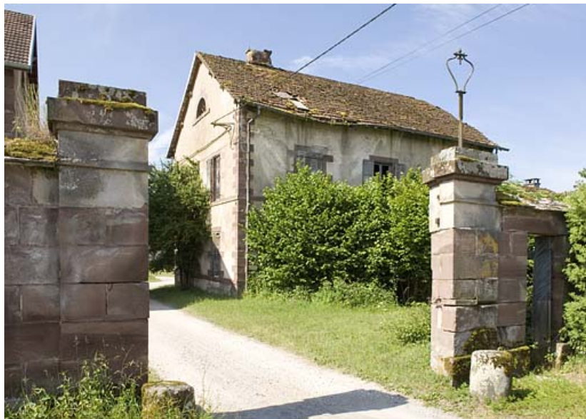
Piliers d'entrée et pavillon ouest.