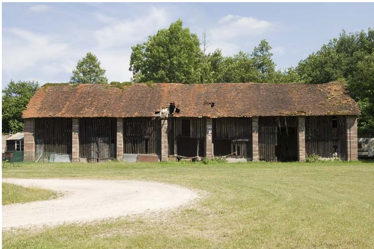
Halle à charbon et écurie vues de face.