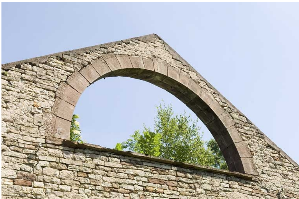
Atelier du laminier. Baie du pignon ouest. 70, Magnoncourt rue de la Forge