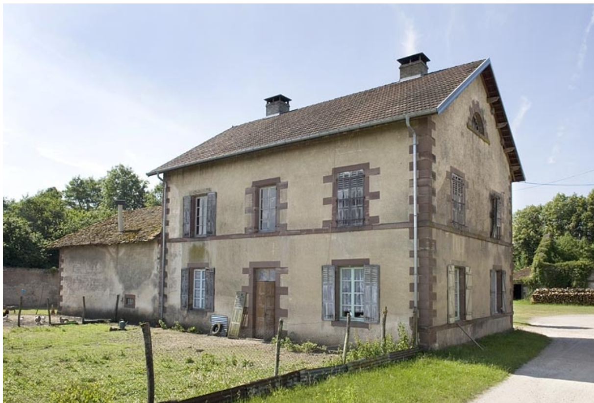
Pavillon est depuis le chemin d'accès. 70, Magnoncourt rue de la Forge