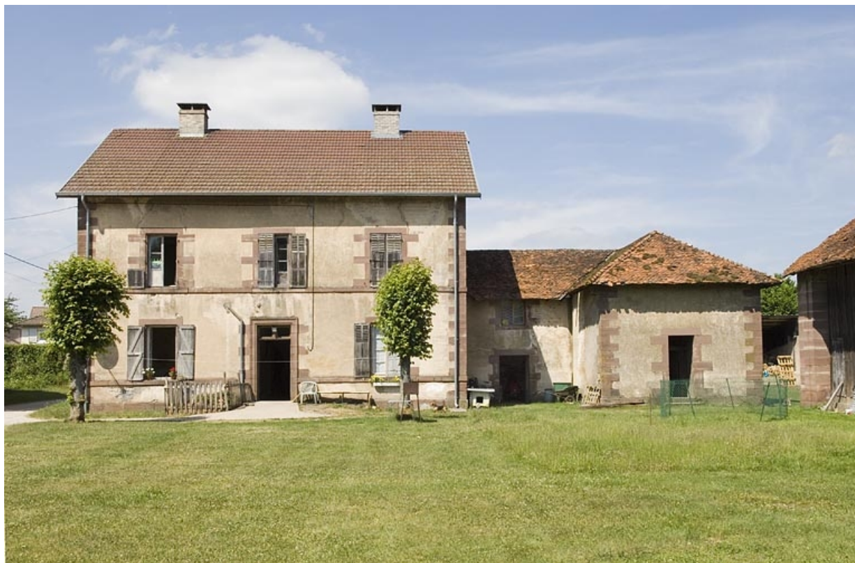
Pavillon est et dépendances depuis la cour.