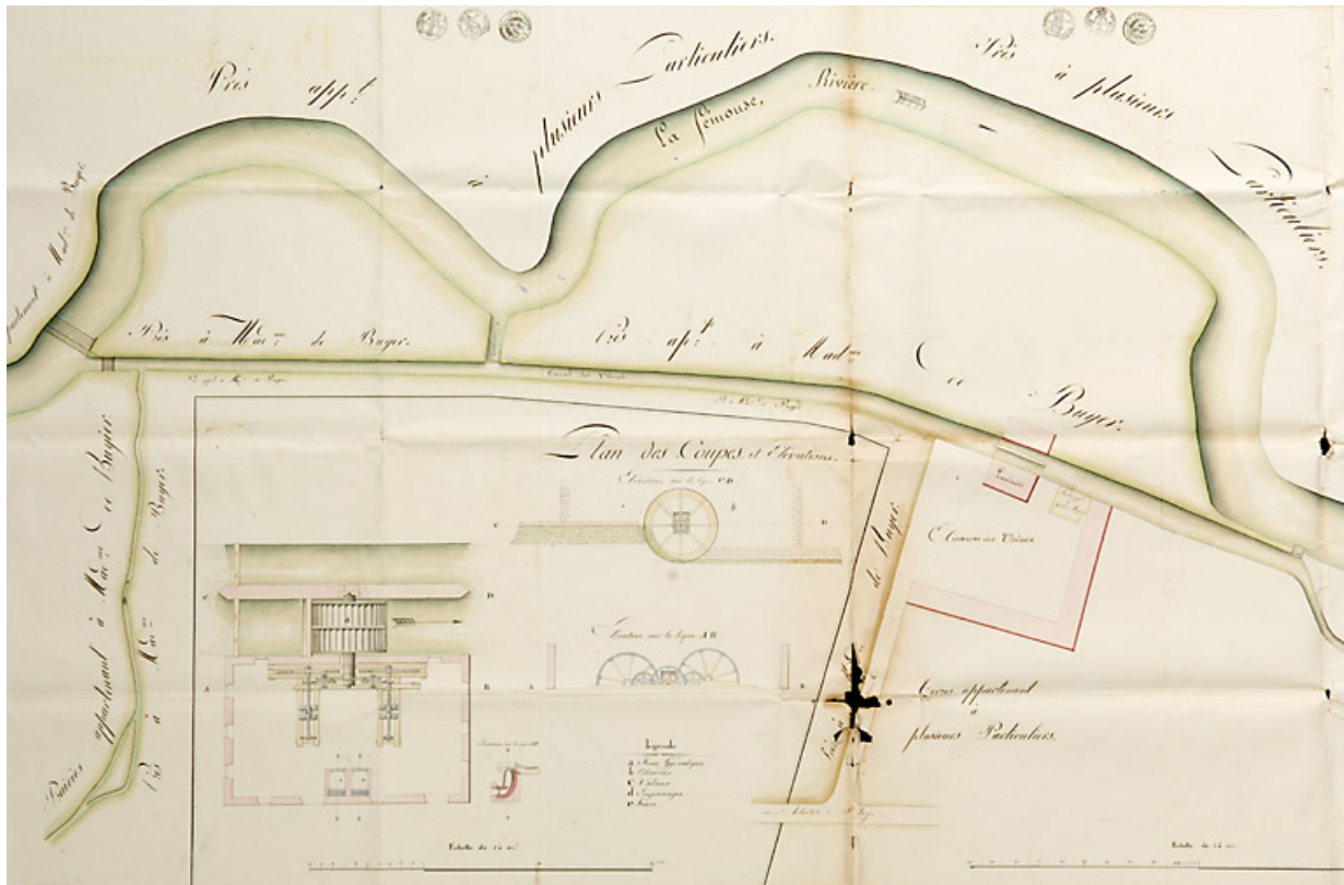
[Plan des coupes].