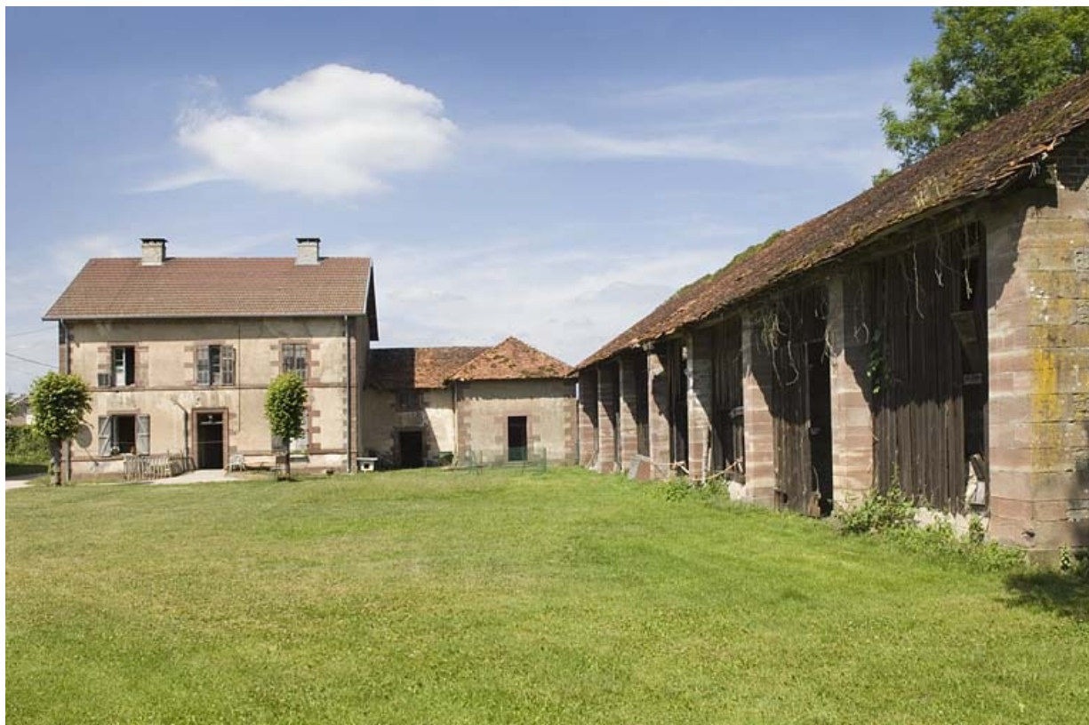
Pavillon est et halle à charbon.