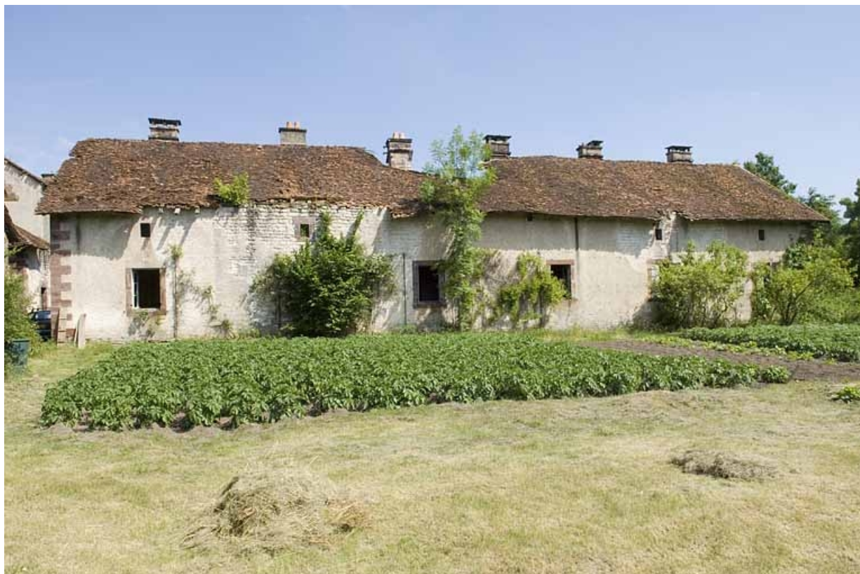
Façade postérieure du logement ouvrier.