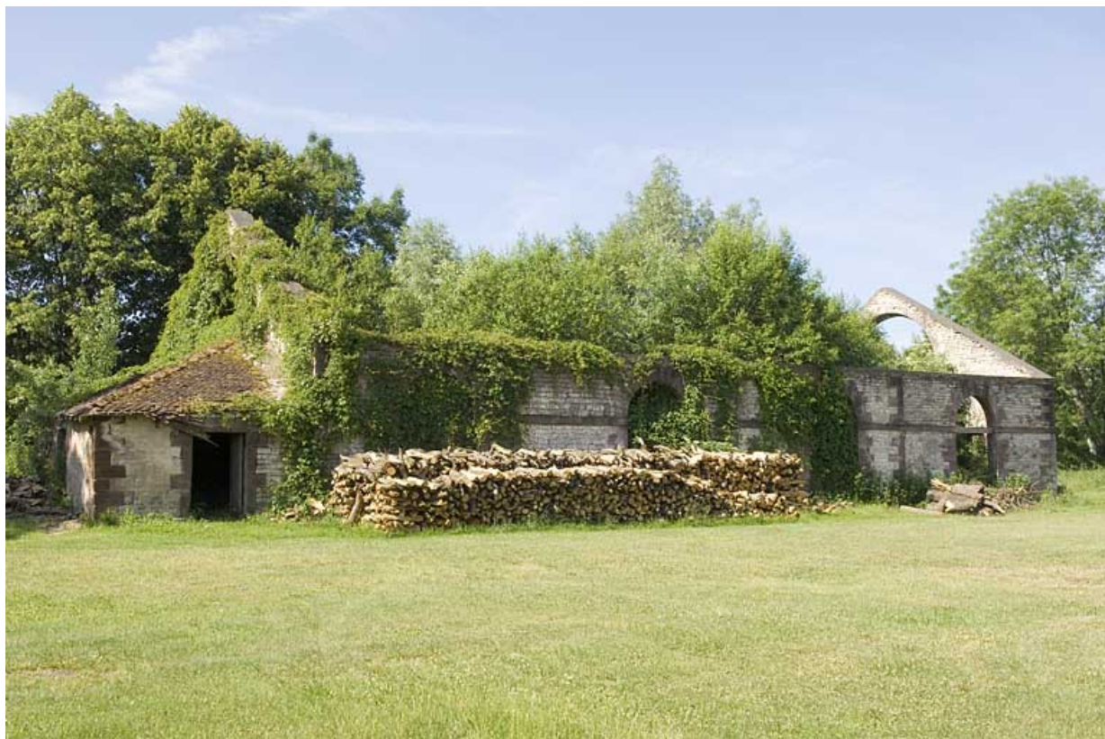
Atelier du laminier (en ruines). Vue de trois quarts gauche. 70, Magnoncourt rue de la Forge