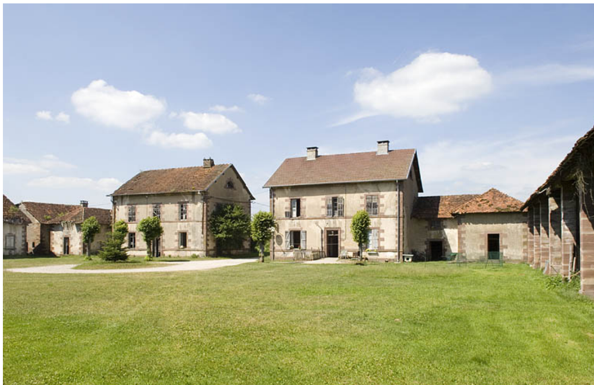
Vue d'ensemble depuis le sud de la cour.