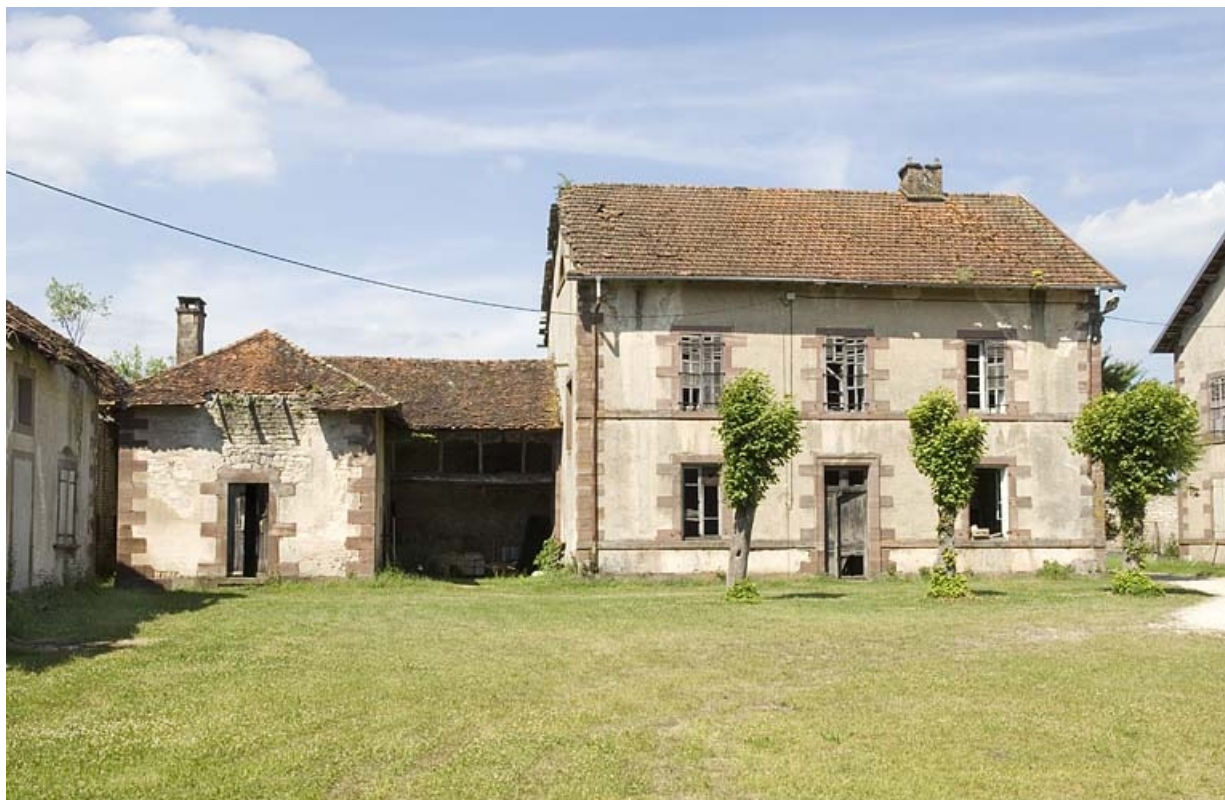
Pavillon ouest depuis la cour.