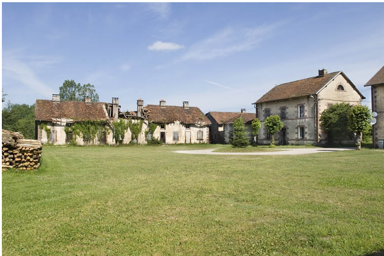
Vue d'ensemble depuis l'angle sud-est de la cour.