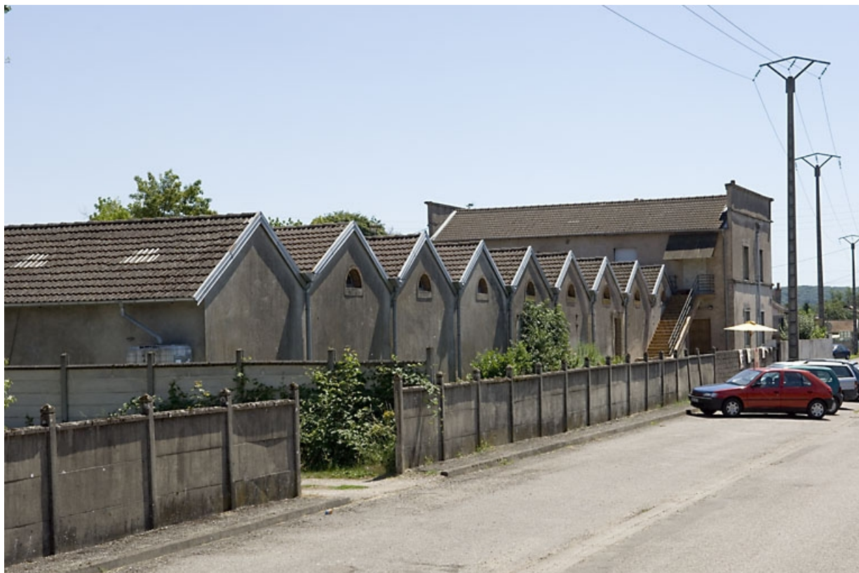
Pignons de l'atelier de fabrication sur la rue de la Retorderie.

70, Saint-Loup-sur-Semouse avenue Albert Thomas