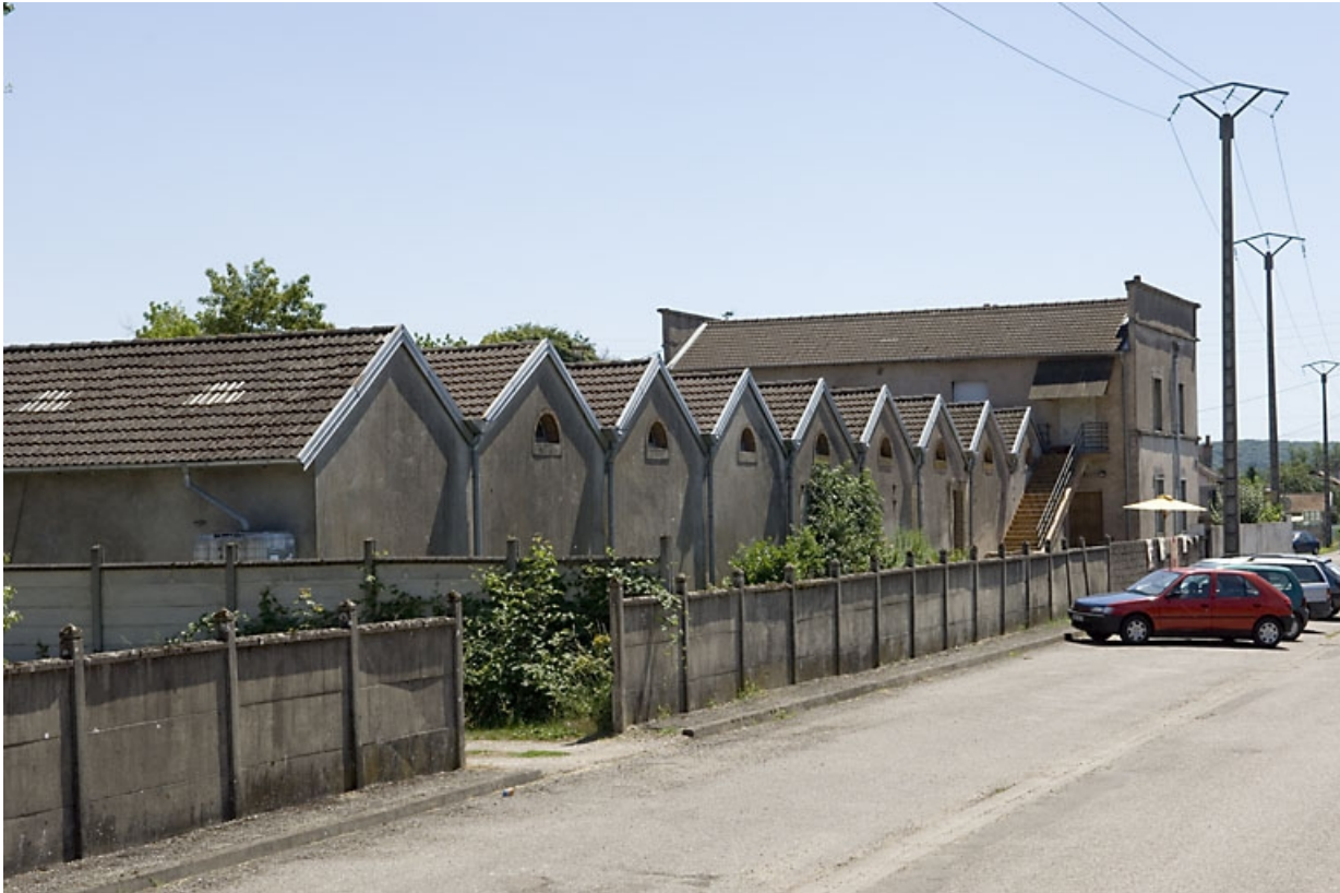
Pignons de l'atelier de fabrication sur la rue de la Retorderie.

70, Saint-Loup-sur-Semouse avenue Albert Thomas