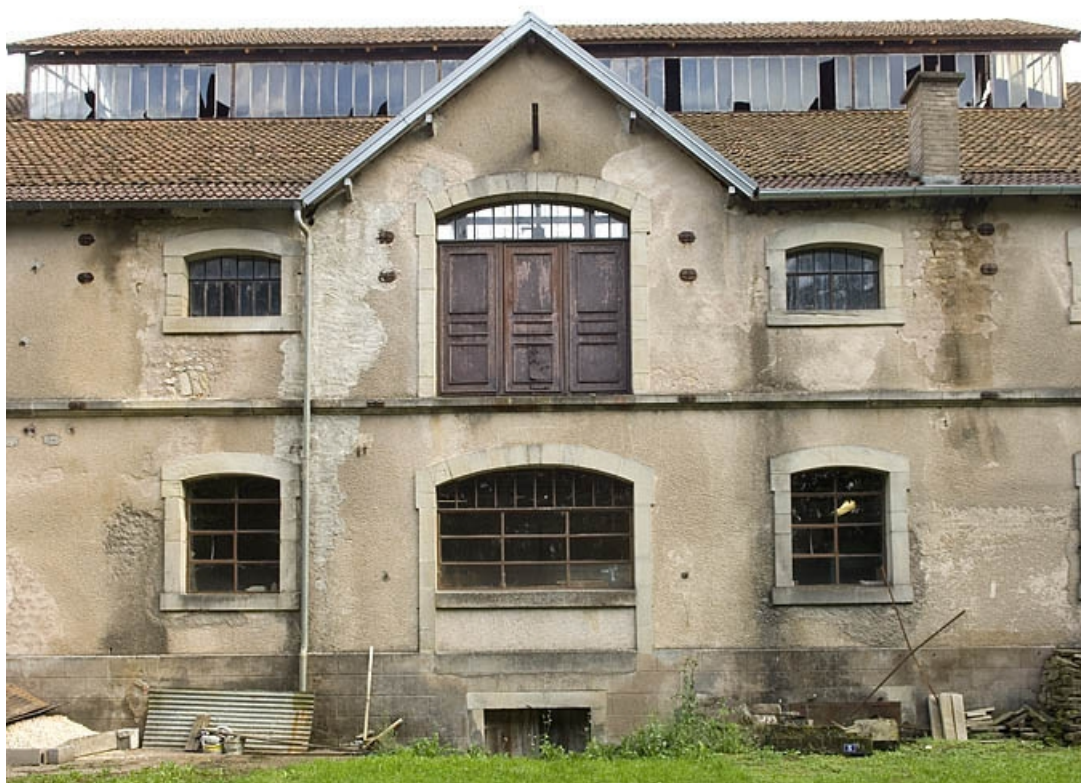
Travée centrale de la façade postérieure.

70, Saint-Loup-sur-Semouse rue des Jardins