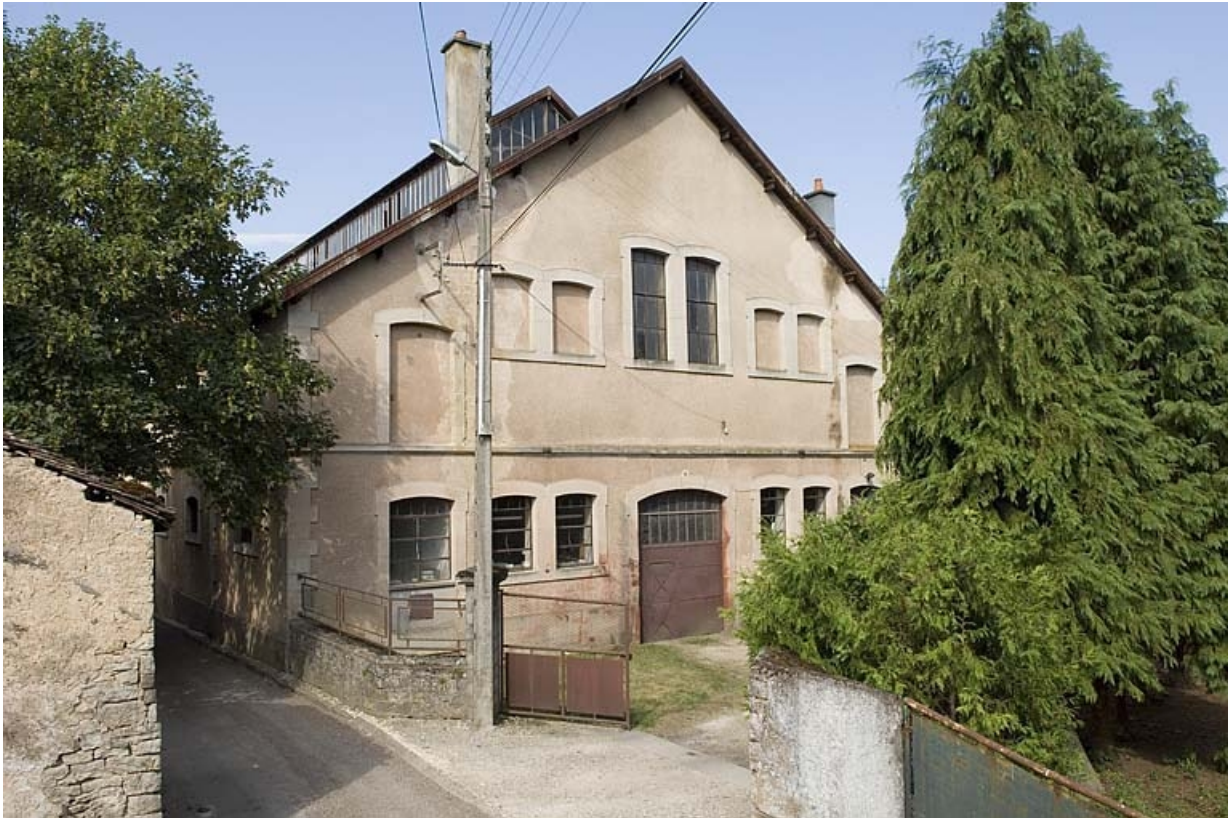
Vue sur le pignon oriental.

70, Saint-Loup-sur-Semouse rue des Jardins