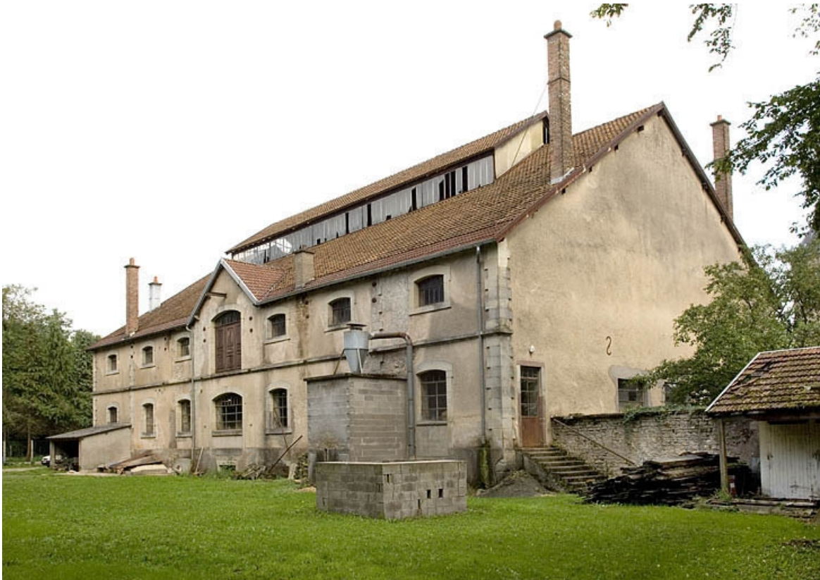
Vue de trois quarts arrière.

70, Saint-Loup-sur-Semouse rue des Jardins