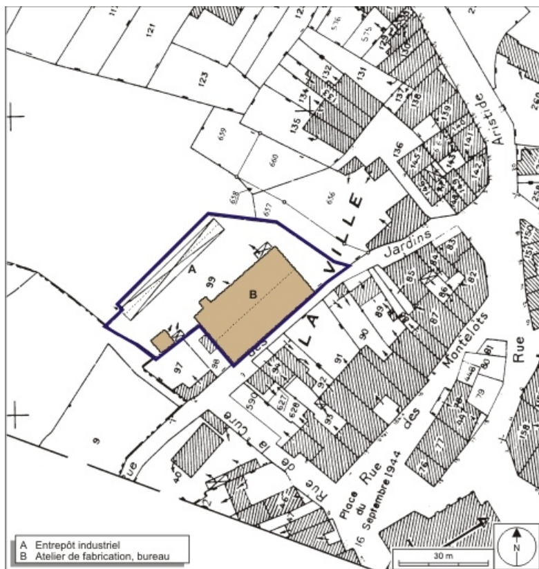
Plan-masse et de situation. Extrait du plan cadastral, 2008, section AB, 1:1000. Source : Direction générale des Finances Publiques - Cadastre ; mise à jour : 2008.

70, Saint-Loup-sur-Semouse rue des Jardins