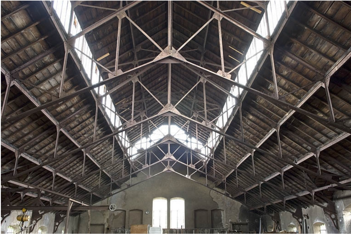
Vue de la charpente métallique.

70, Saint-Loup-sur-Semouse rue des Jardins