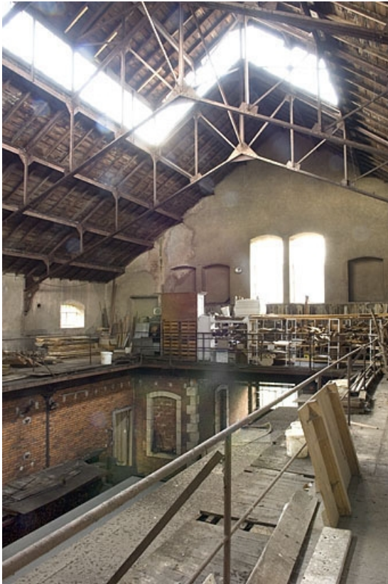
Disposition intérieure. Vue d'ensemble.

70, Saint-Loup-sur-Semouse rue des Jardins