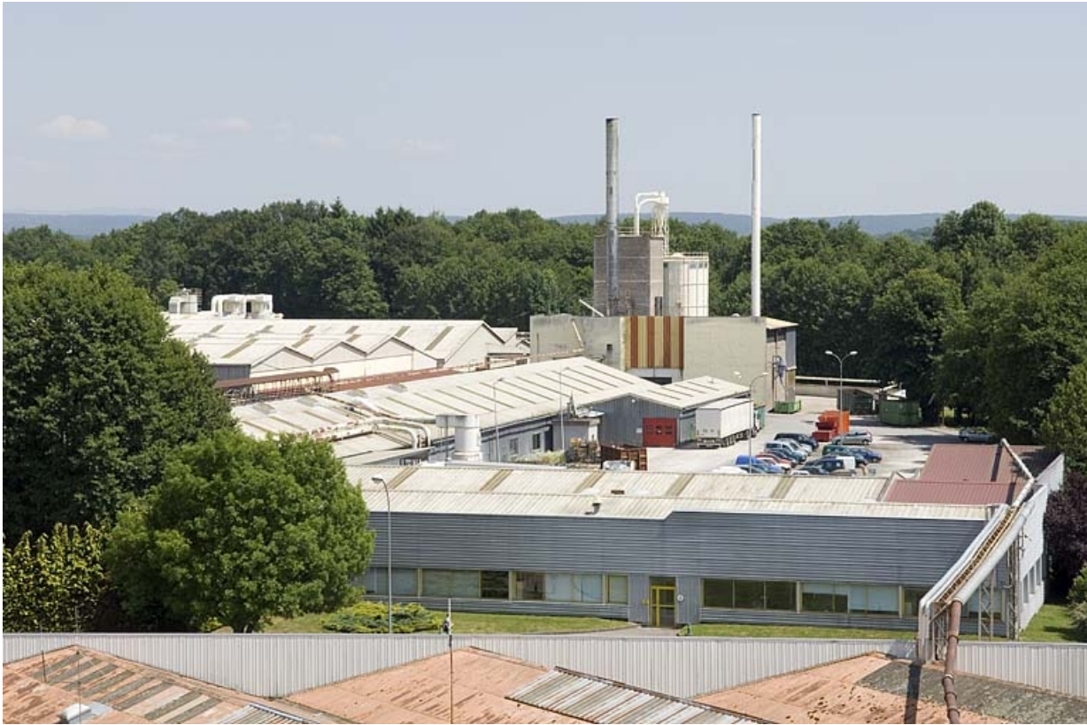
Partie sud de l'usine de meubles.