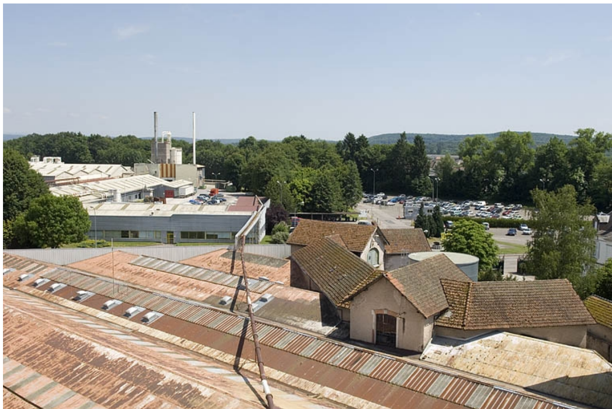
Vue depuis un silo : usine de meubles et atelier de saboterie.

70, Saint-Loup-sur-Semouse, 15 avenue Jacques Parisot