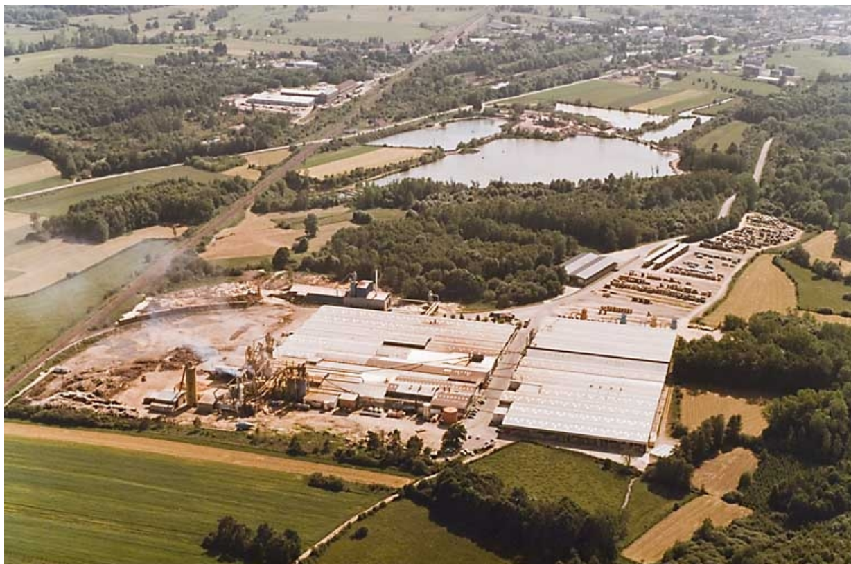
Usine de panneaux de particules de bois, dite Cie française du Panneau. Vue aérienne depuis le nord-est. 70, Saint-Loup-sur-Semouse, 15 avenue Jacques Parisot