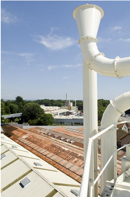
Partie sud de l'usine de meubles depuis un silo.

70, Saint-Loup-sur-Semouse, 15 avenue Jacques Parisot