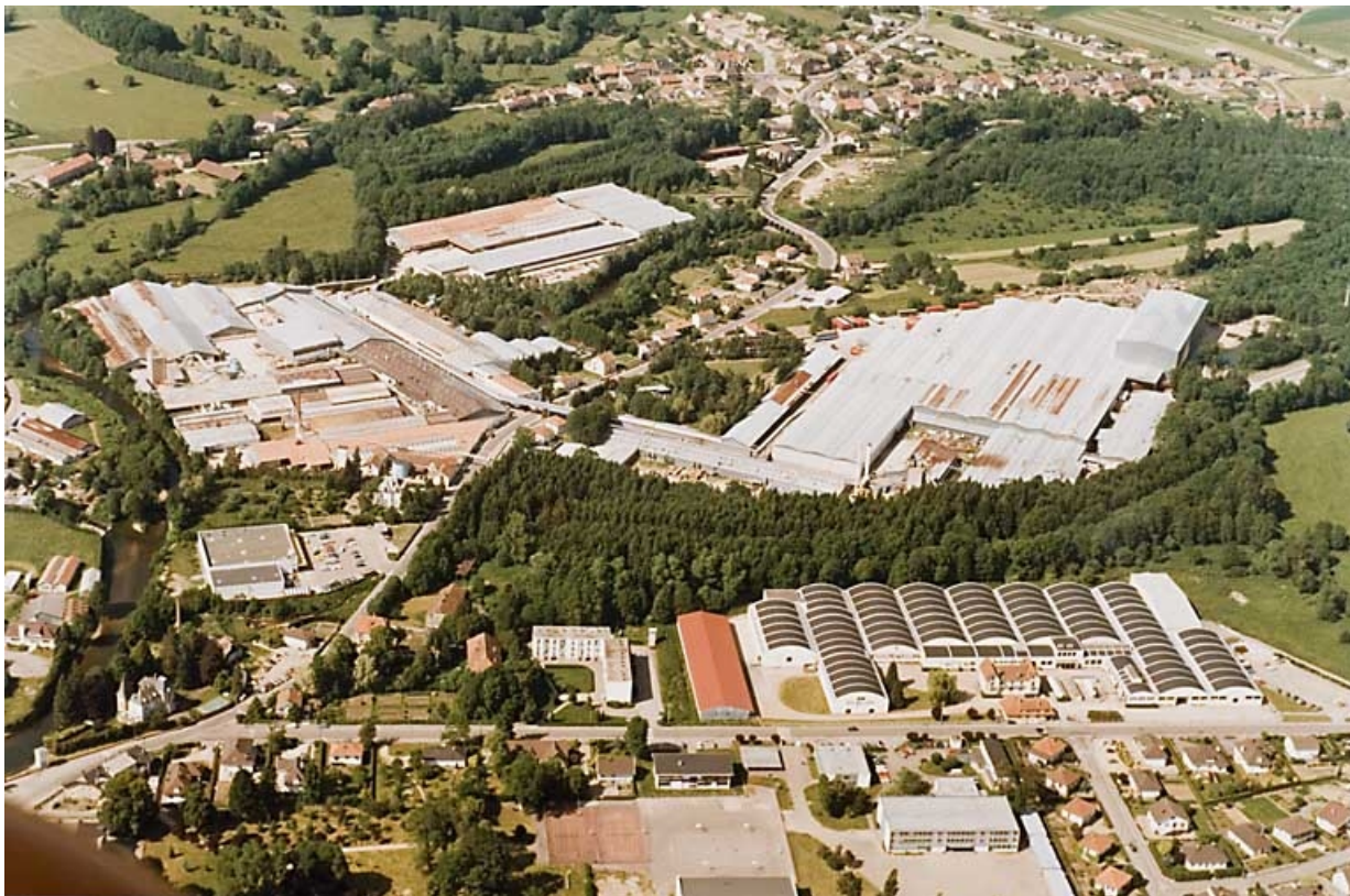
Vue aérienne depuis le sud.

70, Saint-Loup-sur-Semouse, 15 avenue Jacques Parisot