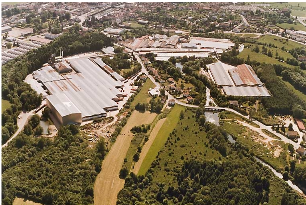
Vue aérienne depuis l'est.

70, Saint-Loup-sur-Semouse, 15 avenue Jacques Parisot