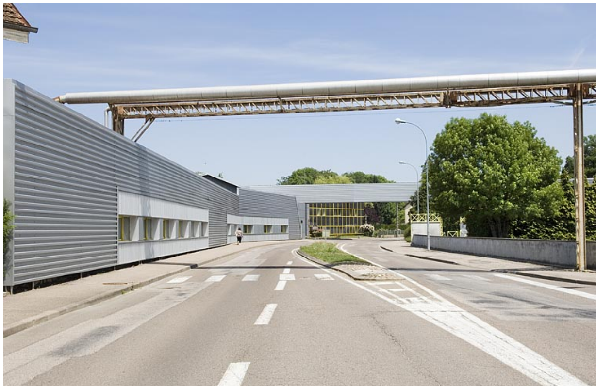
Vue de l'usine depuis l'avenue Jacques Parisot.

70, Saint-Loup-sur-Semouse, 15 avenue Jacques Parisot