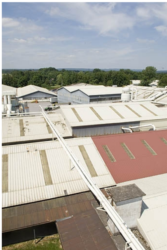
Toitures de l'usine de meubles, vers le nord-est (cadrage vertical).

70, Saint-Loup-sur-Semouse, 15 avenue Jacques Parisot