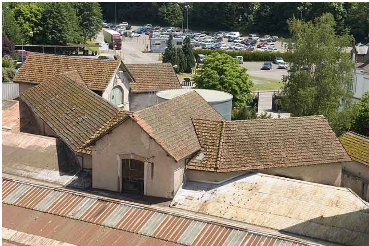
Vue rapprochée de l'atelier de saboterie (?).

70, Saint-Loup-sur-Semouse, 15 avenue Jacques Parisot