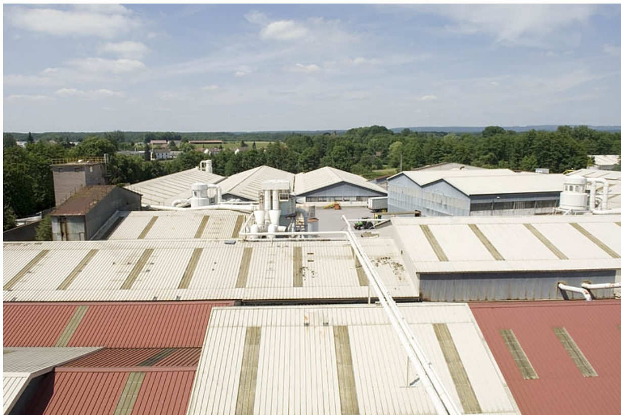
Toitures de l'usine de meubles, vers le nord-est.

70, Saint-Loup-sur-Semouse, 15 avenue Jacques Parisot