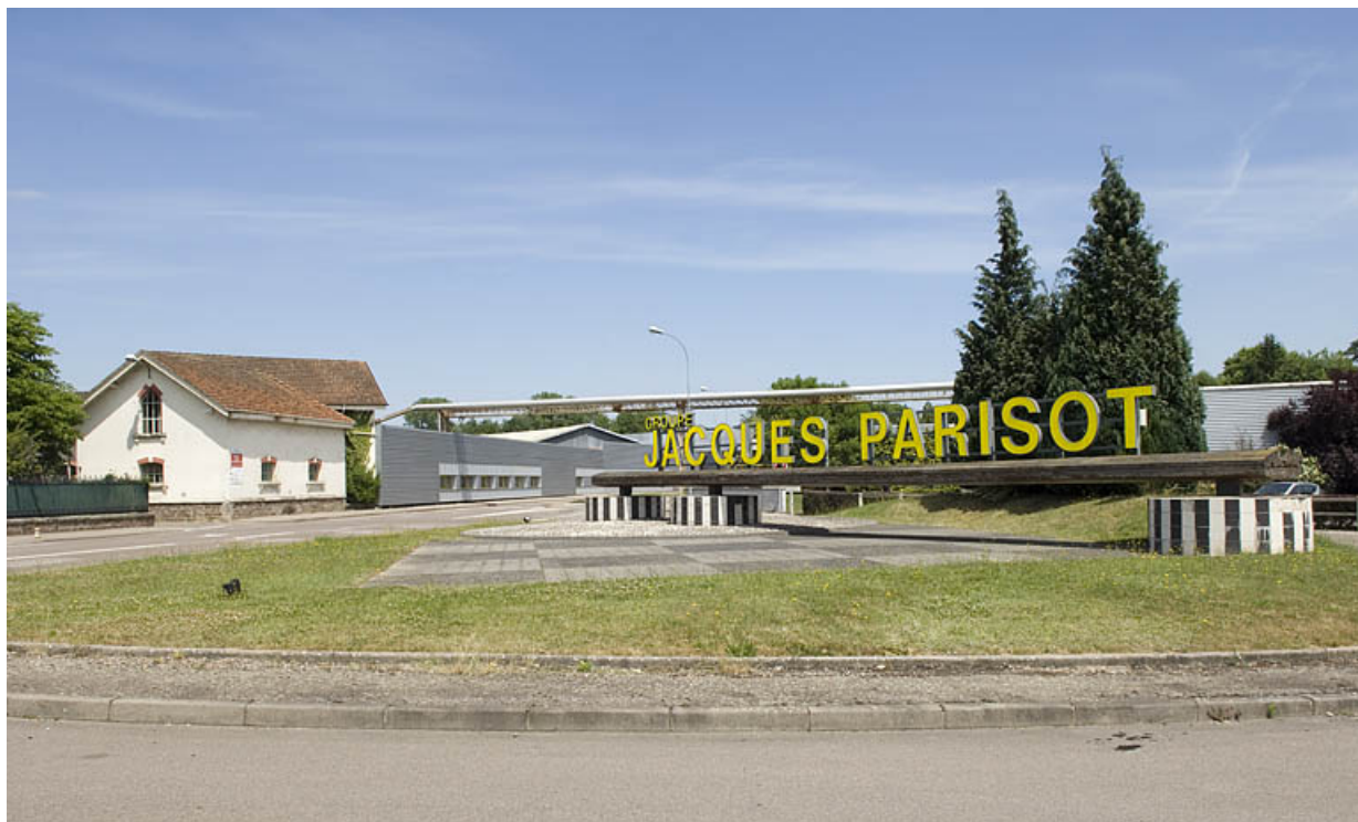
Enseigne de la société depuis le parking d'entrée.

70, Saint-Loup-sur-Semouse, 15 avenue Jacques Parisot