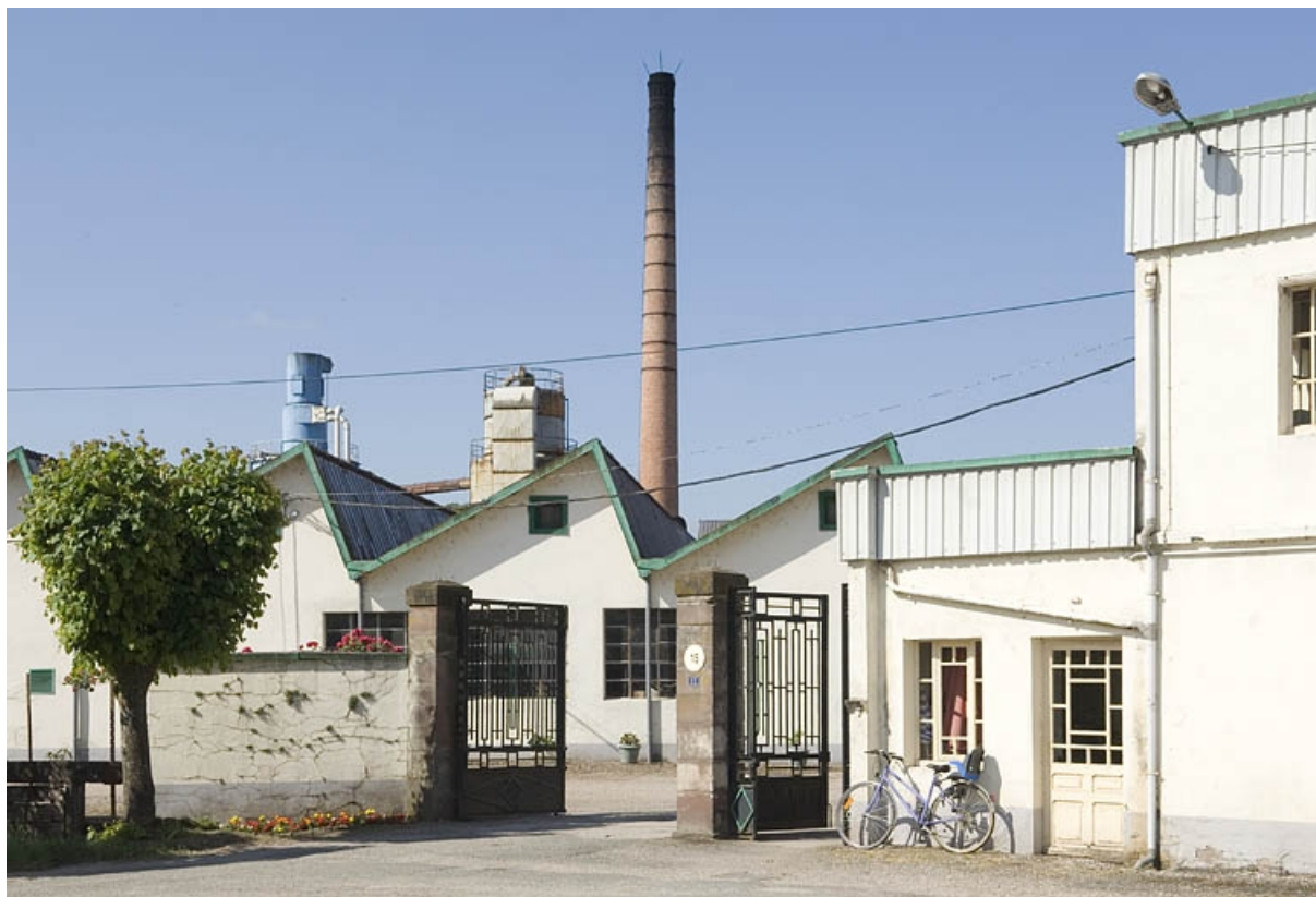
Vue de l'entrée.