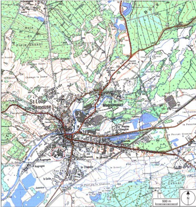
Carte de localisation. Carte topographique au 1:25000, I.G.N., Saint-Loup-sur-Semouse, 3419 O. SCAN 25 © IGN - 2008, Licence n°2008CISE29-68.

70, Saint-Loup-sur-Semouse, 11 rue de la Croix Parthey, lieudit : au Grand Baigneux