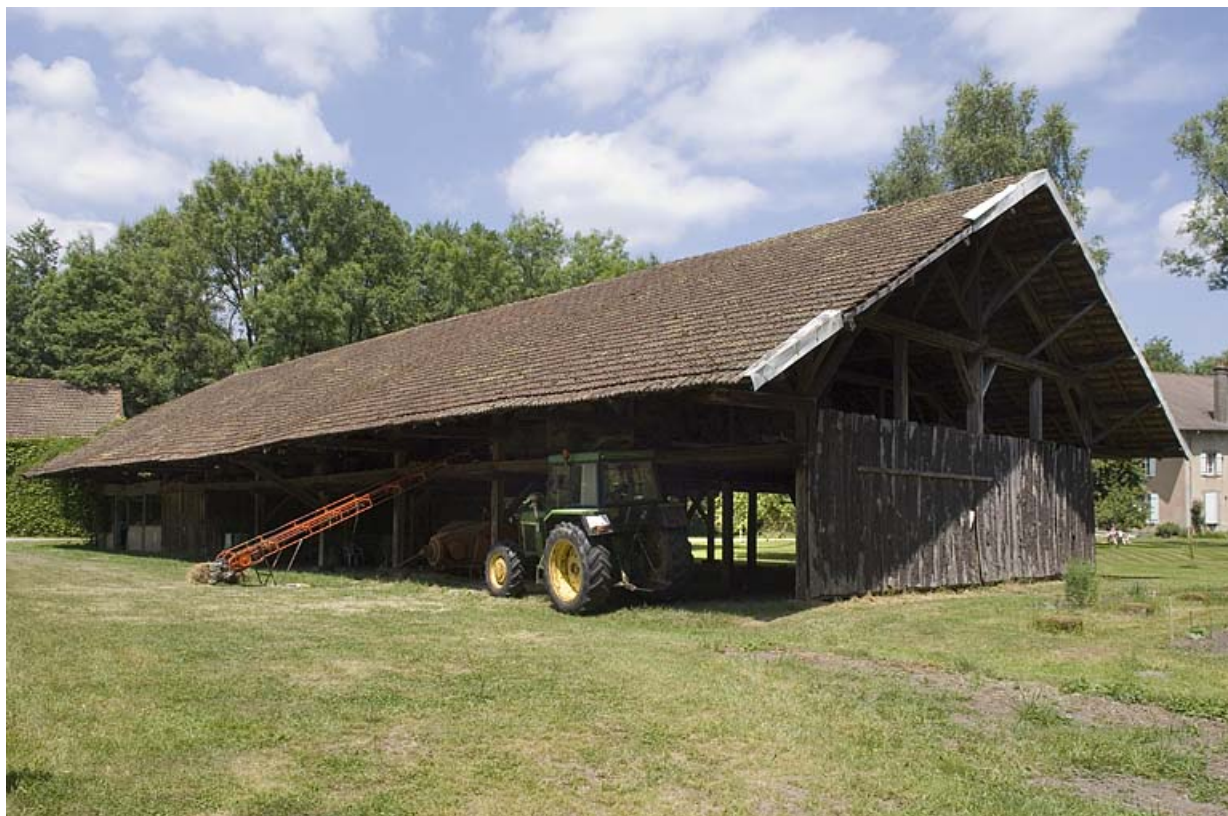
Entrepôt industriel vu depuis le sud.