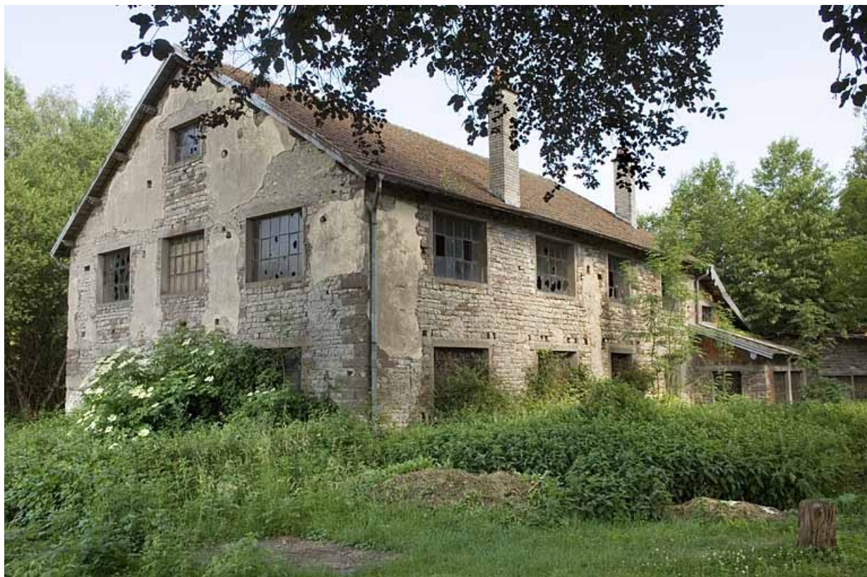
Bureau (?) depuis l'ouest.