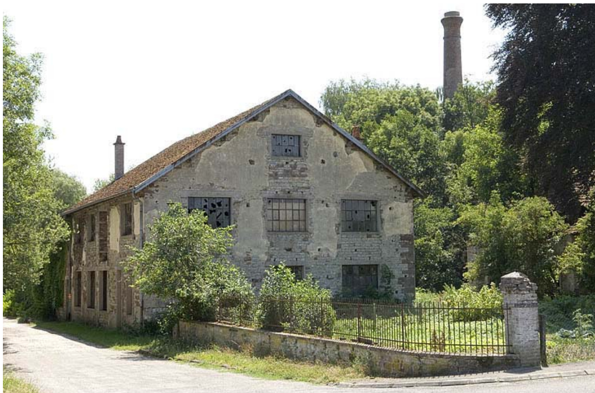
Vue d'ensemble depuis l'entrée.