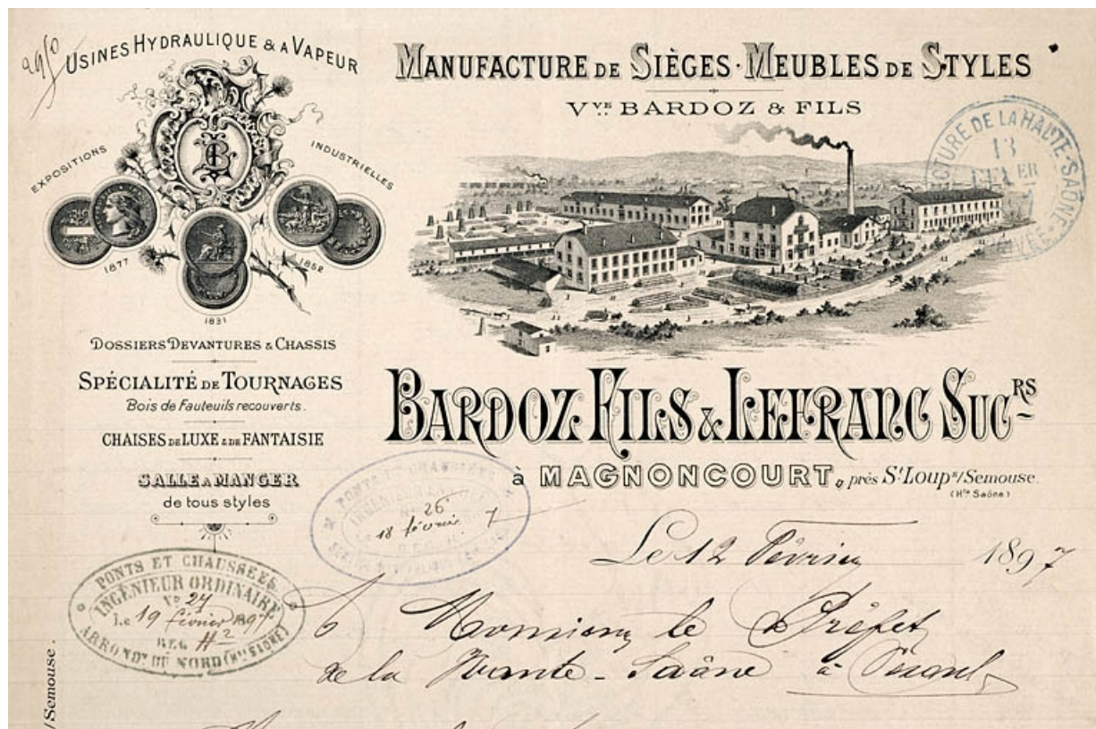
Manufacture de sièges - Meubles de styles Vve Bardoz et Fils - Bardoz fils et Lefranc successeurs à Magnoncourt. 70, Saint-Loup-sur-Semouse R.D. 10