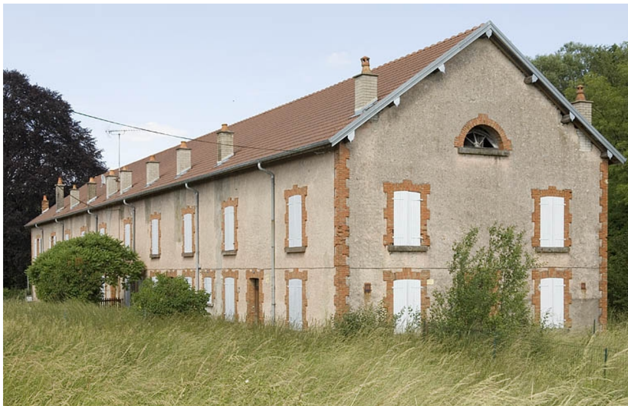
Logement ouvrier dit cité Saint-Anne. Vue depuis le sud-ouest.