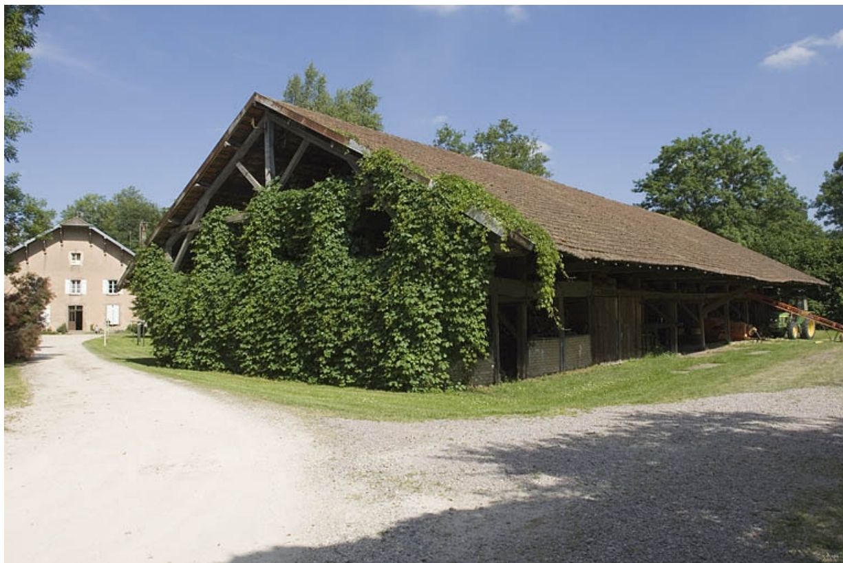
Entrepôt industriel vu depuis l'ouest.