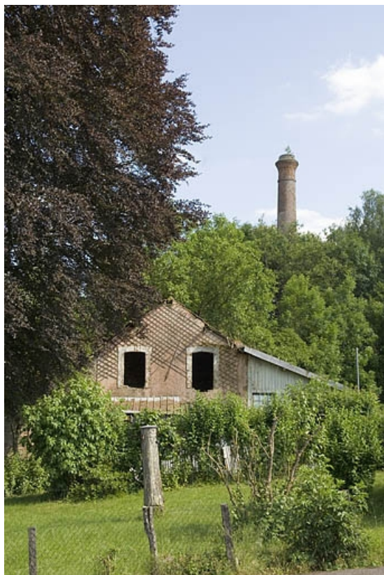
Dépendance située entre l'usine et la cité Saint-Anne.