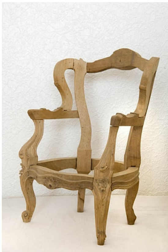
Modèle réduit d'un fauteuil de style Louis XV.

70, Saint-Loup-sur-Semouse, 15 avenue de Conflans