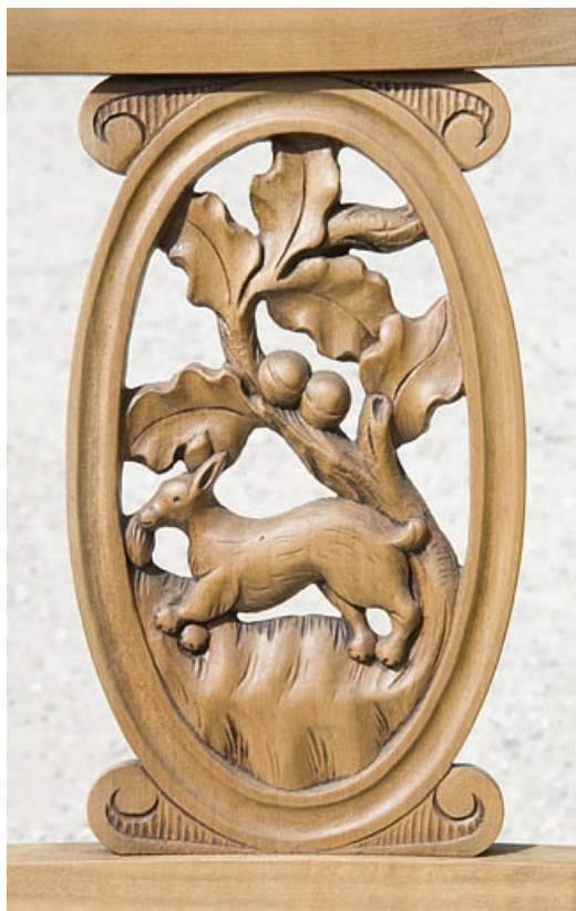
Détail d'un dossier de chaise. Motif figuré.

70, Saint-Loup-sur-Semouse, 15 avenue de Conflans