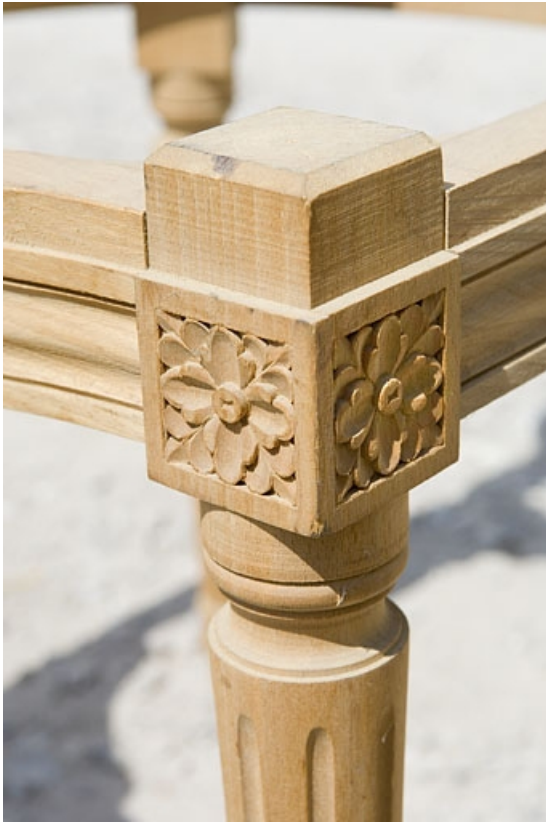
Partie supérieure d'un pied de chaise.

70, Saint-Loup-sur-Semouse, 15 avenue de Conflans