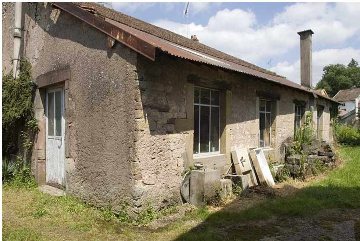
Façade sud de l'ancien moulin.

70, Saint-Loup-sur-Semouse, 15 avenue de Conflans