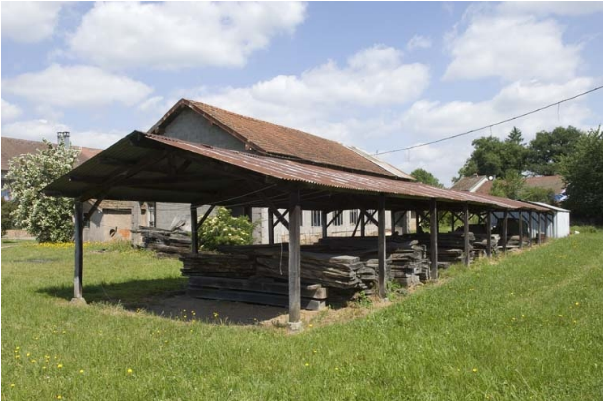
Entrepôt industriel (séchage et stockage du bois).