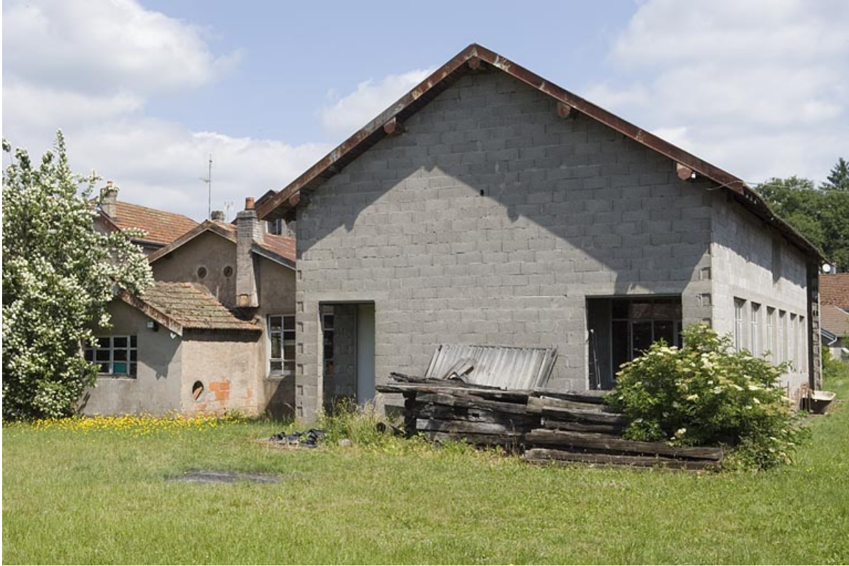
Ancien moulin et atelier de menuiserie.

70, Saint-Loup-sur-Semouse, 15 avenue de Conflans