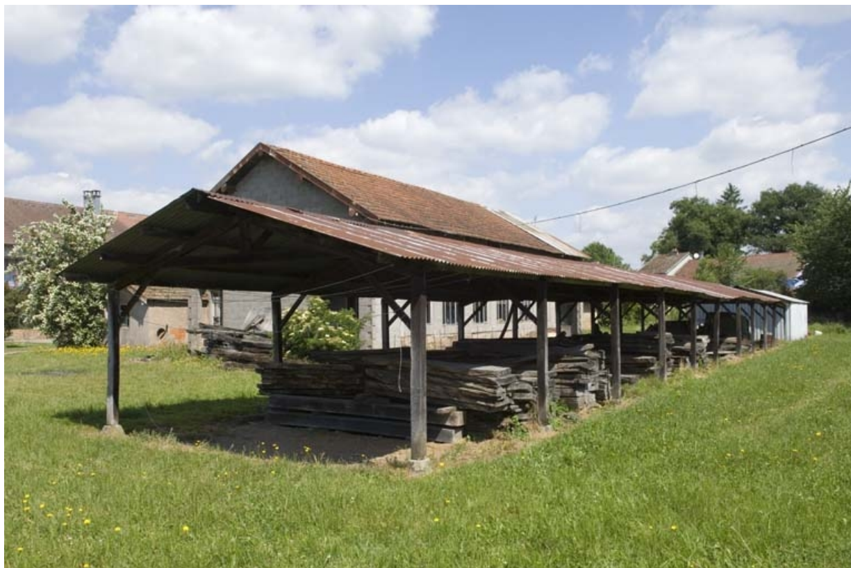
Entrepôt industriel (séchage et stockage du bois).