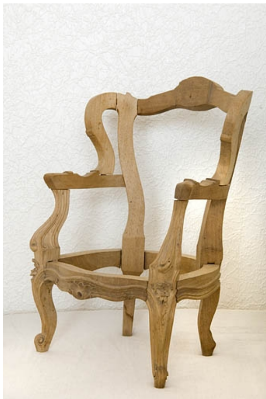
Modèle réduit d'un fauteuil de style Louis XV.

70, Saint-Loup-sur-Semouse, 15 avenue de Conflans