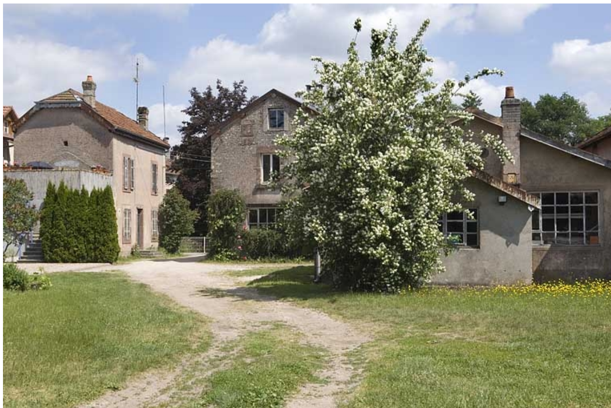
Logement, moulin et atelier de menuiserie depuis l'ouest.

70, Saint-Loup-sur-Semouse, 15 avenue de Conflans