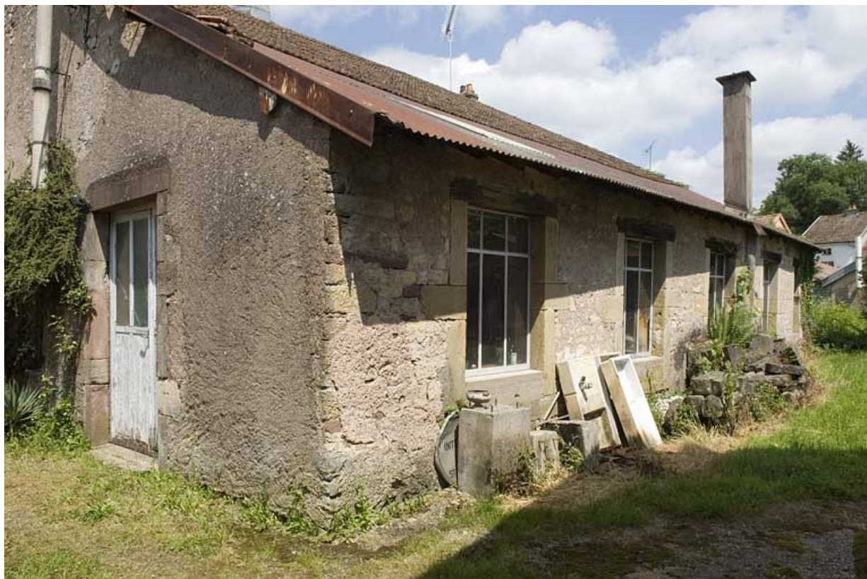
Façade sud de l'ancien moulin.

70, Saint-Loup-sur-Semouse, 15 avenue de Conflans