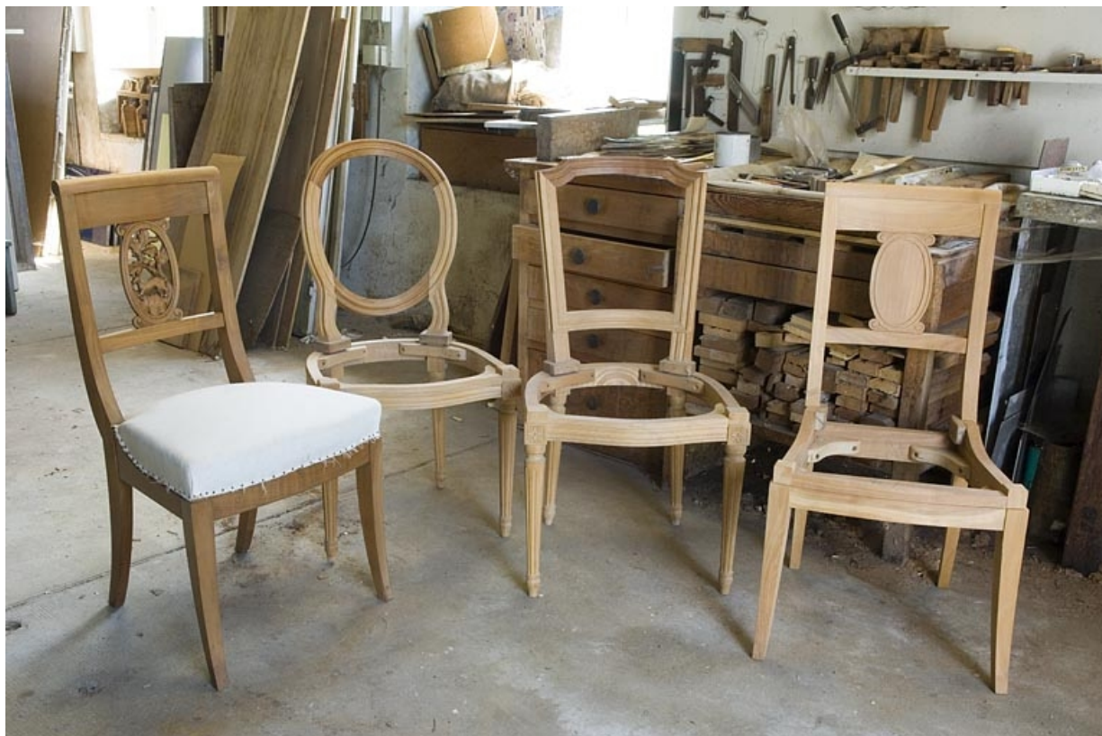
Types de chaise produite dans l'établissement.