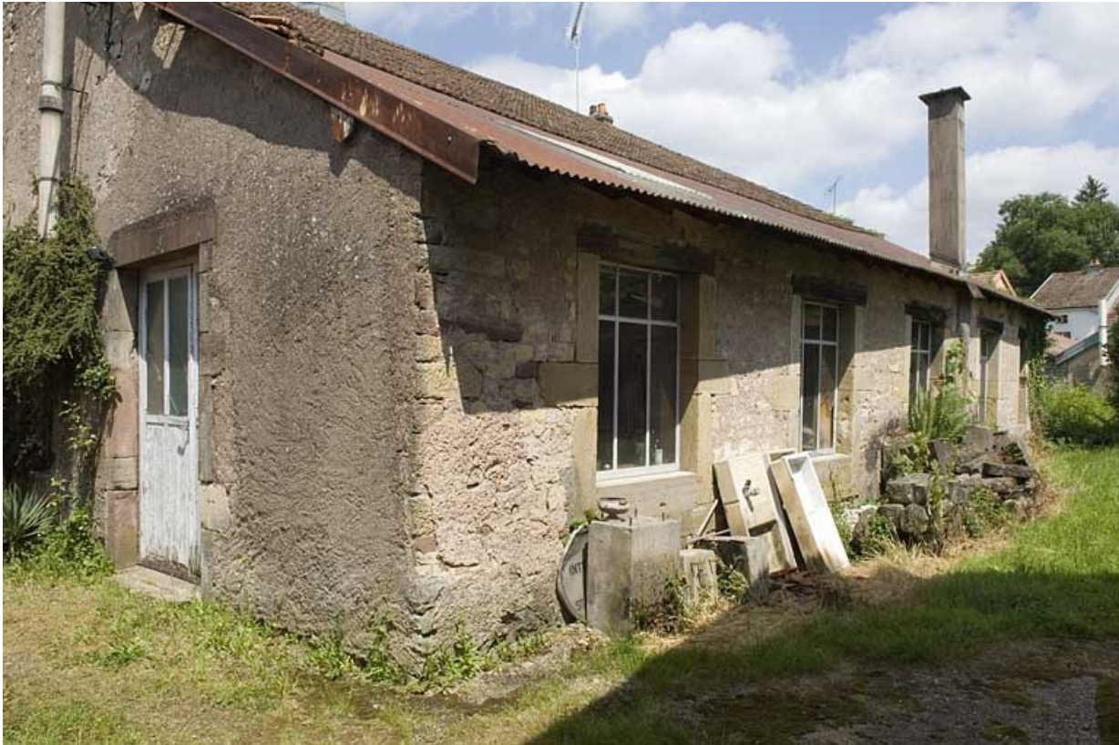
Façade sud de l'ancien moulin.

70, Saint-Loup-sur-Semouse, 15 avenue de Conflans