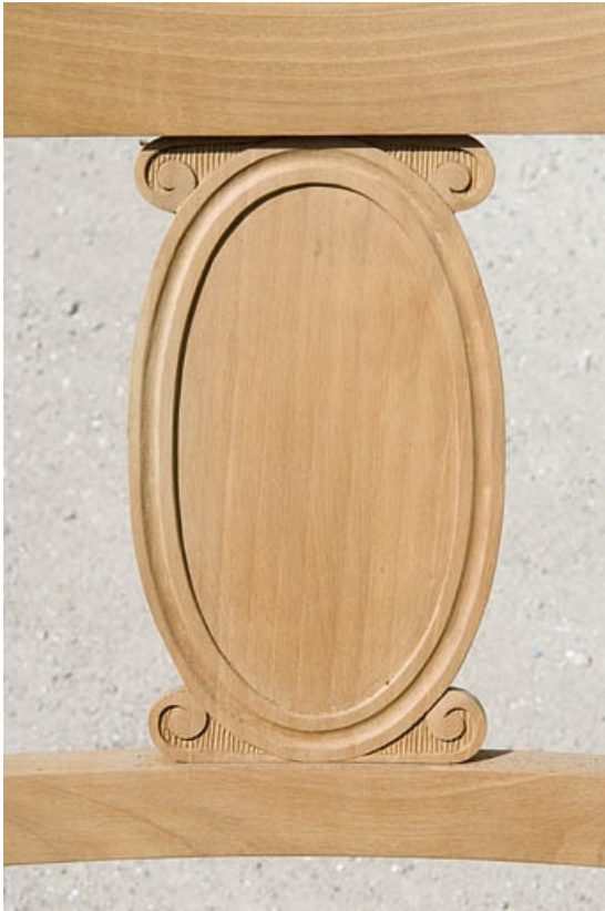
Détail d'un dossier de chaise.

70, Saint-Loup-sur-Semouse, 15 avenue de Conflans