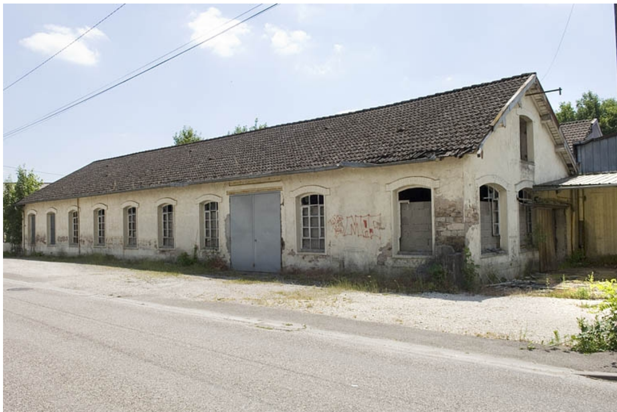
Atelier de fabrication sur rue. Vue de trois quarts droite.

70, Saint-Loup-sur-Semouse, 32 rue de la Viotte