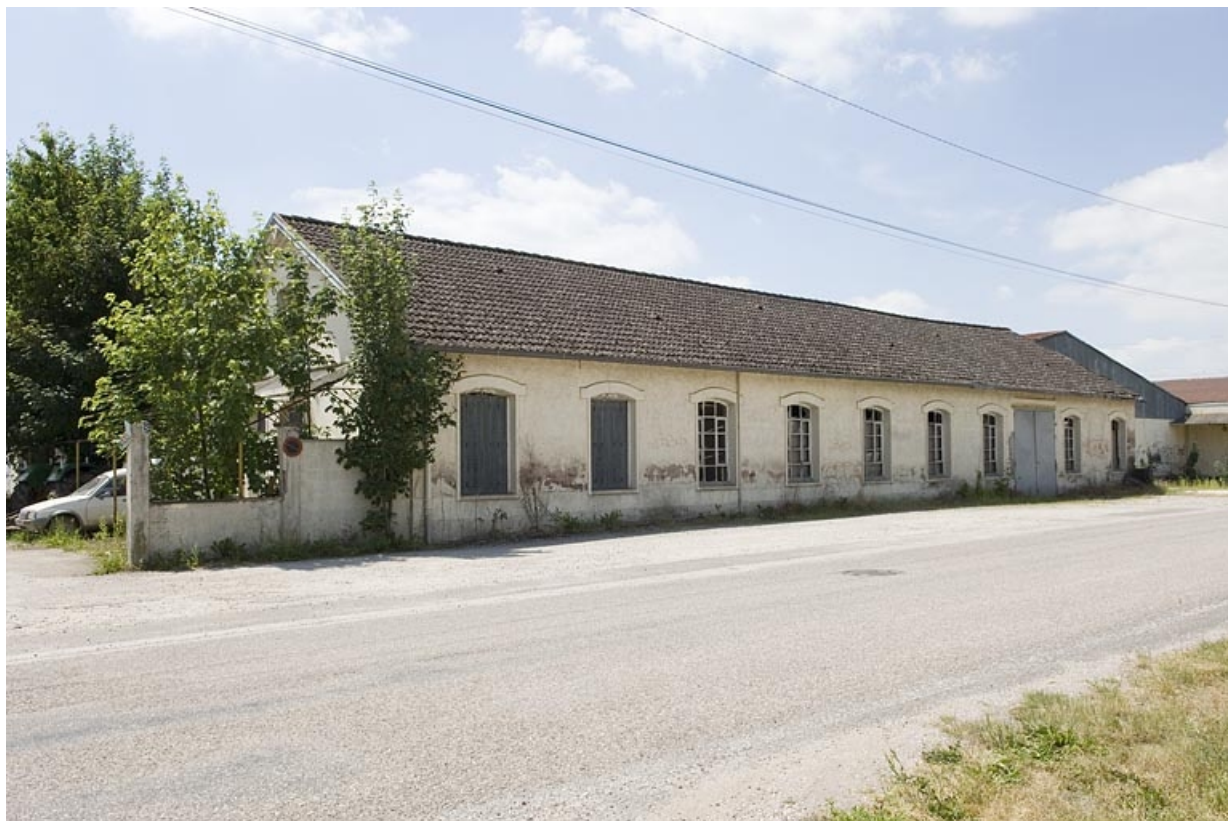
Atelier de fabrication sur rue. Vue de trois quarts gauche.

70, Saint-Loup-sur-Semouse, 32 rue de la Viotte