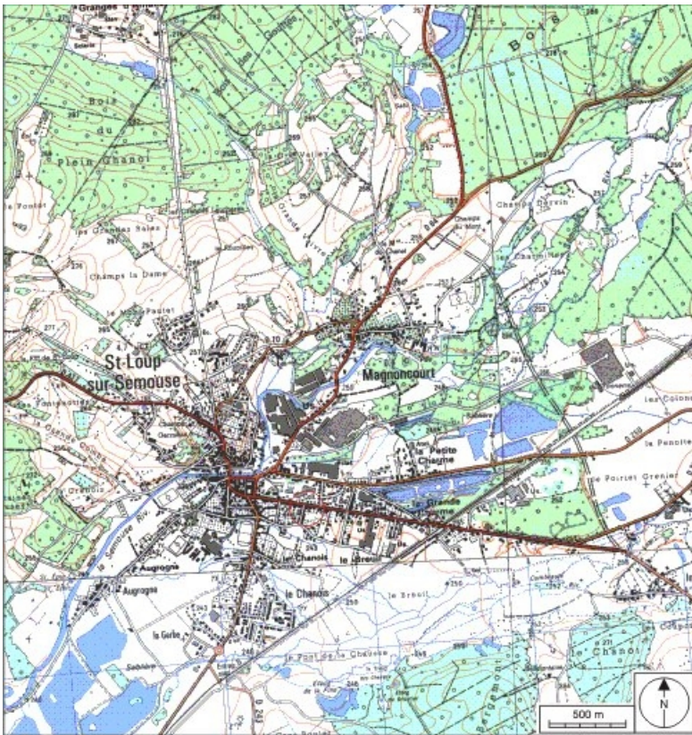
Carte de localisation. Carte topographique au 1:25000, I.G.N., Saint-Loup-sur-Semouse, 3419 O. SCAN 25 © IGN - 2008, Licence n°2008CISE29-68.

70, Saint-Loup-sur-Semouse, 56 avenue Albert Thomas