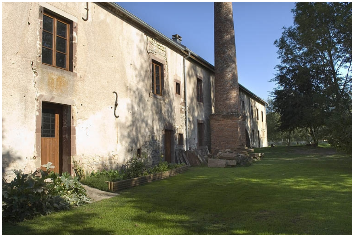
Façade postérieure vue de trois quarts.

70, Saint-Loup-sur-Semouse, 41 avenue d' Augrogne