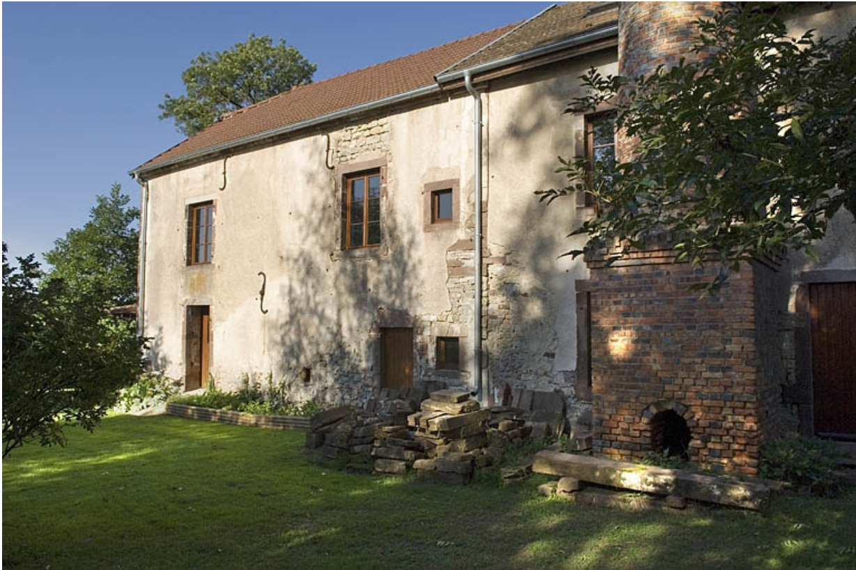
Partie sud (logement) de la façade postérieure.

70, Saint-Loup-sur-Semouse, 41 avenue d' Augrogne