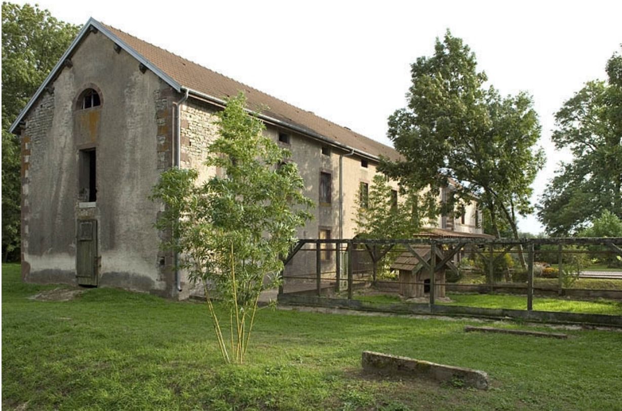
Vue d'ensemble, de trois quarts.

70, Saint-Loup-sur-Semouse, 41 avenue d' Augrogne