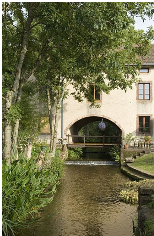
Passage du bief de dérivation sous le bâtiment.

70, Saint-Loup-sur-Semouse, 41 avenue d' Augrogne