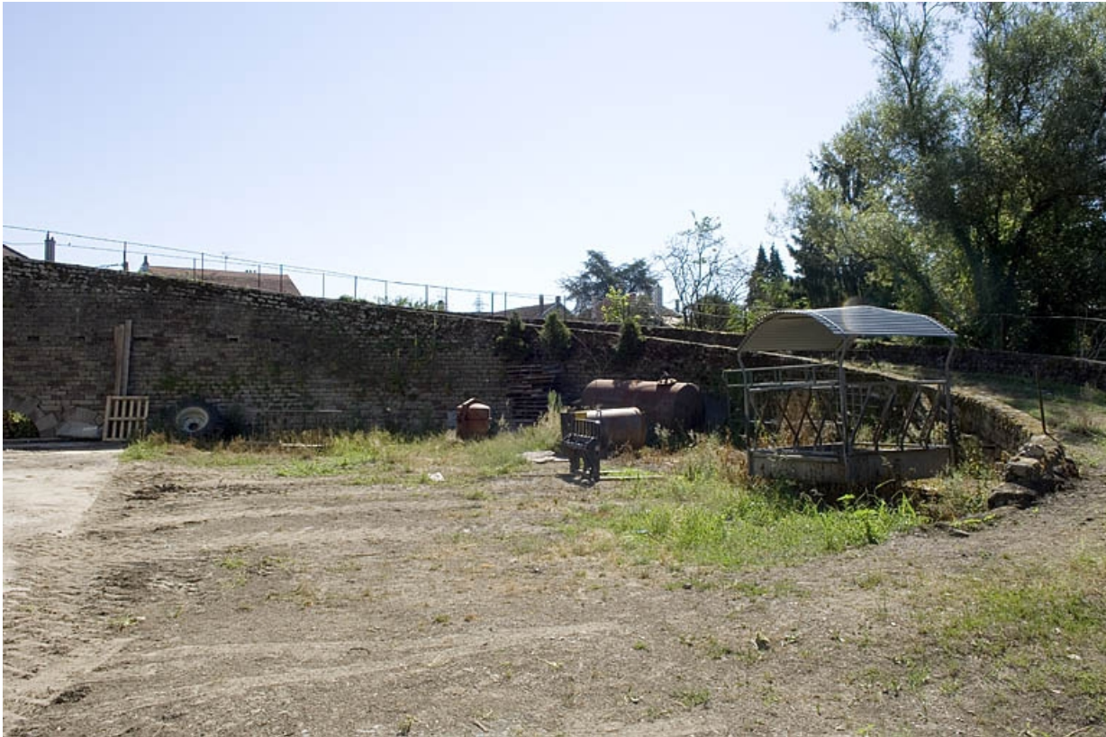
La rampe d'accès au pignon sud.

70, Conflans-sur-Lanterne rue du Principal