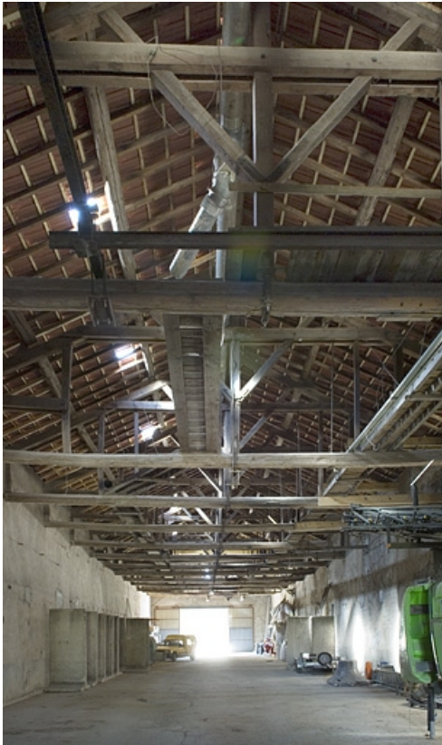
Intérieur de l'atelier de fabrication.

70, Conflans-sur-Lanterne rue du Principal