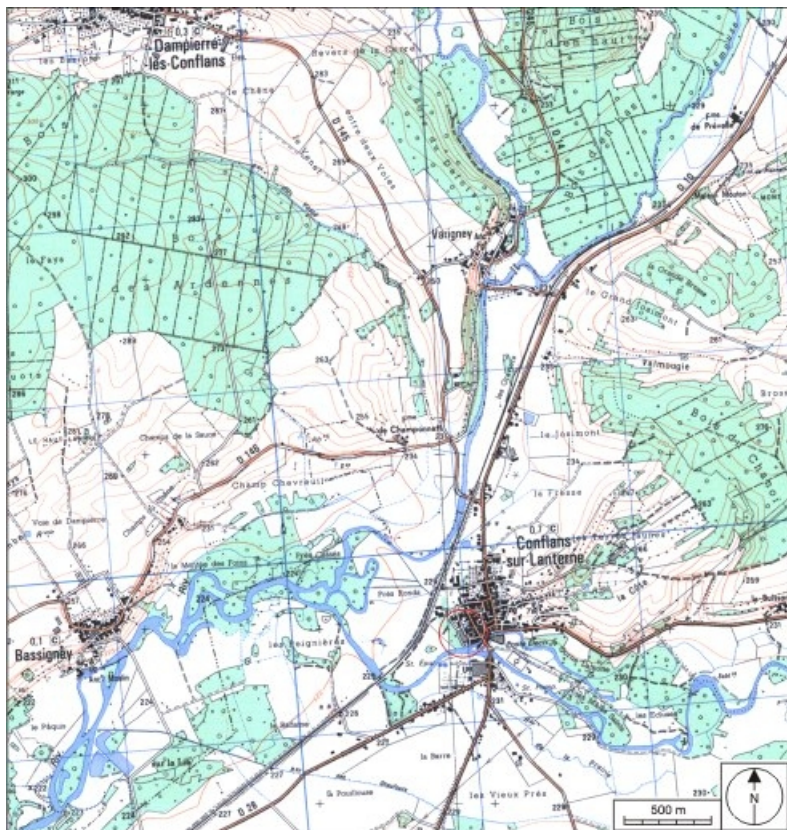
Carte de localisation. Carte topographique au 1:25000, I.G.N., Conflans-sur-Lanterne, 3420 O. SCAN 25 © IGN - 2008, Licence n°2008CISE29-68.

70, Conflans-sur-Lanterne rue du Principal