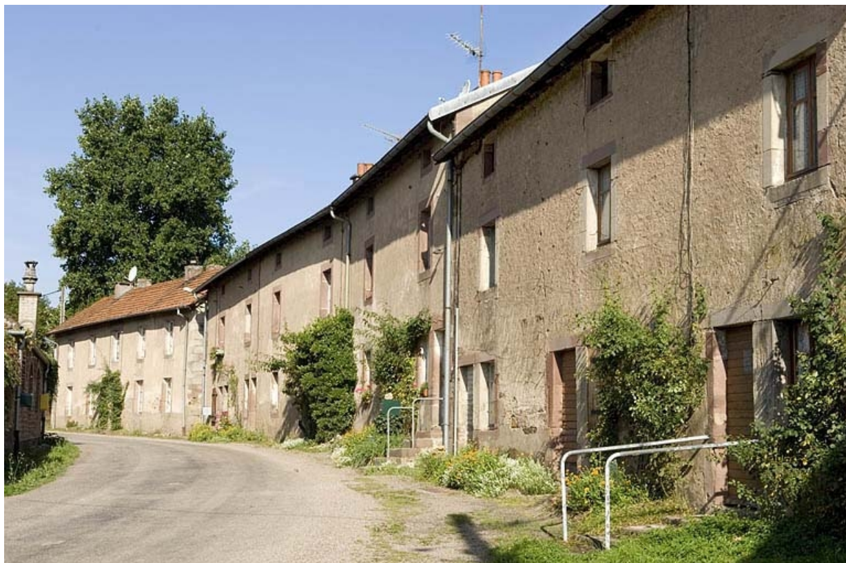
Façades de logements ouvriers (R.D. 304). 70, Hautevelle, lieudit : le Beuchot