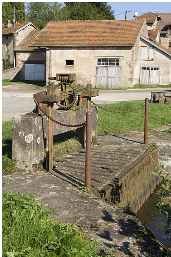
Vanne de prise d'eau de l'étang.