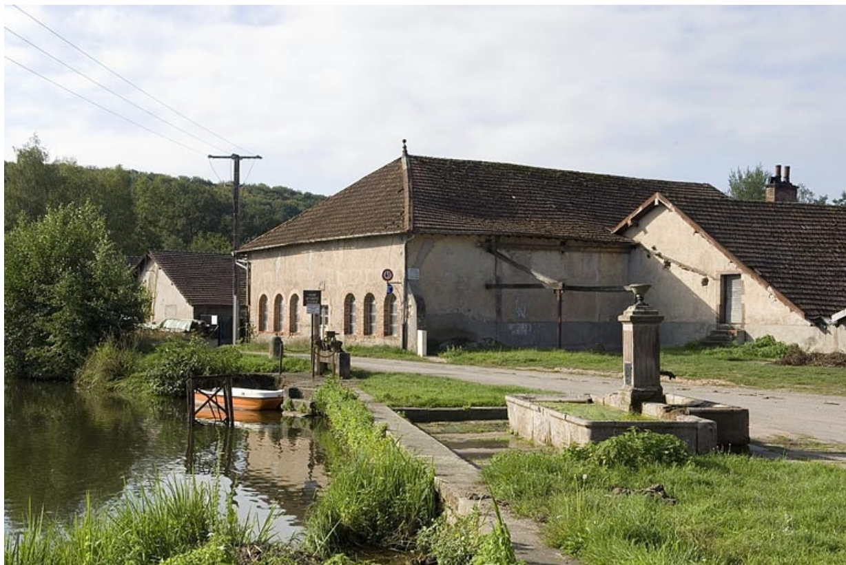
Prise d'eau de l'étang et ateliers est.