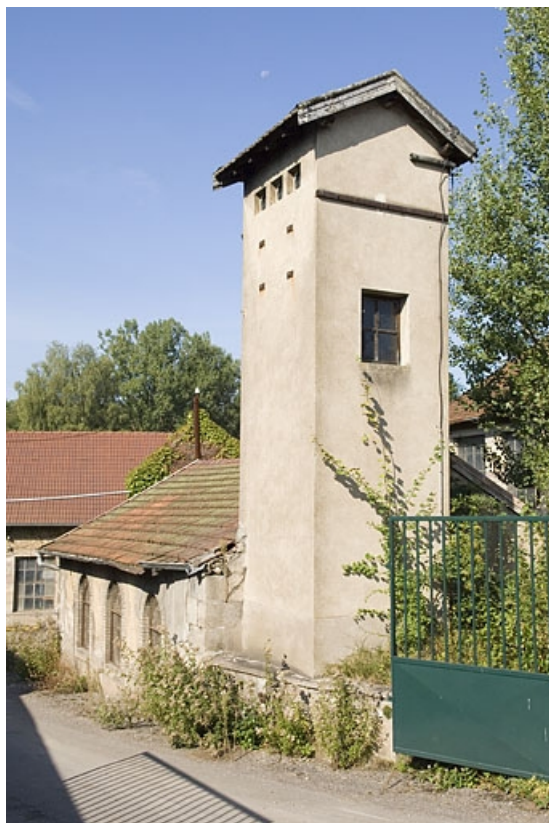
Le transformateur électrique depuis l'entrée.