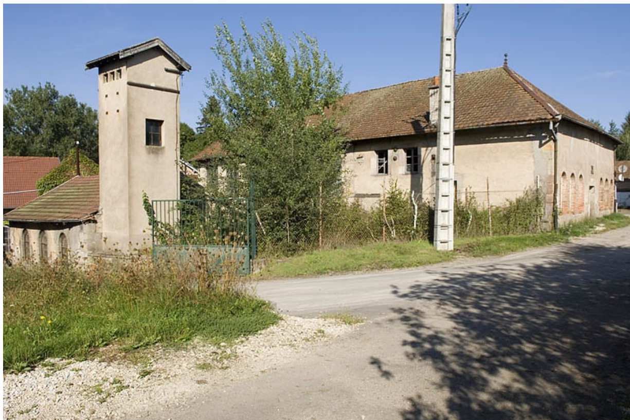
Vue des bâtiments depuis la chaussée de l'étang.