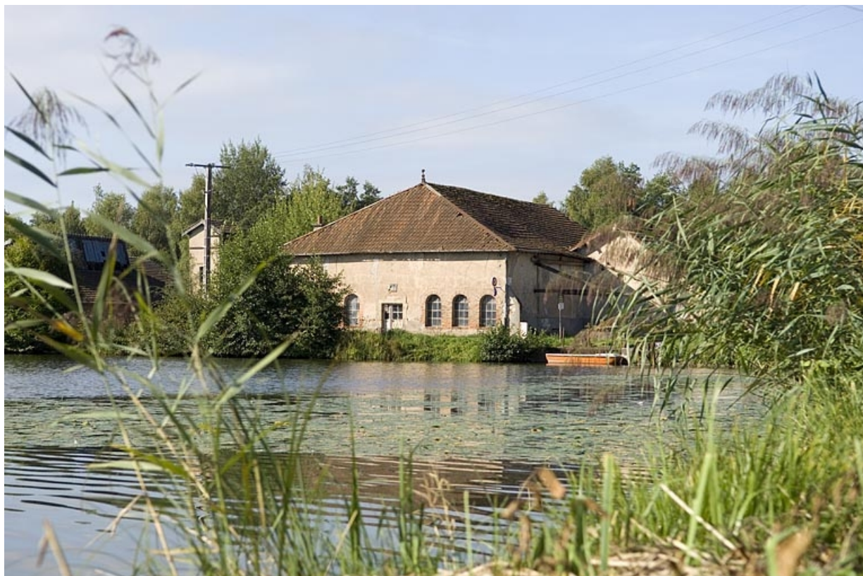
Vue depuis l'étang, à l'est.