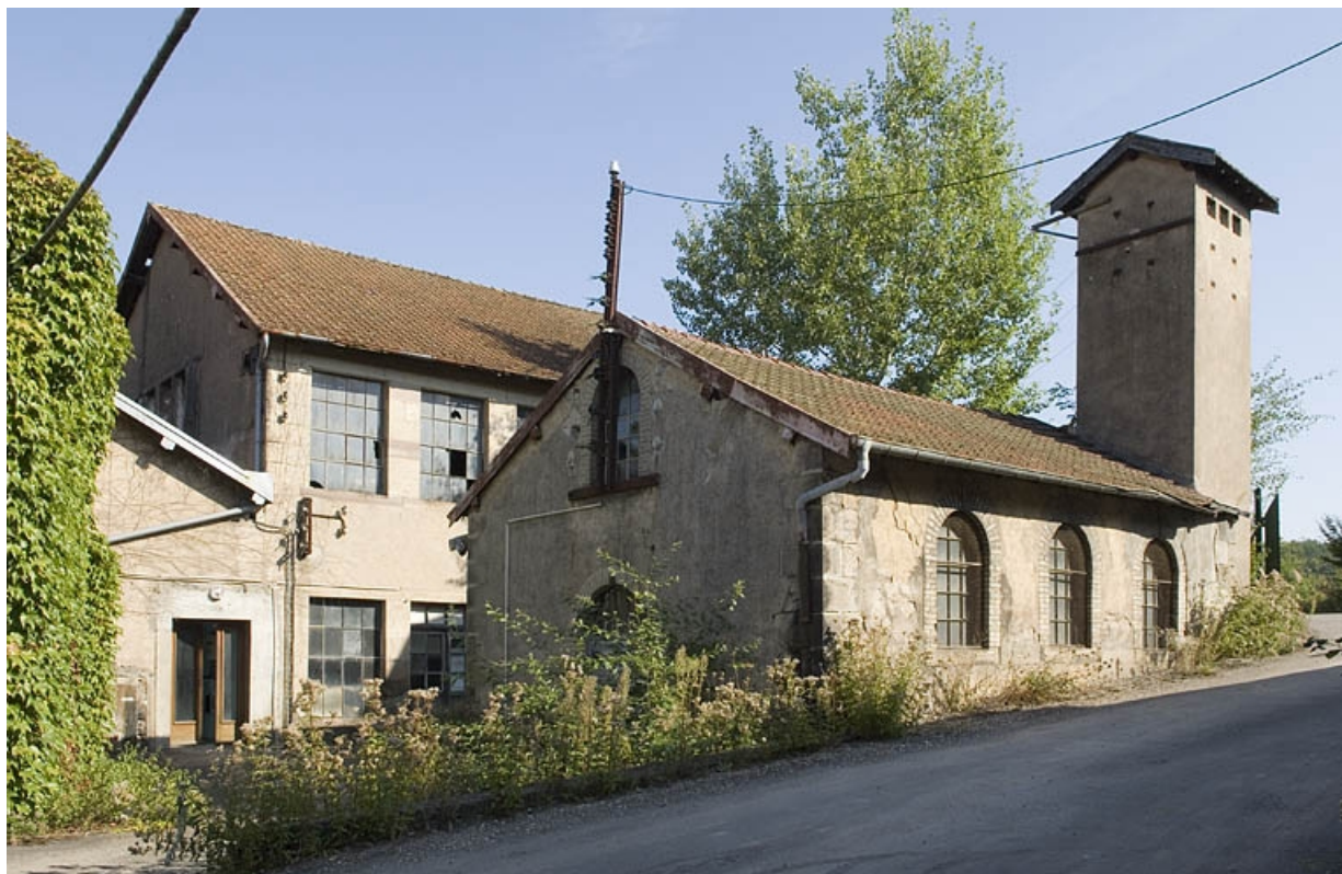
Local technique et transformateur électrique à l'entrée.