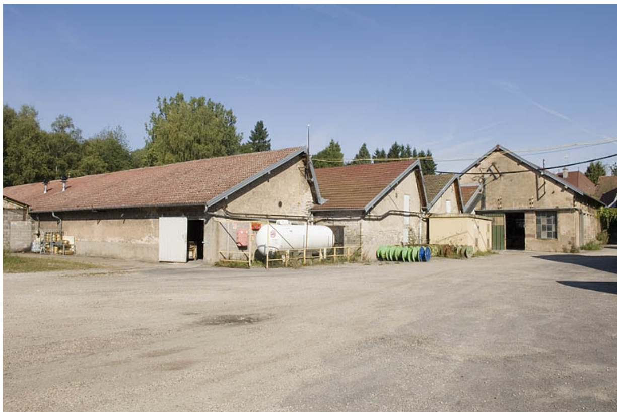
Ateliers de fabrication en rez-de-chaussée depuis le sud.