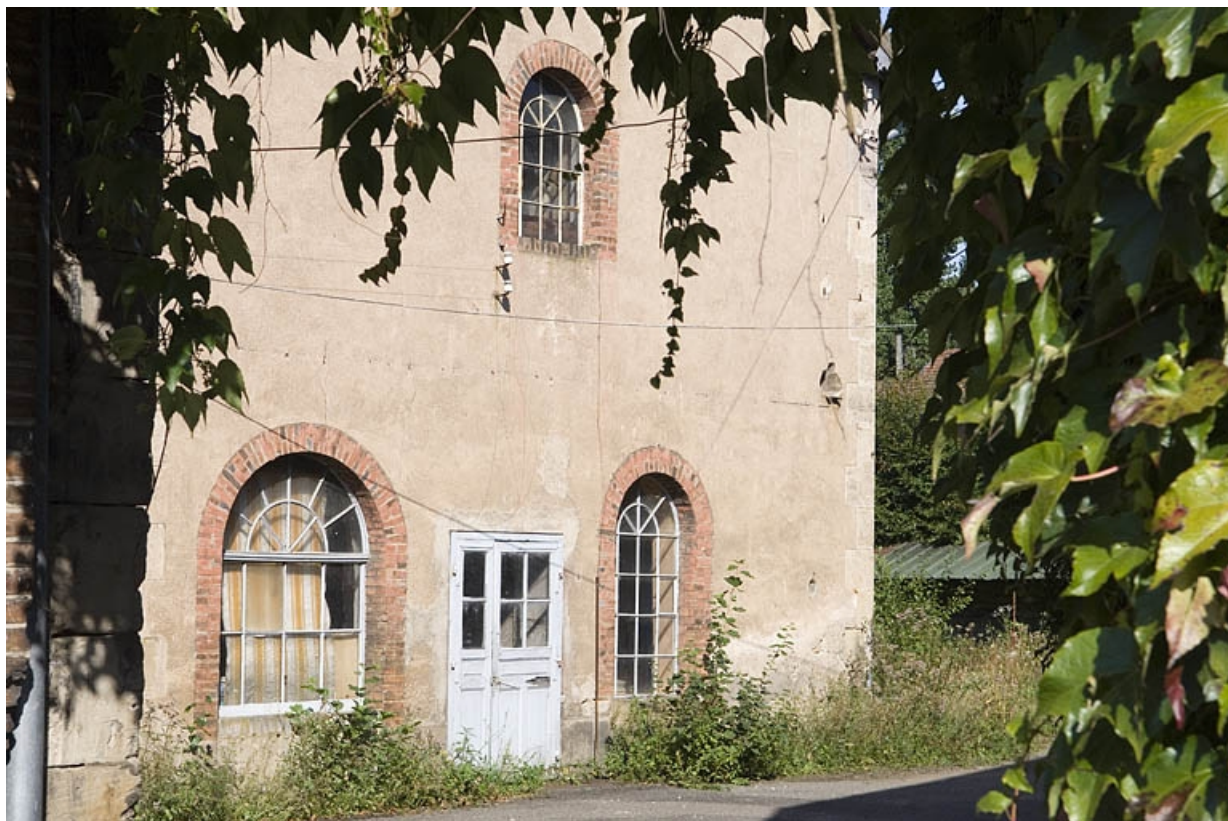
Façade est d'un atelier.