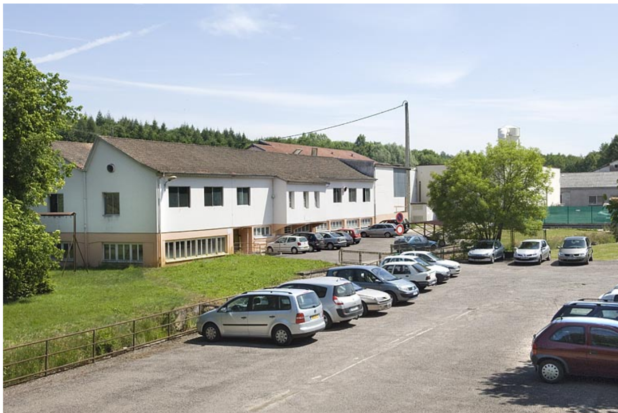
Vue depuis le sud-ouest.

70, Fontaine-lès-Luxeuil rue de la Papeterie, lieudit : le Champfras