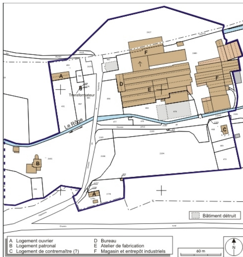
Plan-masse et de situation de l'usine. Extrait du plan cadastral numérisé, 2008, section B, 1:2500 agrandi à 1:2000.

70, Fontaine-lès-Luxeuil rue de la Papeterie, lieudit : le Champfras