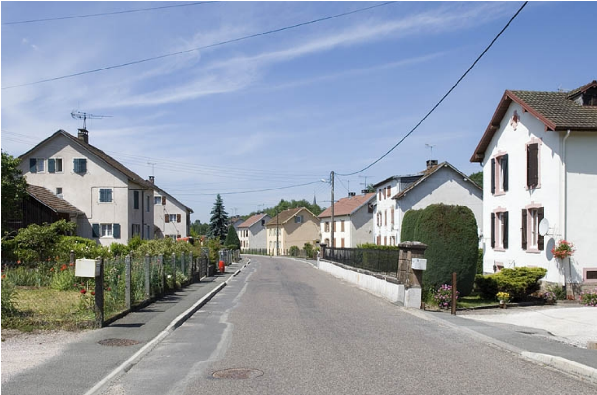
Vue d'ensemble de la cité ouvrière, depuis l'est.

70, Fontaine-lès-Luxeuil rue de la Papeterie, lieudit : le Champfras