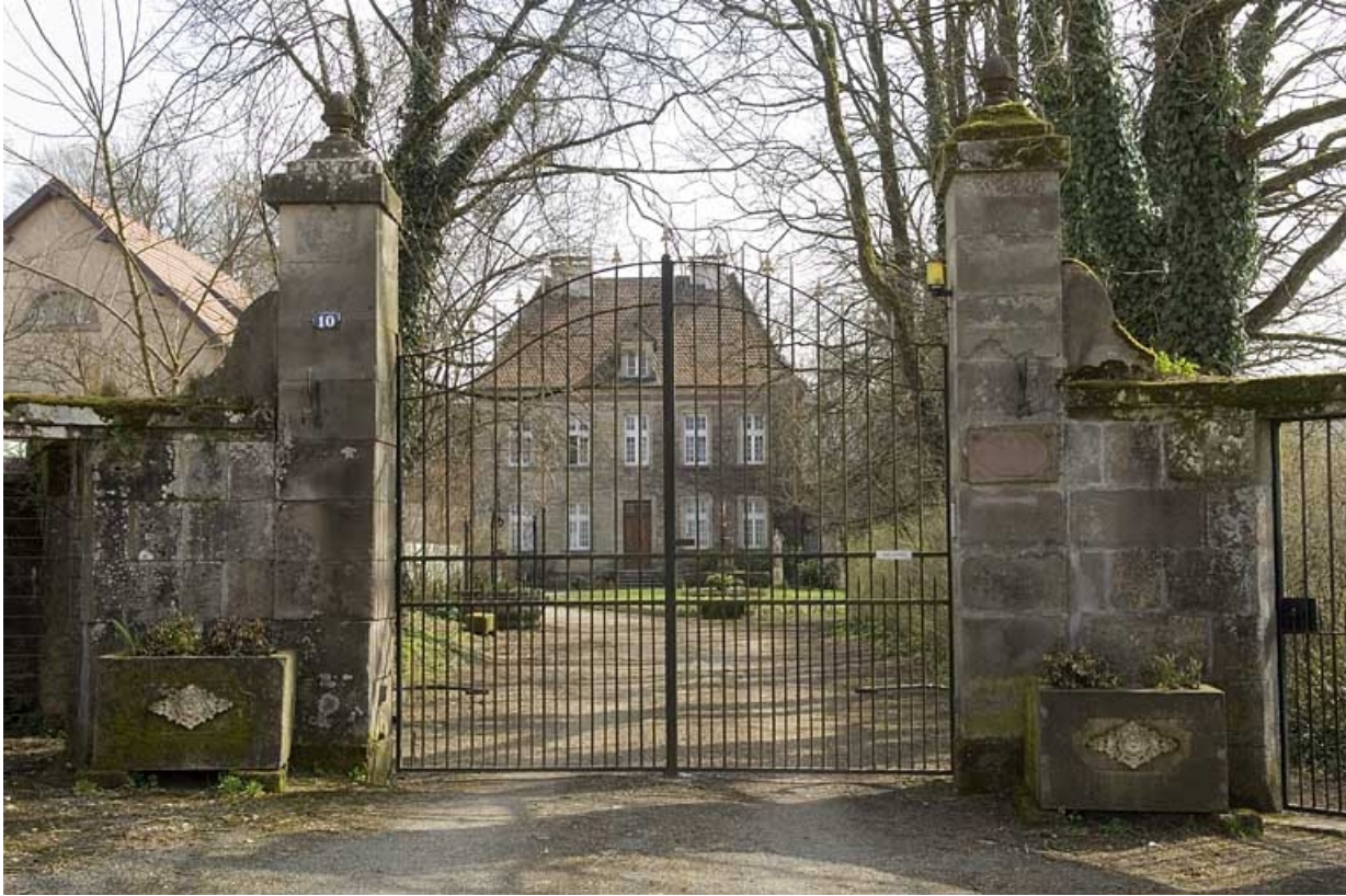
Demeure prieurale (puis logement patronal).

70, Fontaine-lès-Luxeuil, 14 rue Marquiset