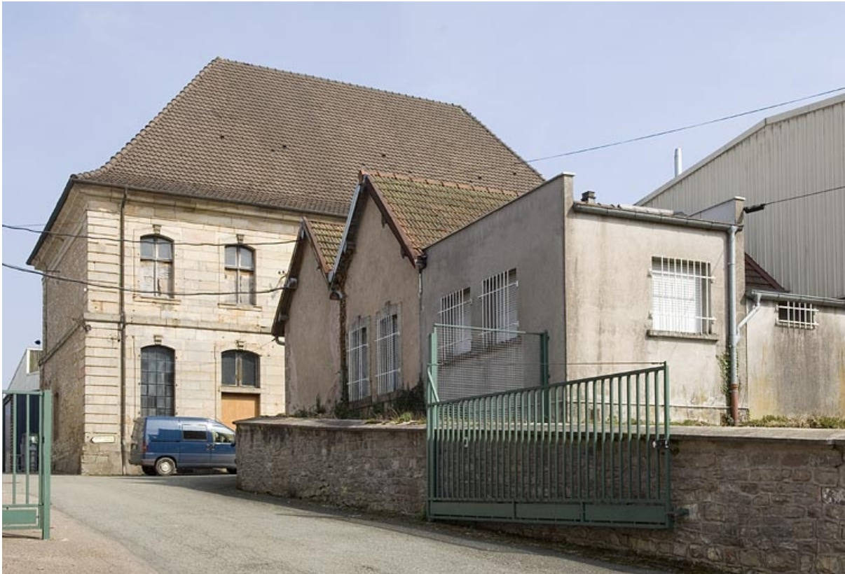
Bâtiment prieural et bureau depuis l'entrée.

70, Fontaine-lès-Luxeuil, 14 rue Marquiset