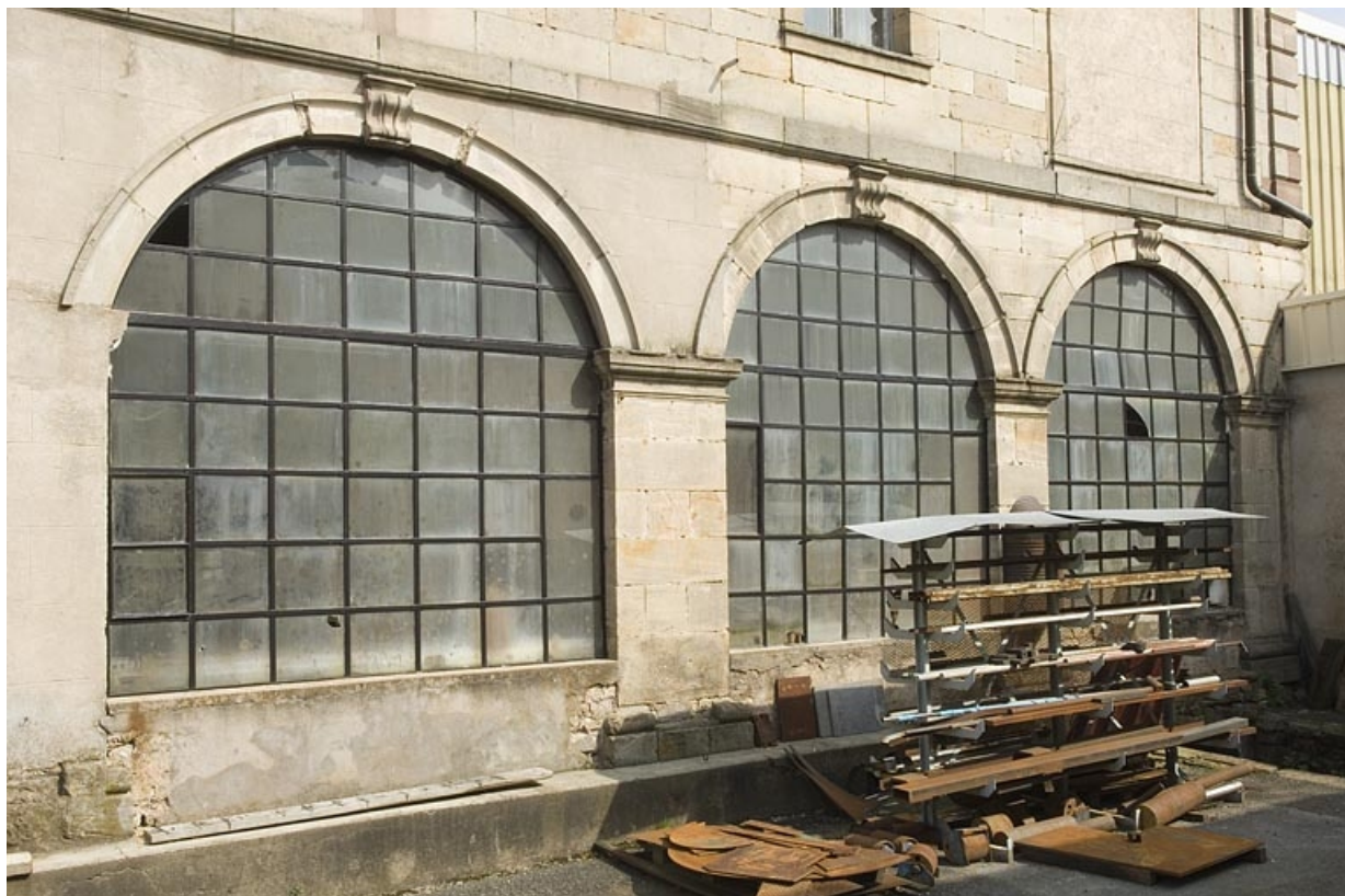
Bâtiment prieural. Baies de la façade ouest. 70, Fontaine-lès-Luxeuil, 14 rue Marquiset