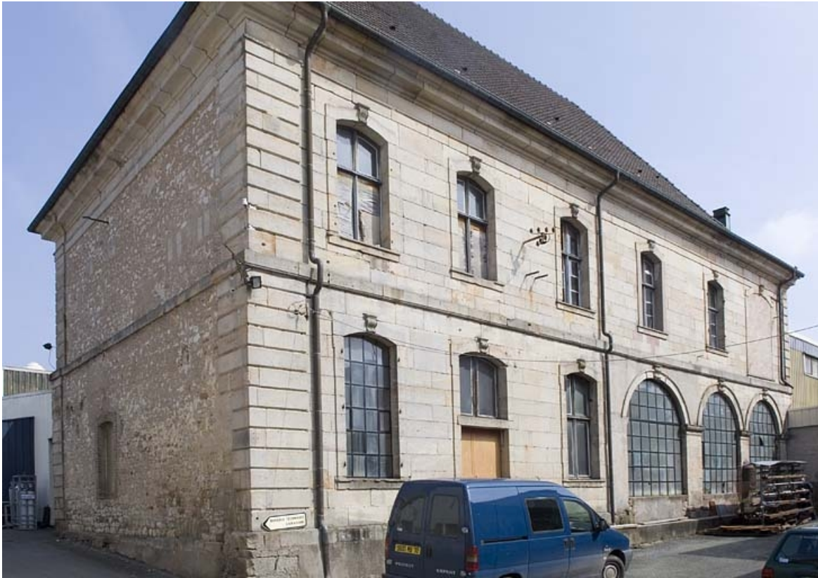
Bâtiment prieural (puis atelier de fonderie de cuivre). Façade ouest.

70, Fontaine-lès-Luxeuil, 14 rue Marquiset