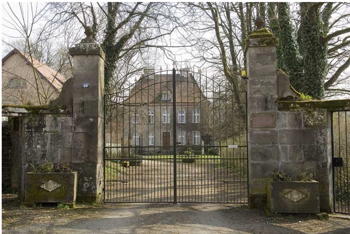
Demeure prieurale (puis logement patronal). 70, Fontaine-lès-Luxeuil, 14 rue Marquiset