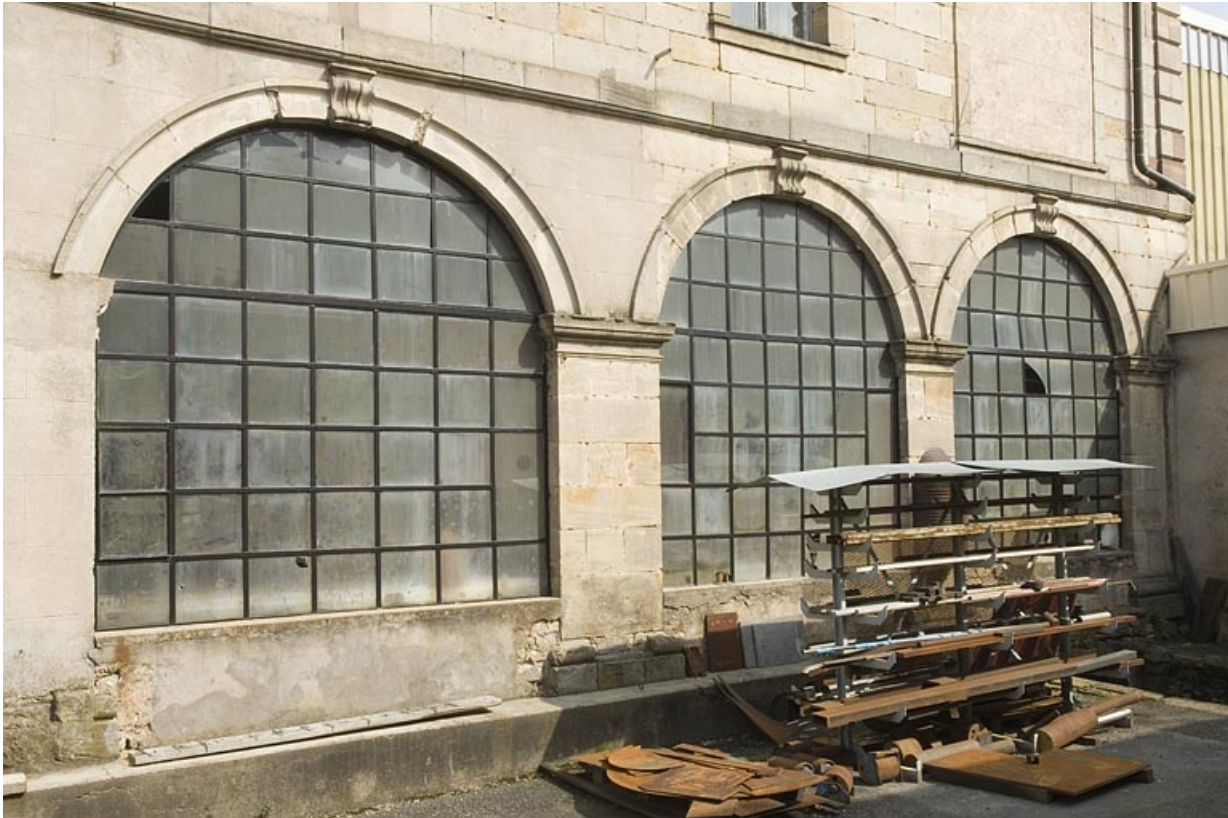
Bâtiment prieural. Baies de la façade ouest.

70, Fontaine-lès-Luxeuil, 14 rue Marquiset