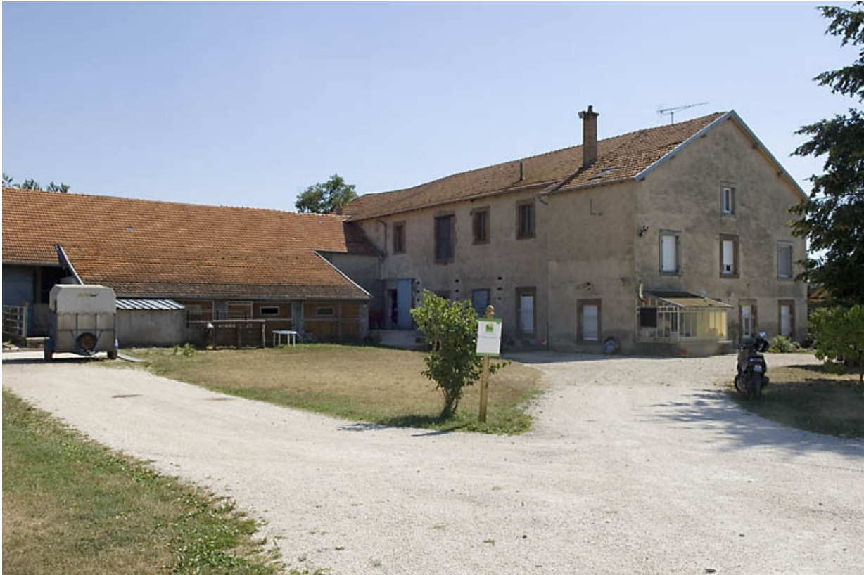
Vue de trois quarts arrière.

70, Francalmont R.D. 28, lieudit : le Sélerey