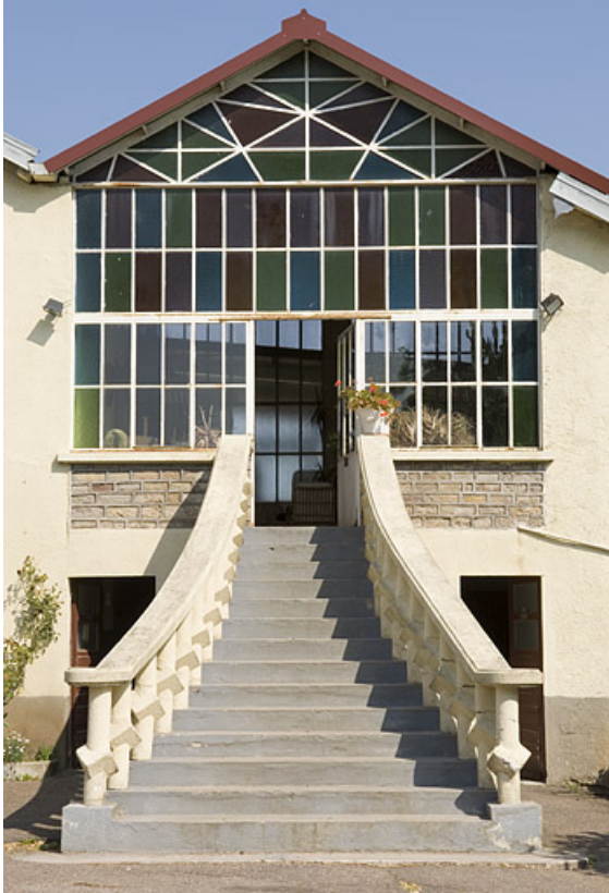
Entrée des bureaux.