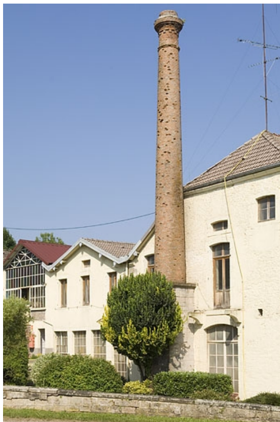
Façade est des ateliers et cheminée.