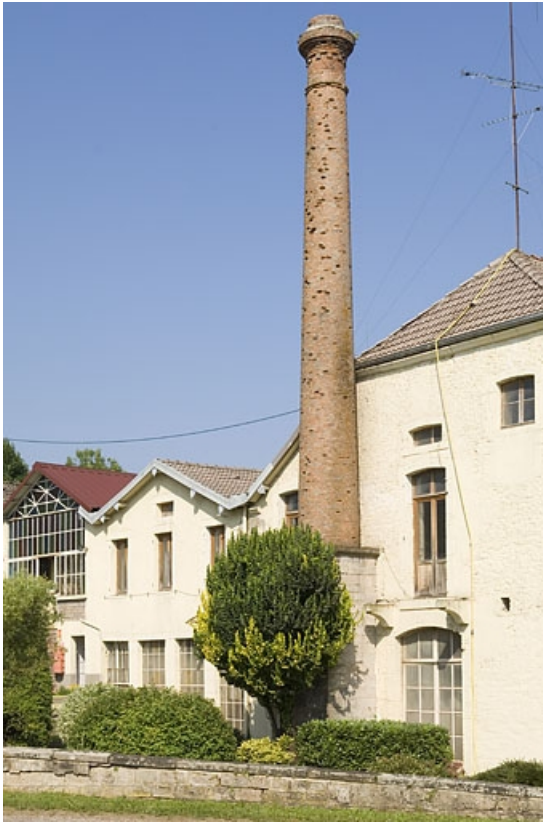
Façade est des ateliers et cheminée.