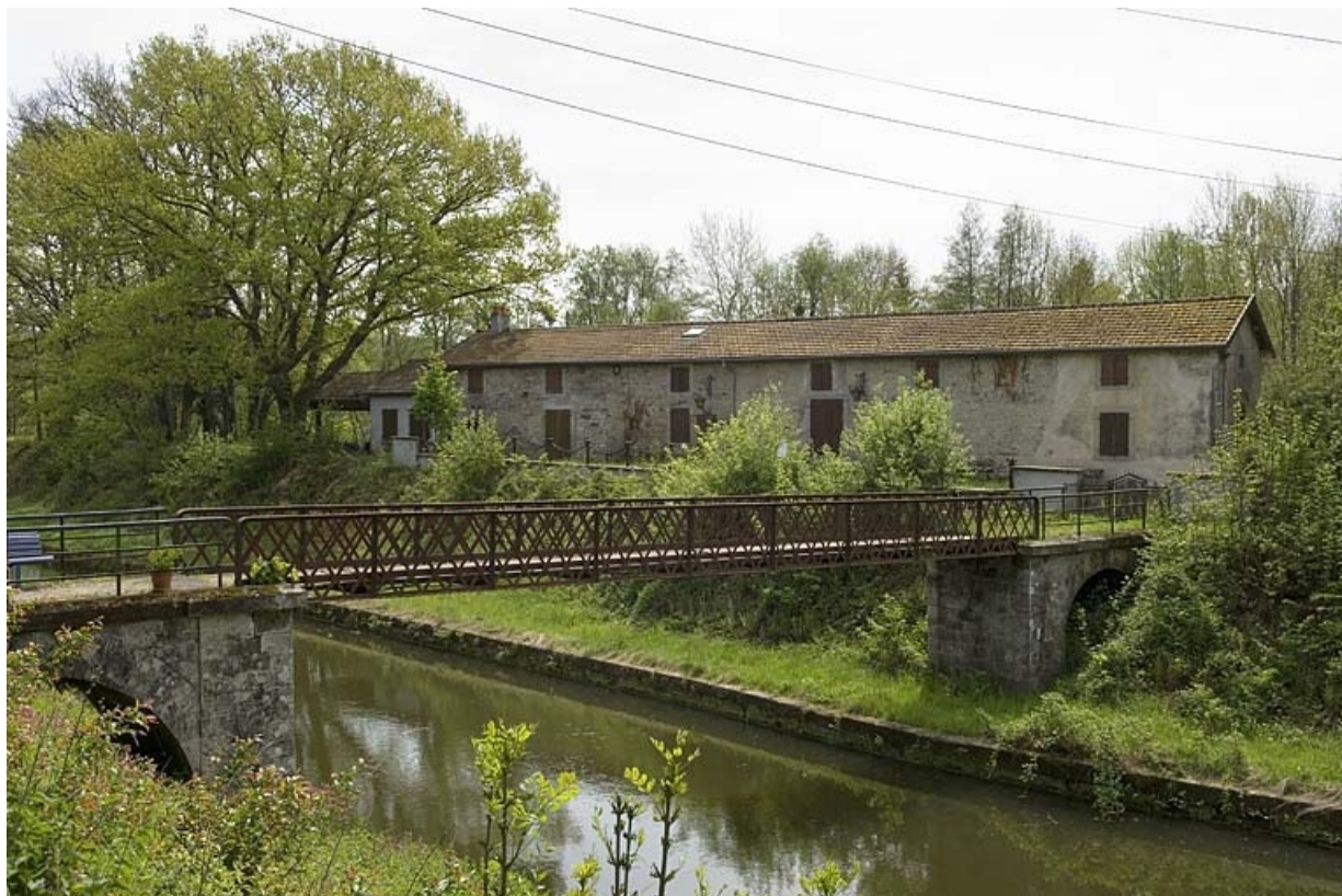
Vue d'ensemble du logement ouvrier collectif (est).