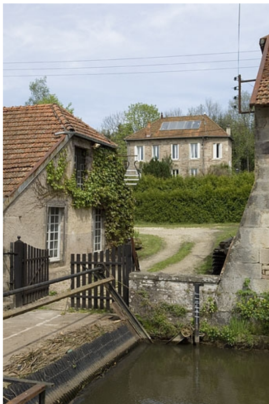
Logement patronal vu depuis le sud.