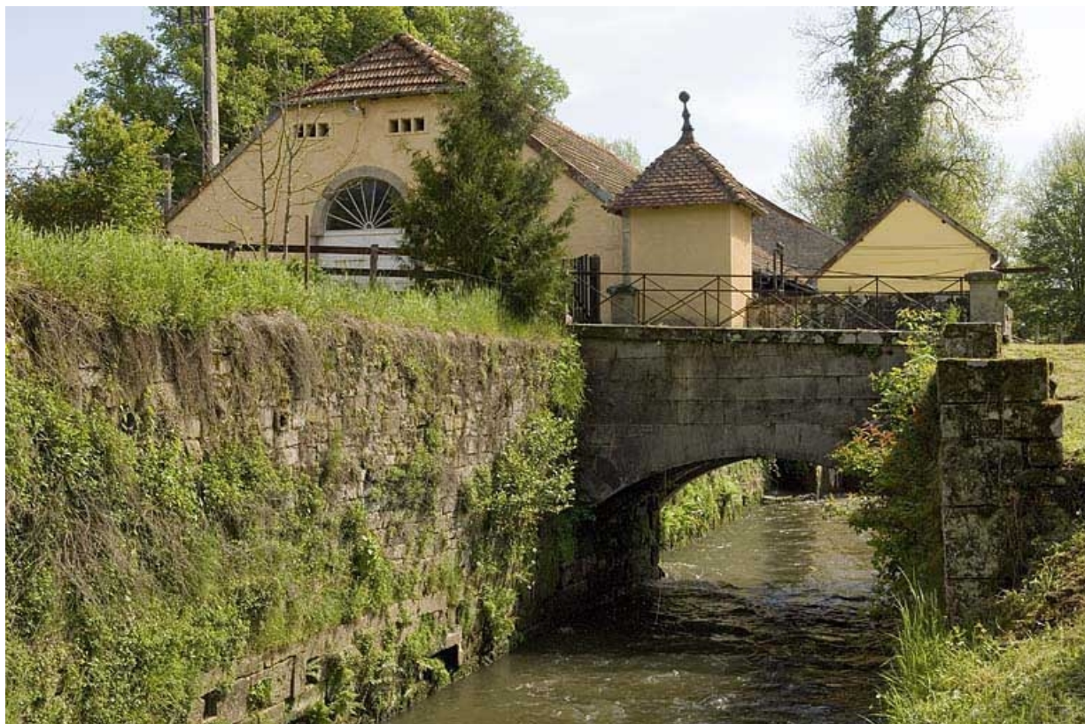
Canal de fuite de la salle des machines (nord).