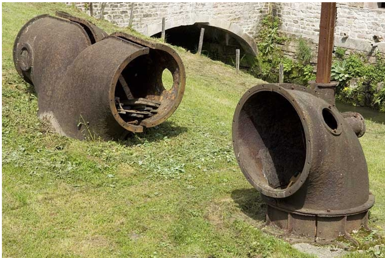
Extrémités de conduites forcées (déposées). 70, Pont-du-Bois, lieudit : la Forge