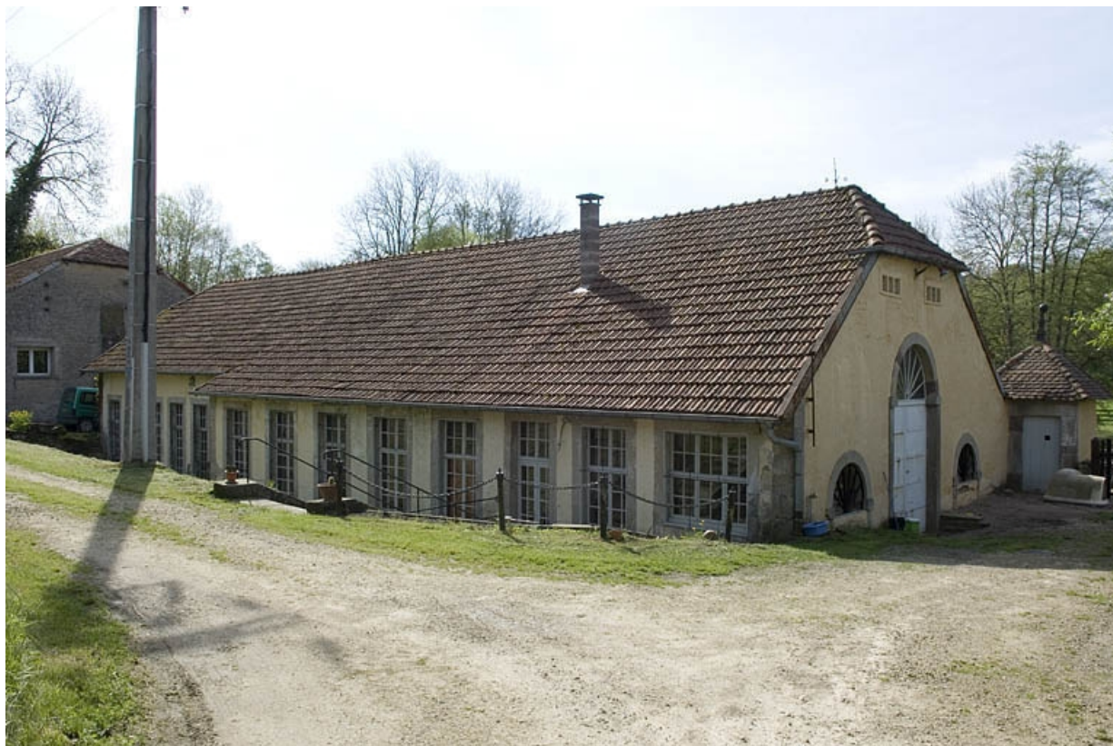
Atelier de fabrication (rive droite) vu de trois quarts.