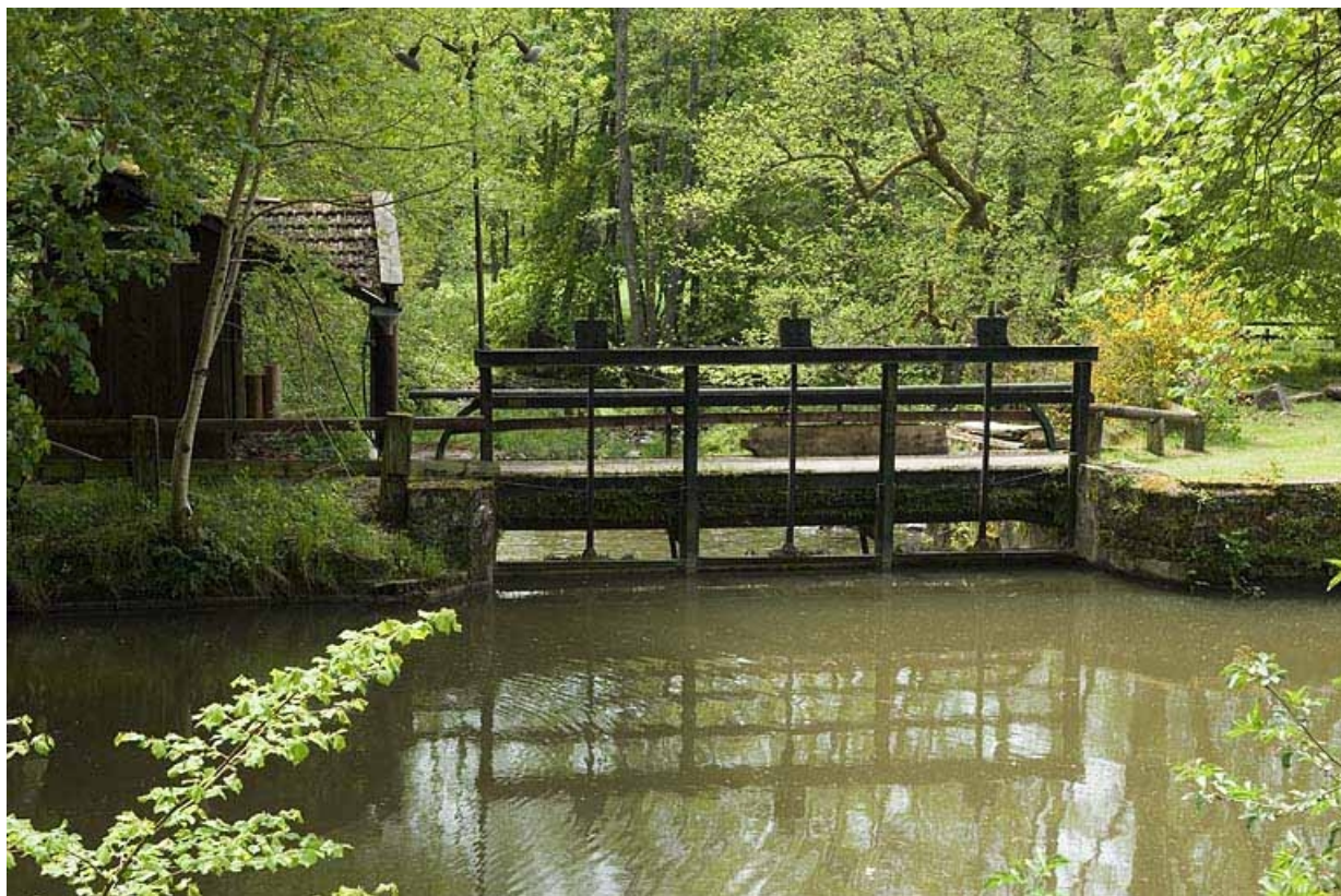
Vannes de décharge sur le bief d'aménée.