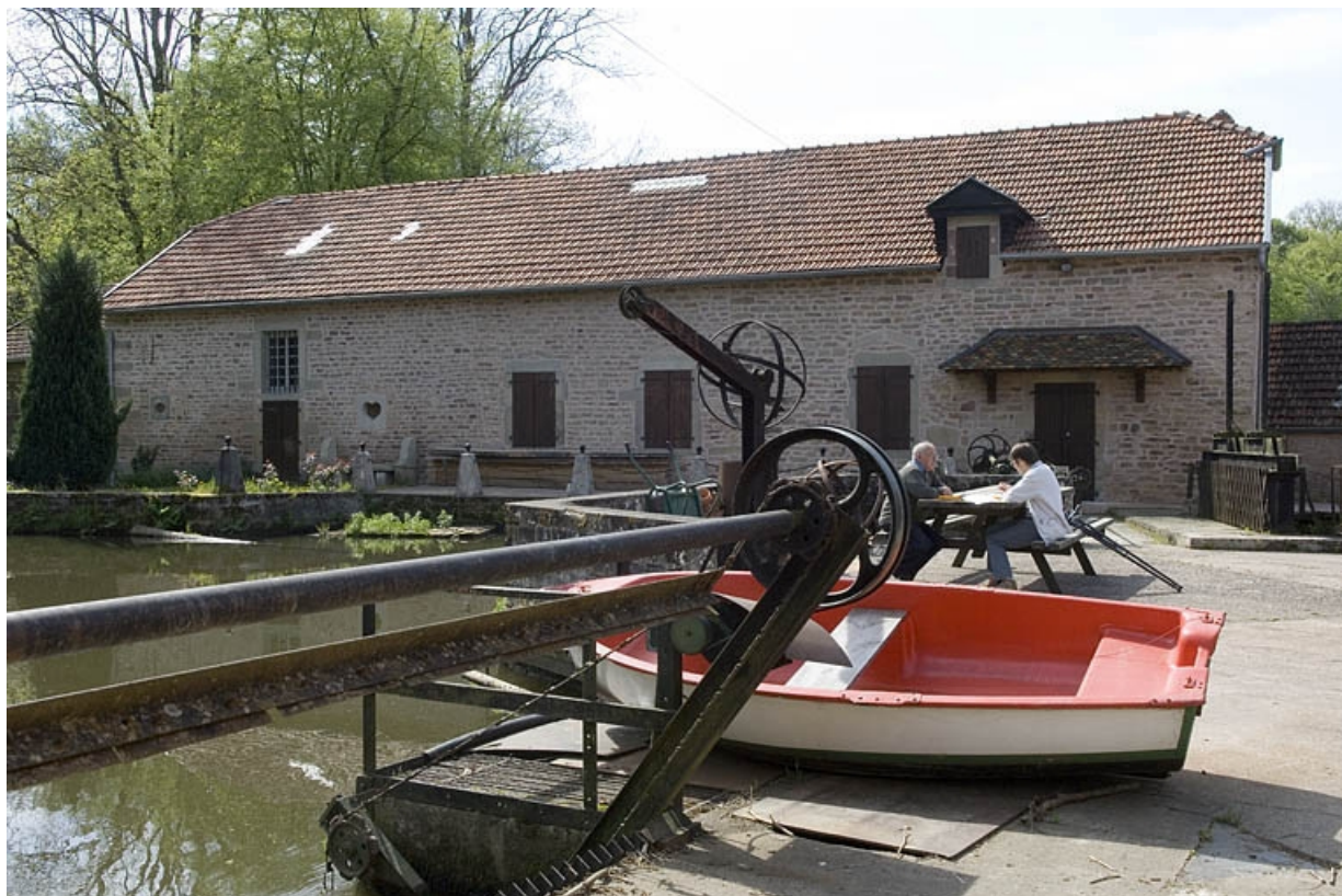
Logement (rive gauche). Façade nord.