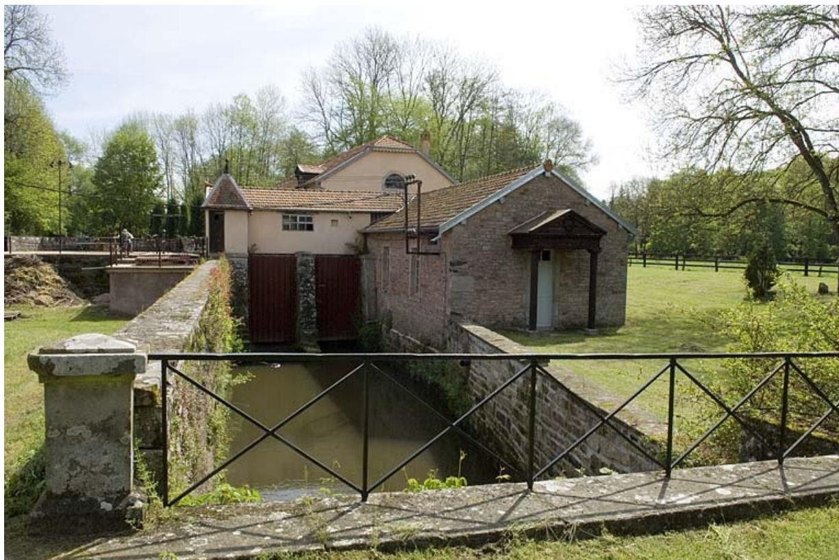
Canal de fuite de la salle des machines (sud). 70, Pont-du-Bois, lieudit : la Forge