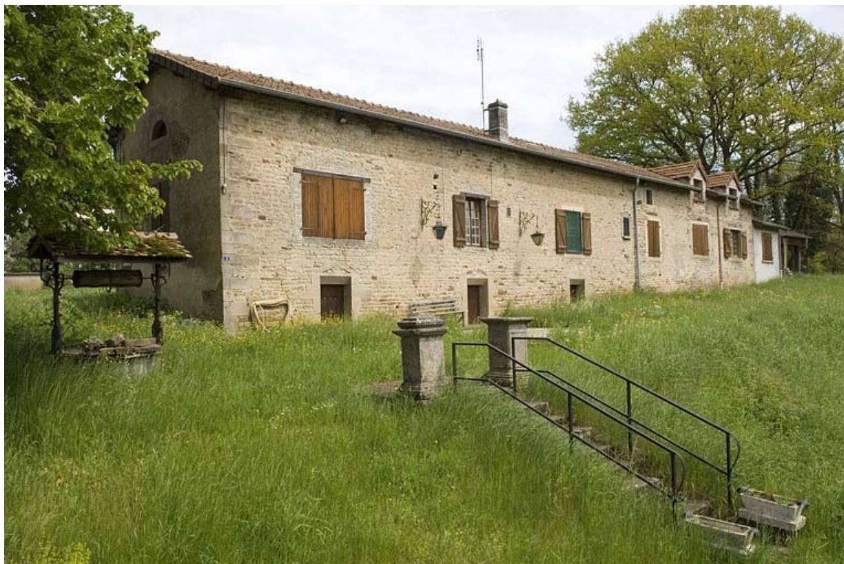
Vue de trois quarts du logement ouvrier collectif (est).