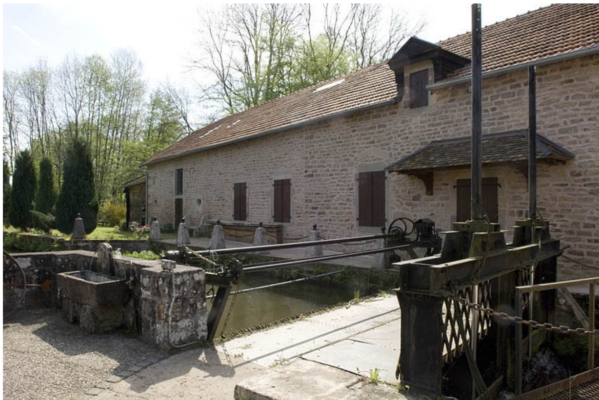
Logement (rive gauche) depuis l'est.