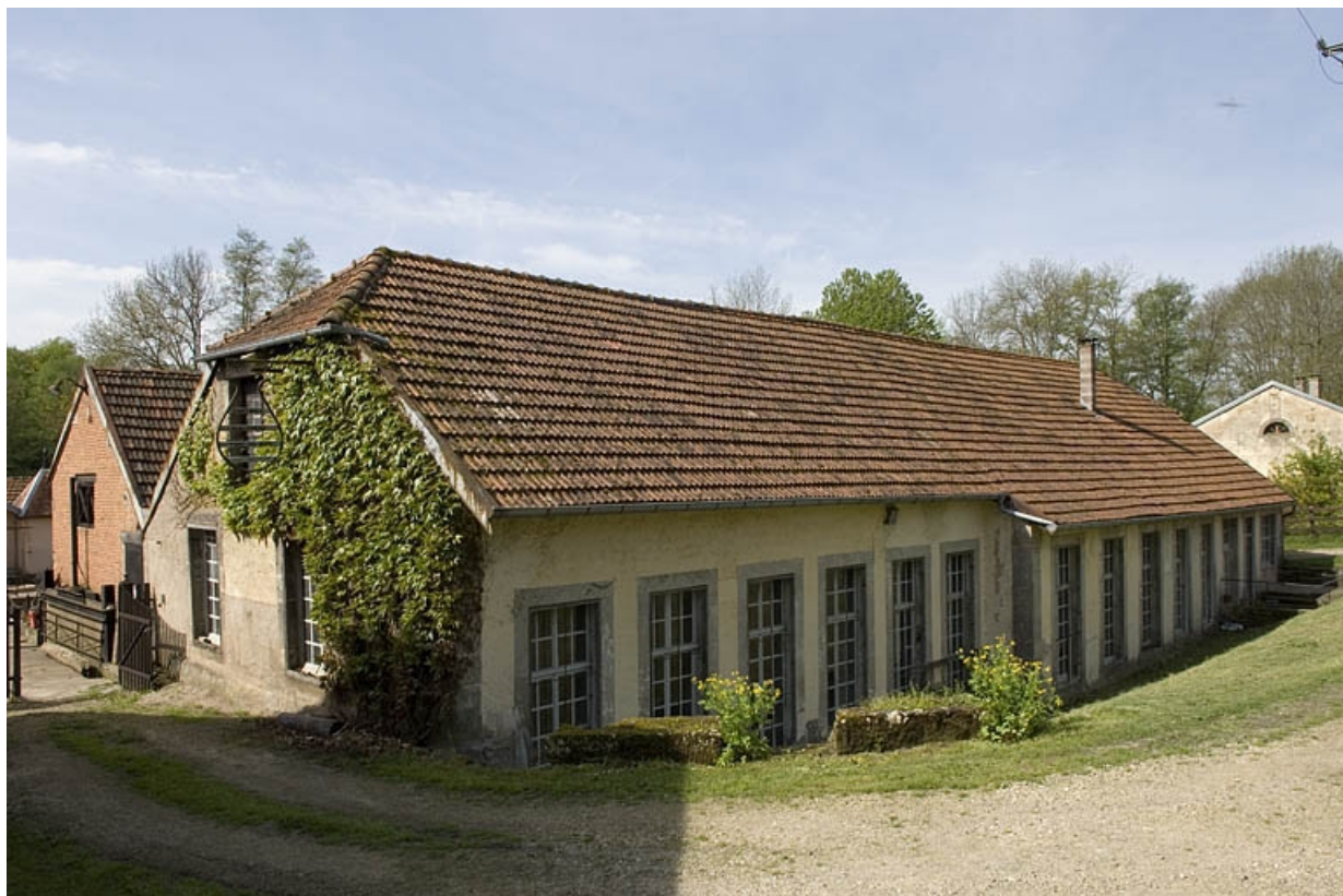
Atelier de fabrication (rive droite) depuis le nord-est.