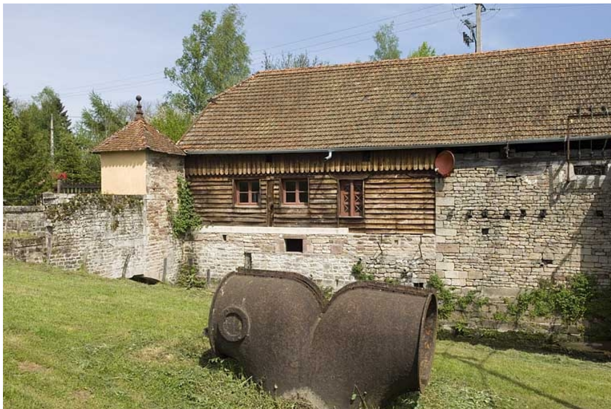
Façade sud de l'atelier de fabrication.