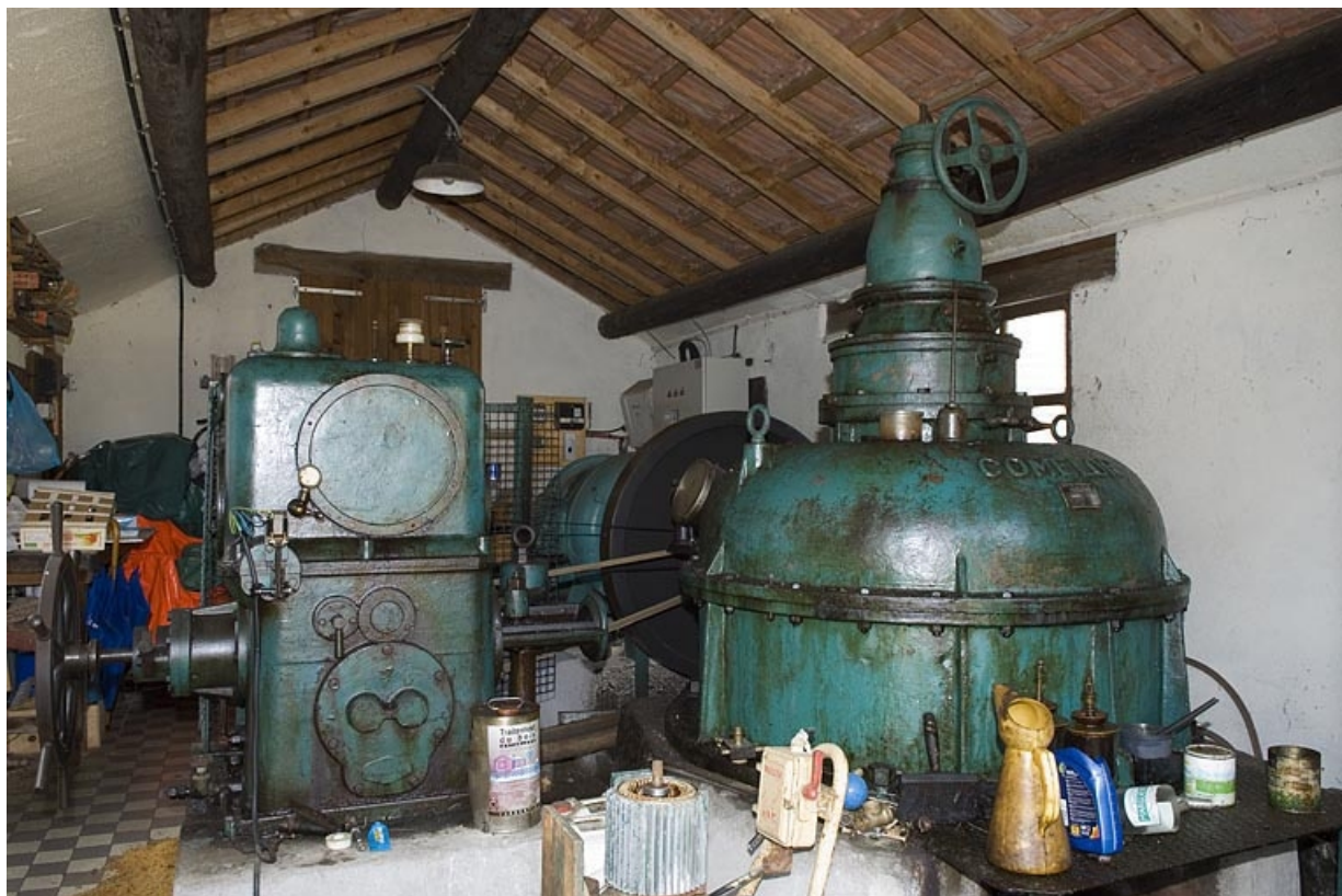
Intérieur de la salle des machines (sud). Turbine Dumont et multiplicateur Comelor. 70, Pont-du-Bois, lieudit : la Forge