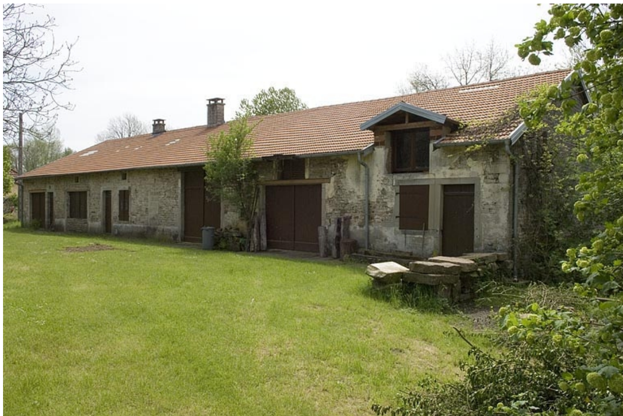
Logement ouvrier collectif (ouest). Vue de trois quarts. 70, Pont-du-Bois, lieudit : la Forge