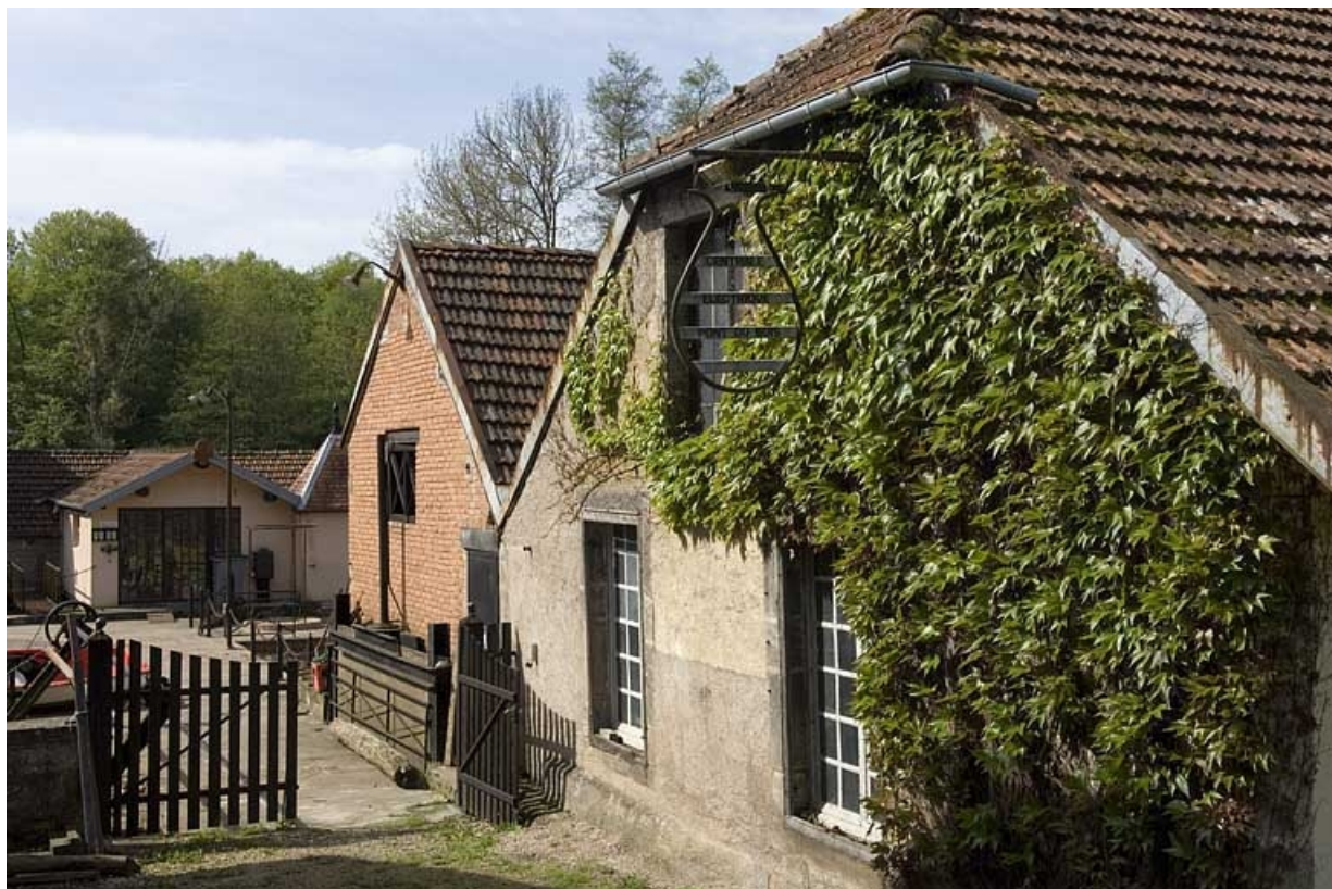
Pignons de l'atelier de fabrication et d'une salle des machines de la centrale hydroélectrique. 70, Pont-du-Bois, lieudit : la Forge