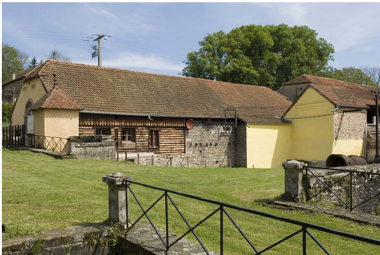
Vue de trois quarts de l'atelier de fabrication.