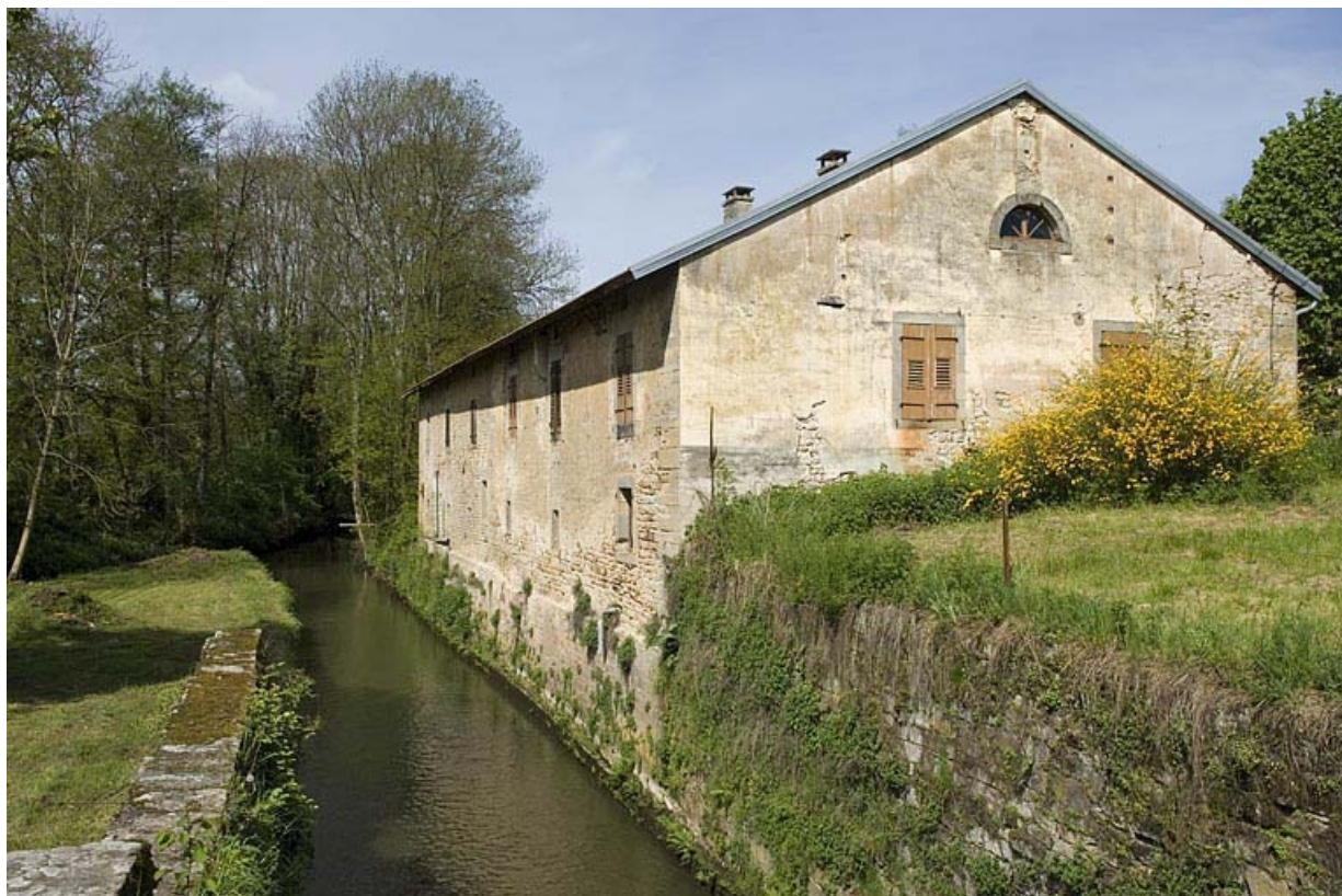
Façade sur le canal d'un logement d'ouvriers.