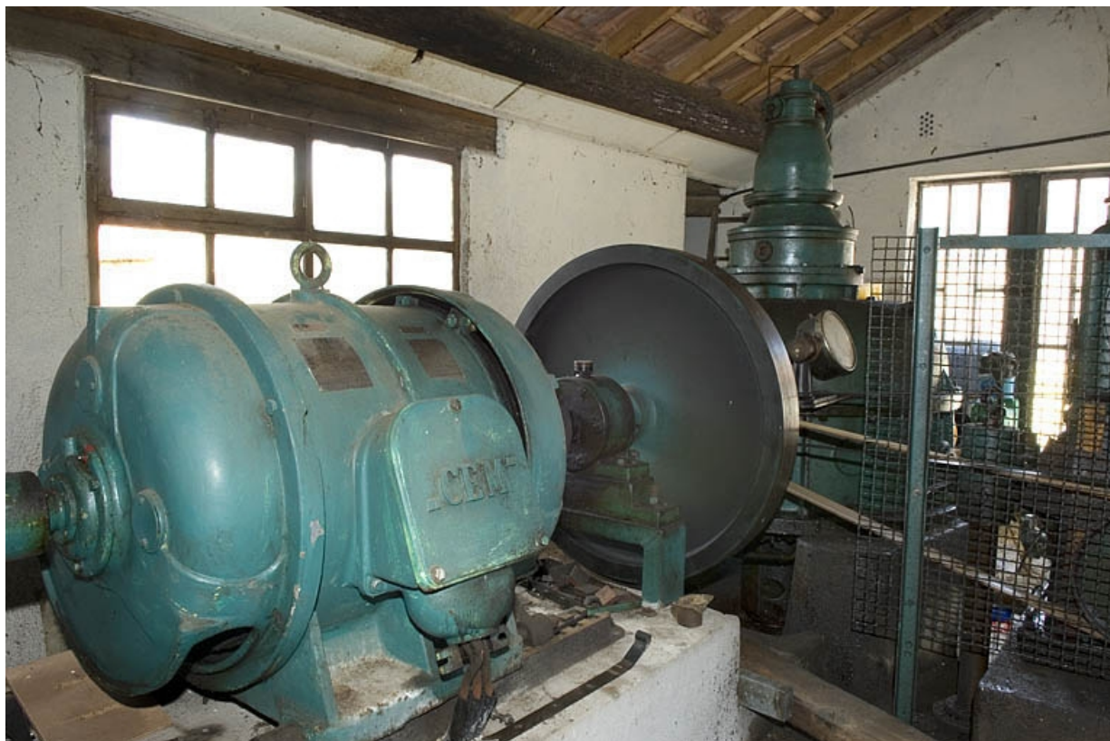
Intérieur de la salle des machines (sud). Alternateur CEM. 70, Pont-du-Bois, lieudit : la Forge