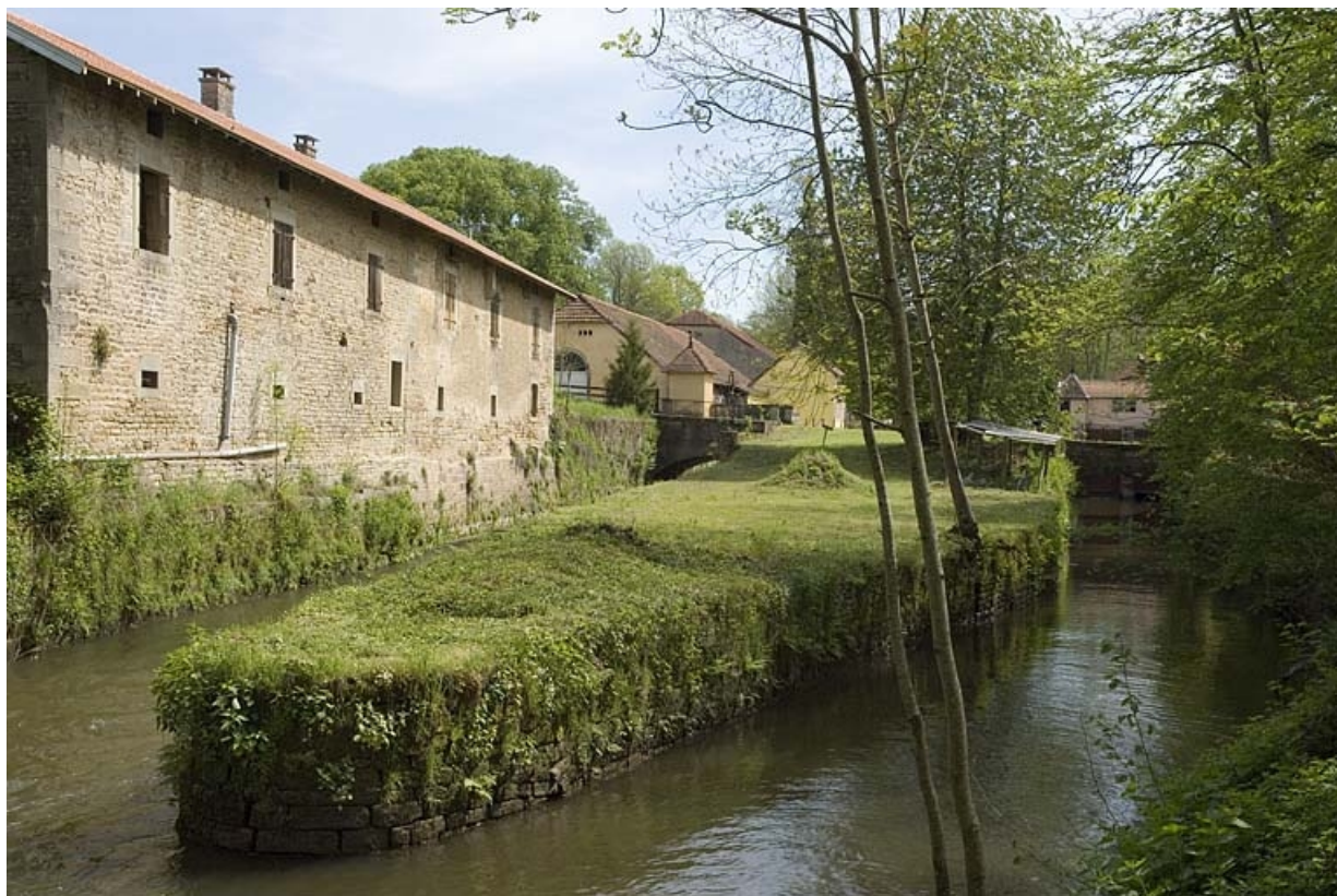
Vue d'ensemble depuis l'ouest. 70, Pont-du-Bois, lieudit : la Forge