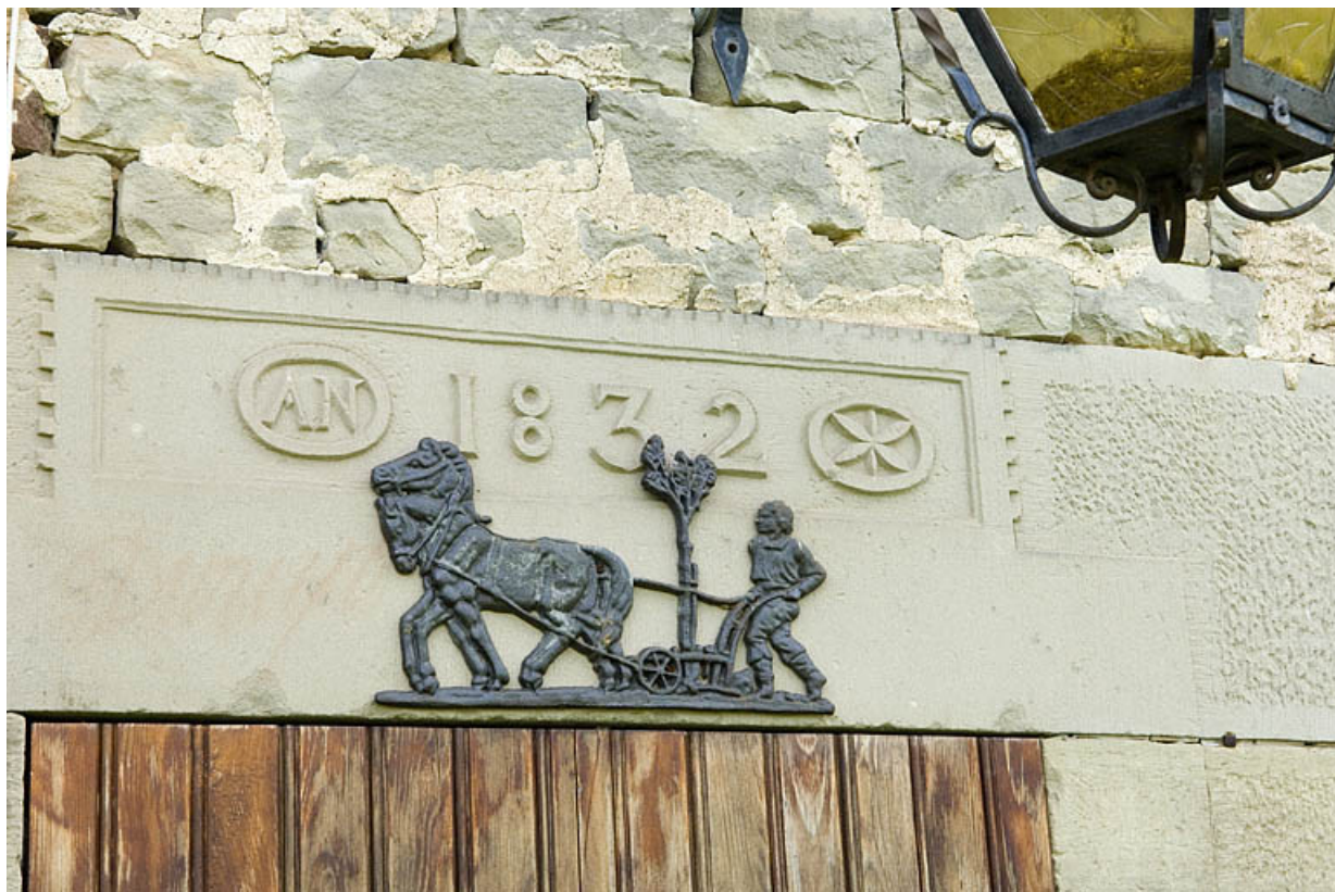
Logement ouvrier collectif (est). Détail d'un linteau.