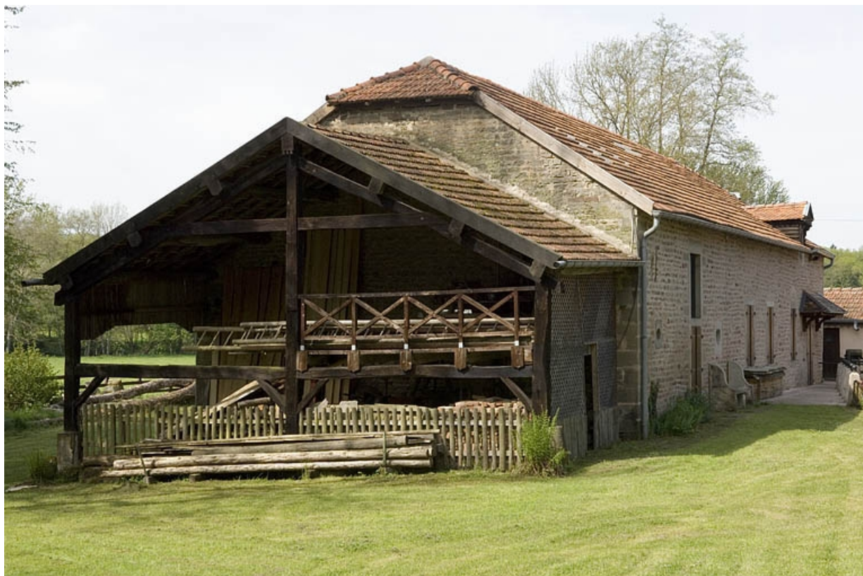
Logement (rive gauche) et vannes de la centrale.