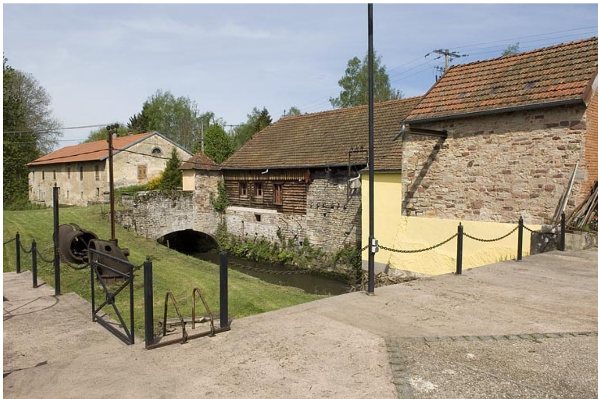
Vue sur le canal de fuite et les bâtiments rive droite.