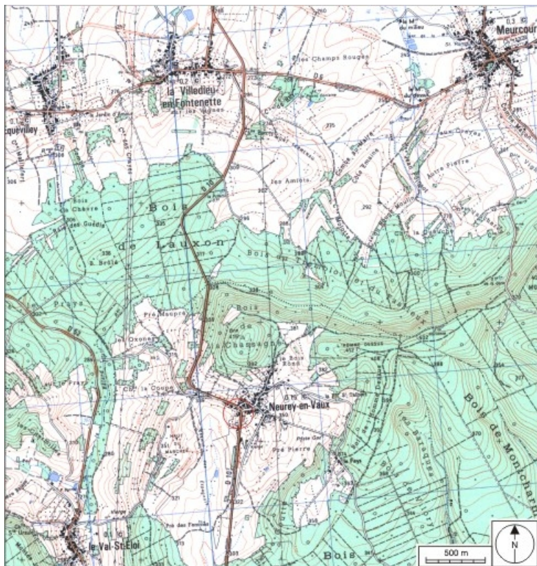
Carte de localisation. Carte topographique au 1:25000, I.G.N., Conflans-sur-Lanterne, 3420 O. SCAN 25 © IGN - 2008, Licence n°2008CISE29-68.