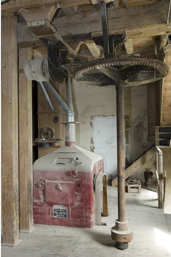
Convertisseur Ph. Lafon et arbre de transmission (1er étage).

70, Villers-lès-Luxeuil, lieudit : moulin du Teux