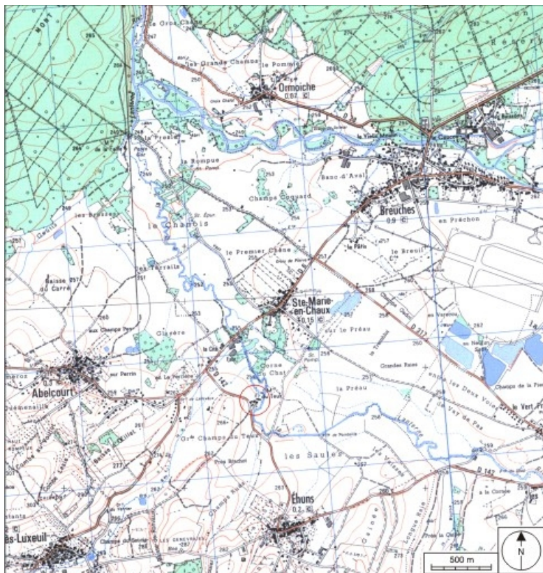
Carte de localisation. Carte topographique au 1:25000, I.G.N., Luxeuil-les-Bains, 3420 E. SCAN 25 © IGN - 2008, Licence n°2008CISE29-68.

70, Villers-lès-Luxeuil, lieu-dit : moulin du Teux