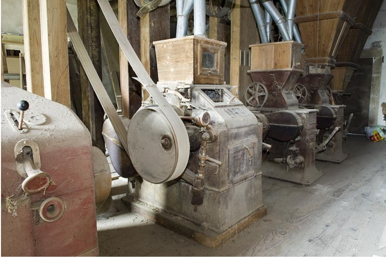
Vue d'ensemble des appareils à cylindres (1er étage).

70, Villers-lès-Luxeuil, lieudit : moulin du Teux