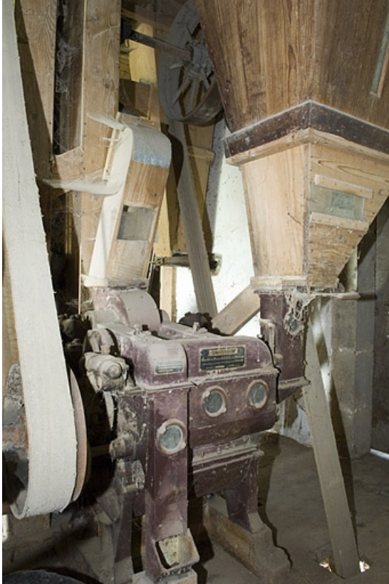
Brosse à blé Lhuillier (1er étage).

70, Villers-lès-Luxeuil, lieudit : moulin du Teux