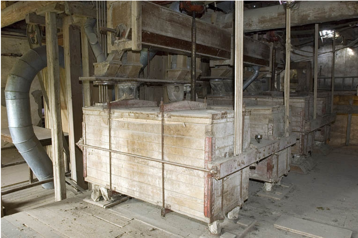
Vue d'ensemble des plansichters (3e étage).

70, Villers-lès-Luxeuil, lieudit : moulin du Teux