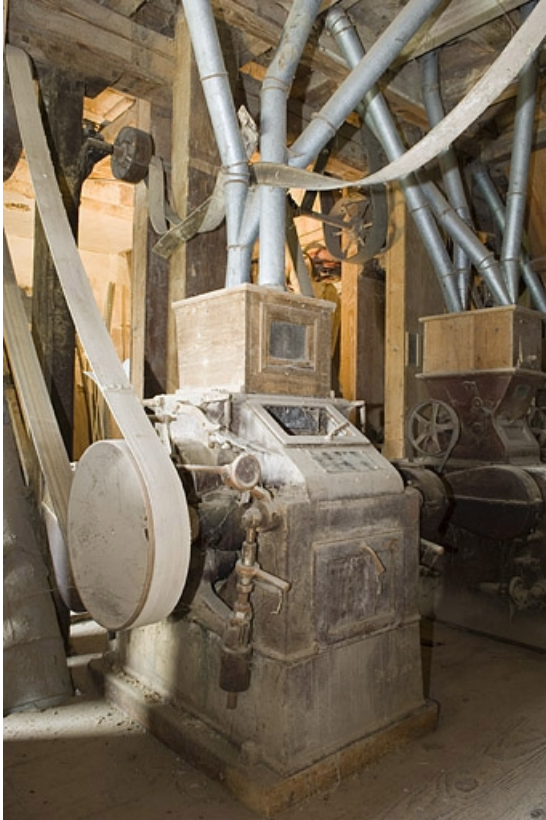
Convertisseur Teisset-Rose-Brault (1er étage).

70, Villers-lès-Luxeuil, lieudit : moulin du Teux