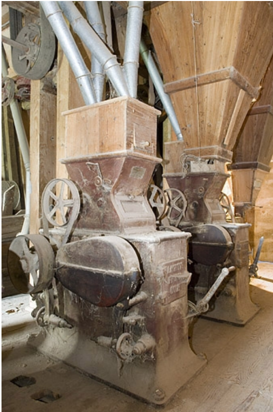
Broyeurs doubles Lacroix (1er étage).

70, Villers-lès-Luxeuil, lieudit : moulin du Teux