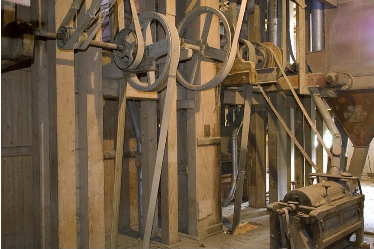
Système d'élévation, poulies, courroies et brosse à son (2e étage).

70, Villers-lès-Luxeuil, lieudit : moulin du Teux