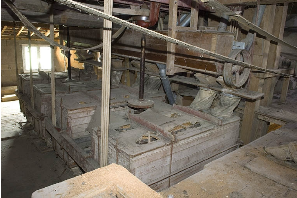
Vue plongeante sur les plansichters (3e étage).

70, Villers-lès-Luxeuil, lieudit : moulin du Teux