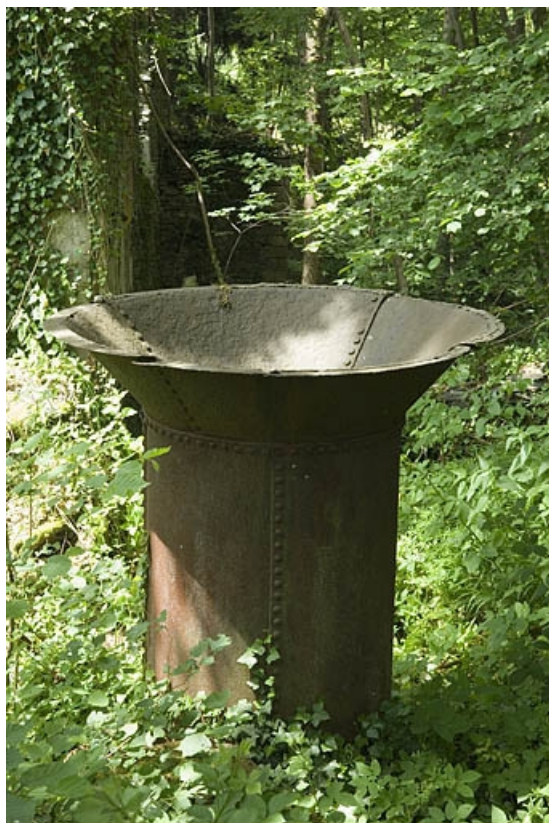
Couronnement métallique d'une cheminée en tôle.