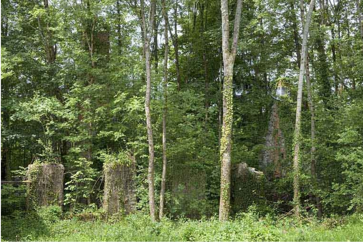
Vestiges de l'atelier de papeterie envahis par la végétation.