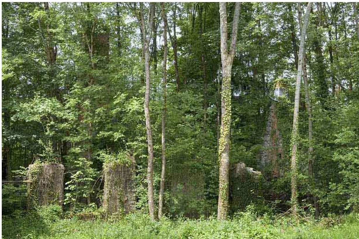
Vestiges de l'atelier de papeterie envahis par la végétation.