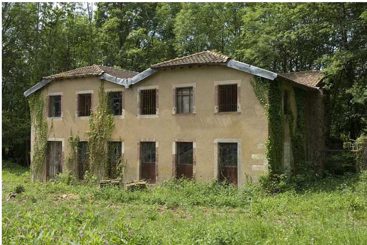
Bâtiment à usage indéterminé (logement, bureau ?).