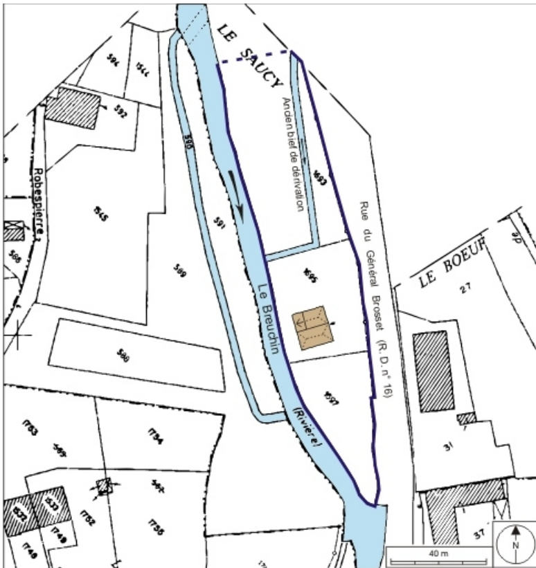
Plan-masse et de situation. Montage d'extraits de plans cadastraux numérisés, 2008, section H et WO, échelle 1:1250. 70, Plancher-Bas rue du général Brosset