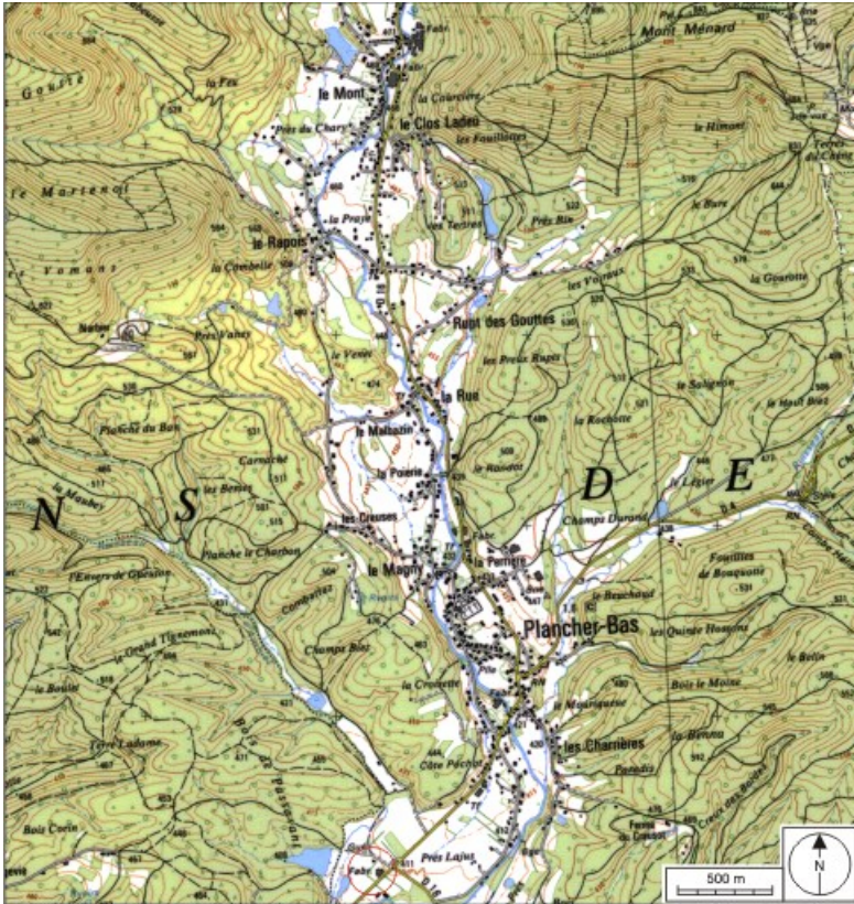
Carte de localisation. Carte topographique au 1:25000, I.G.N., Ballon d'Alsace, 3520 ET. SCAN 25 © IGN - 2008, Licence n°2008CISE29-68.

70, Plancher-Bas R.D. 4, lieu-dit : Pré Lajus