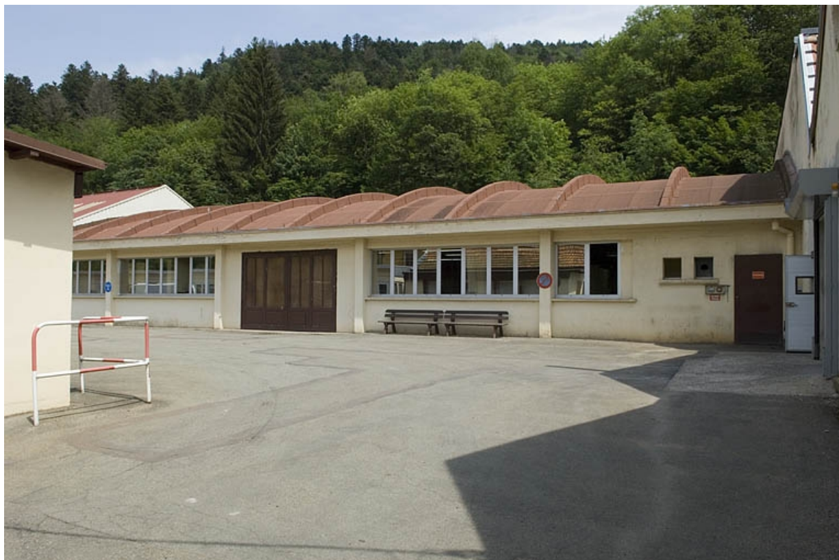
Atelier de fabrication à voûte en berceau segmentaire. Vue depuis l'entrée. 70, Plancher-Bas, 36 rue Louis Pasteur, lieudit : le Mont