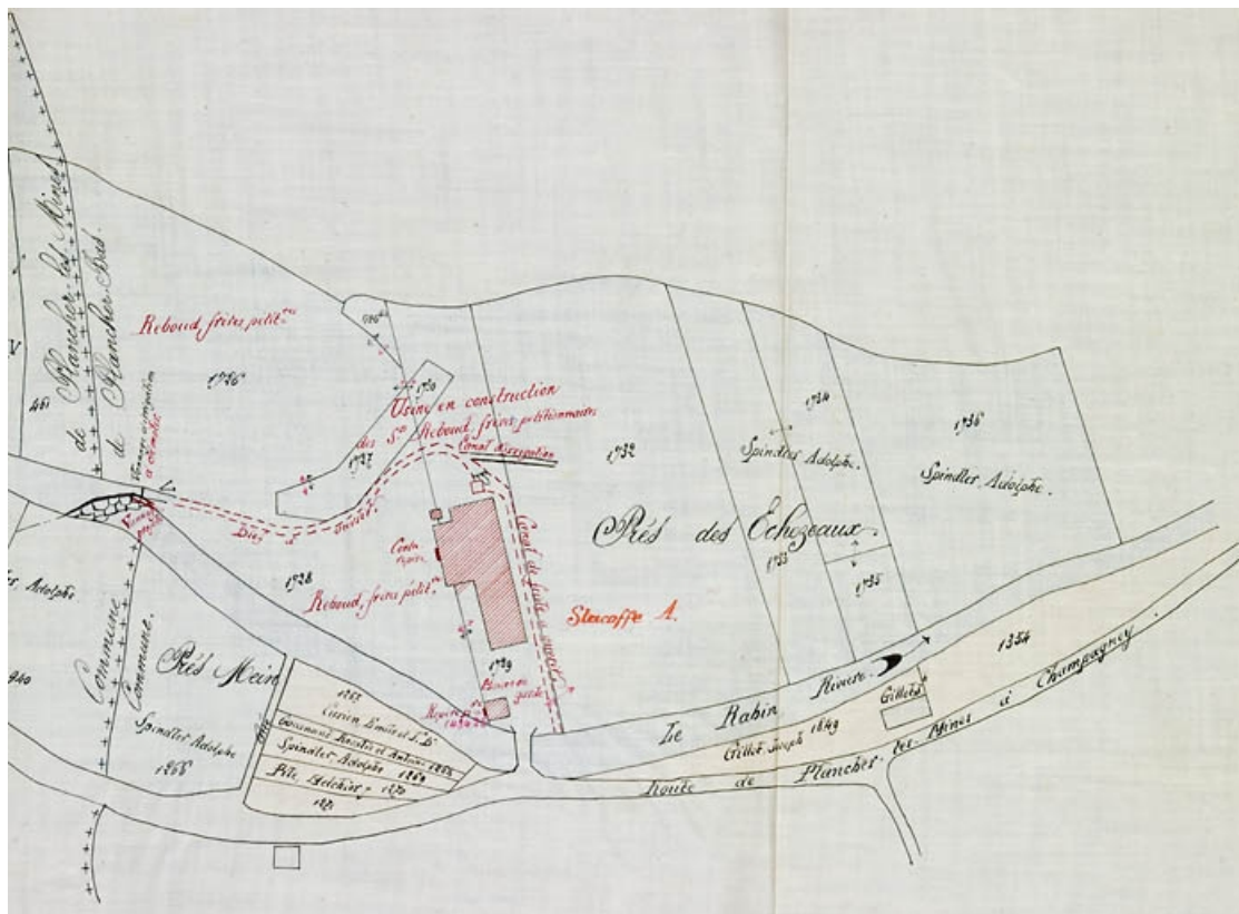
Réglementation du barrage de l'usine Rebound frères [plan-masse et de situation].

70, Plancher-Bas, 36 rue Louis Pasteur, lieudit : le Mont