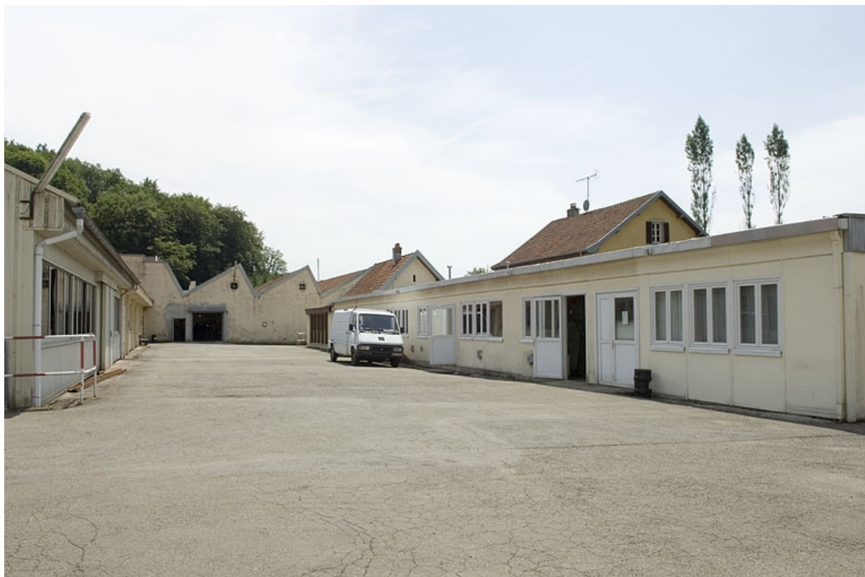
Ateliers de fabrication vus depuis le nord de la cour.

70, Plancher-Bas, 36 rue Louis Pasteur, lieudit : le Mont