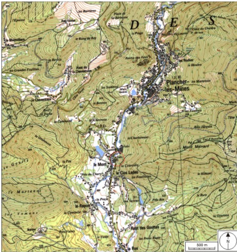
Carte de localisation. Carte topographique au 1:25000, I.G.N., Ballon d'Alsace, 3520 ET. SCAN 25 © IGN - 2008, Licence n°2008CISE29-68.

70, Plancher-Bas, 1 rue du Charbonnier, lieudit : le Mont