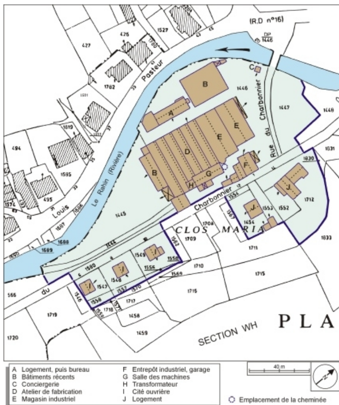
Plan-masse et de situation. Extrait du plan cadastral numérisé, 2006, section A, échelle 1:1250. 70, Plancher-Bas, 1 rue du Charbonnier, lieudit : le Mont