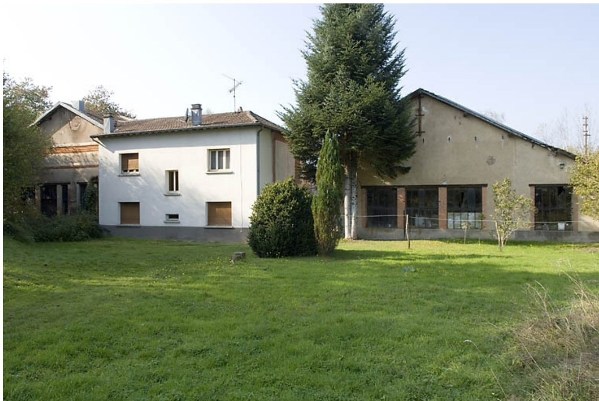
Façades postérieures depuis l'est. 70, Champagney rue de la Fonderie