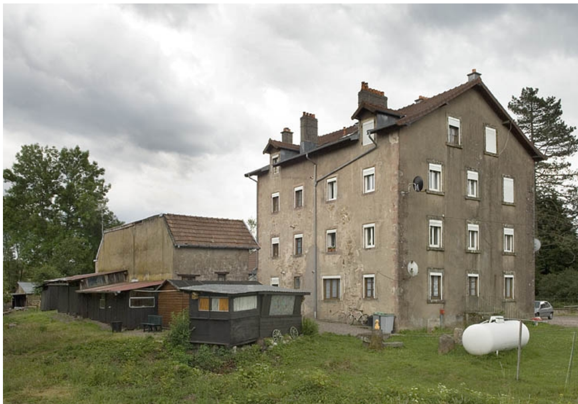
Vue d'ensemble depuis le pont.