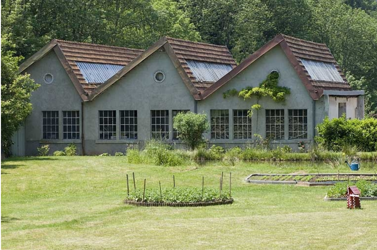
Pignons est de l'atelier de fabrication.