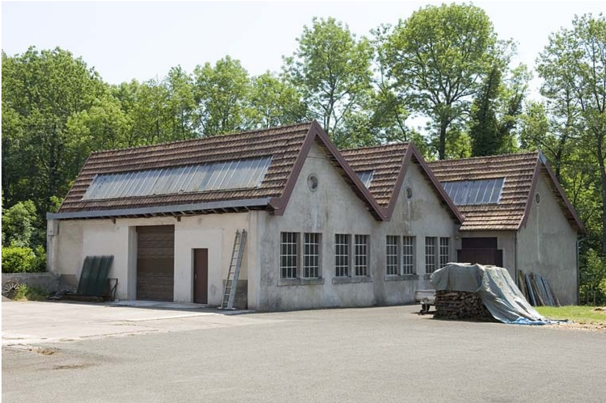
Vue de trois quarts de l'atelier de fabrication.