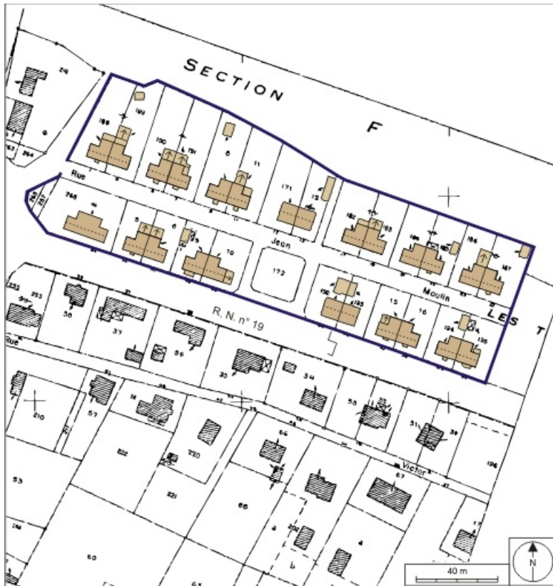
Plan-masse et de situation. Extrait du plan cadastral numérisé, 2008, section AO, 1:1000 réduit à 1:1500. Source : Direction générale des Finances Publiques - Cadastre ; mise à jour : 2008.