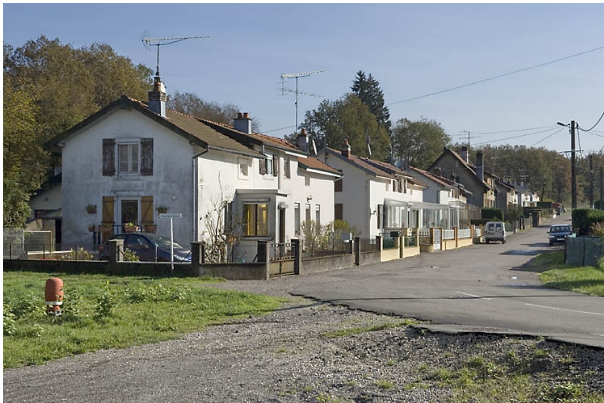
Vue d'ensemble depuis l'ouest.