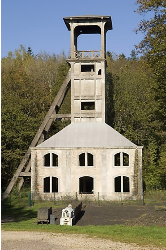
Le chevalement vu de face. Vue rapprochée.