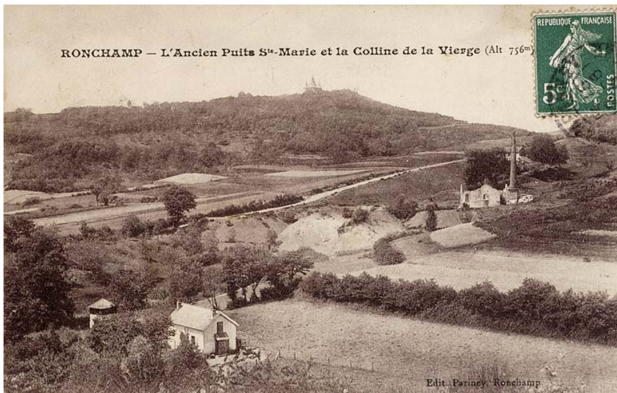
Ronchamp - L'ancien Puits Sainte-Marie et la colline de la Vierge.