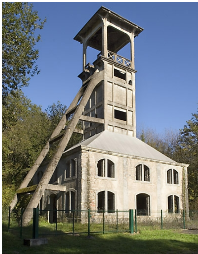
Le chevalement. Vue de trois quarts.