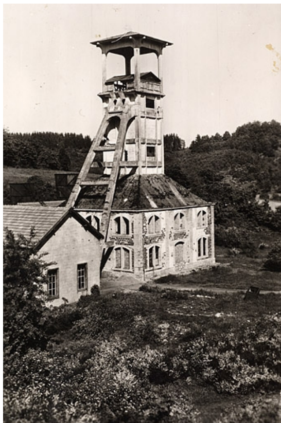
Ronchamp - Puits Sainte-Marie. 70, Ronchamp rue de la Chapelle