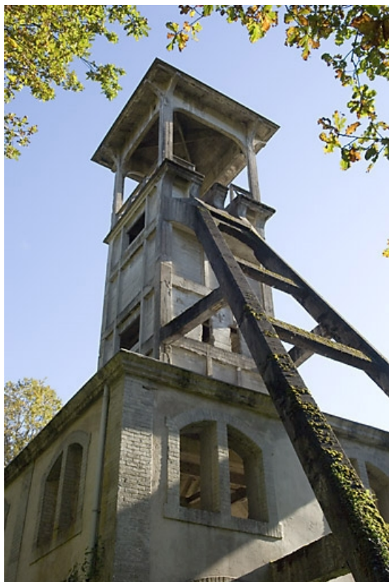
Le chevalement. Détail de la partie supérieure.