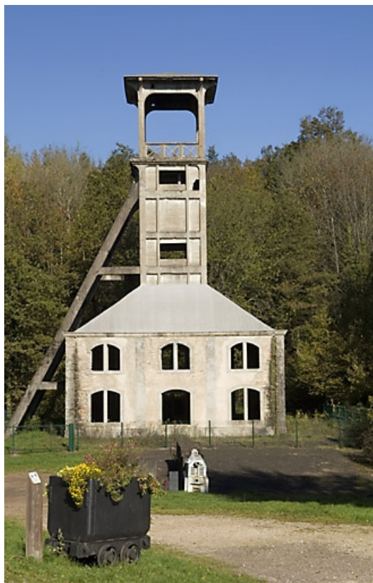
Le chevalement. Vue de face.