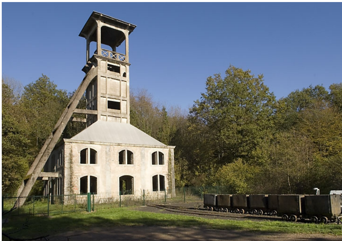
Le chevalement. Vue d'ensemble depuis l'ouest.