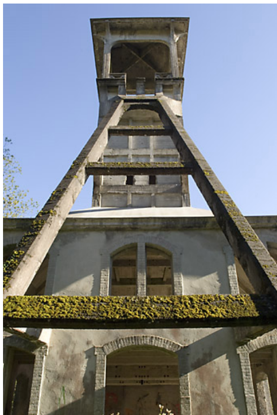
Le chevalement. Vue en contre-plongée.