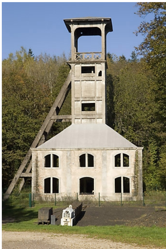
Le chevalement vu de face. Vue rapprochée.