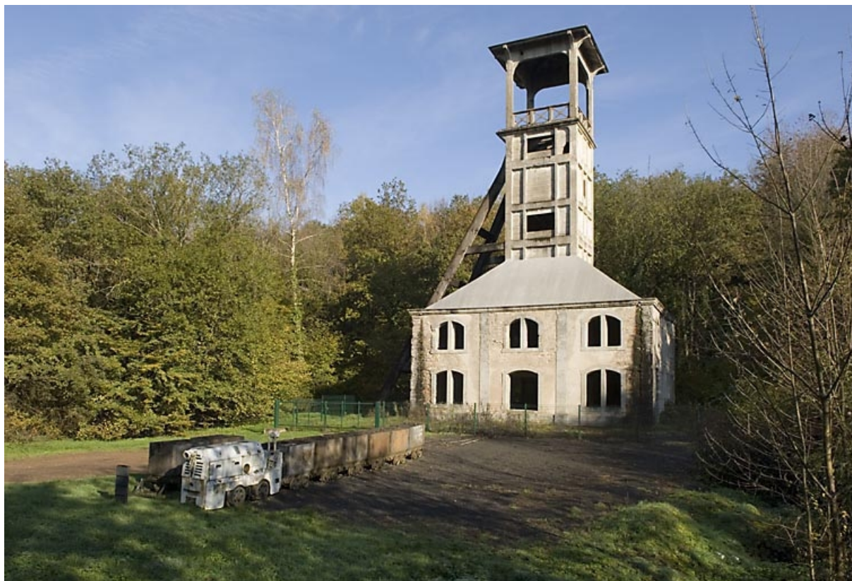
Le chevalement. Vue d'ensemble depuis le sud-ouest.