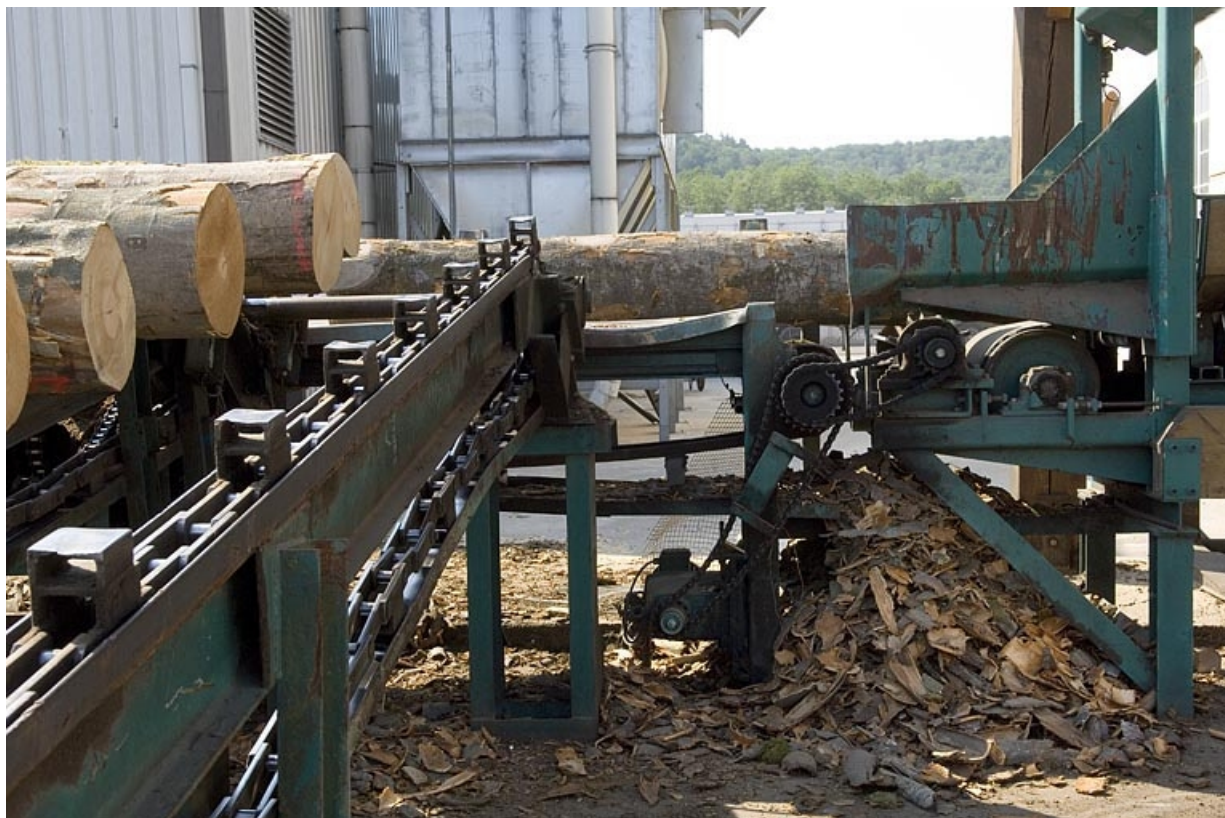
Train d'écorçage des grumes.