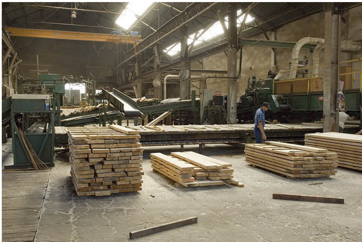
Atelier de sciage (ancien atelier de fonderie). Vue depuis l'ouest. 70, Ronchamp, 43 rue des Mineurs