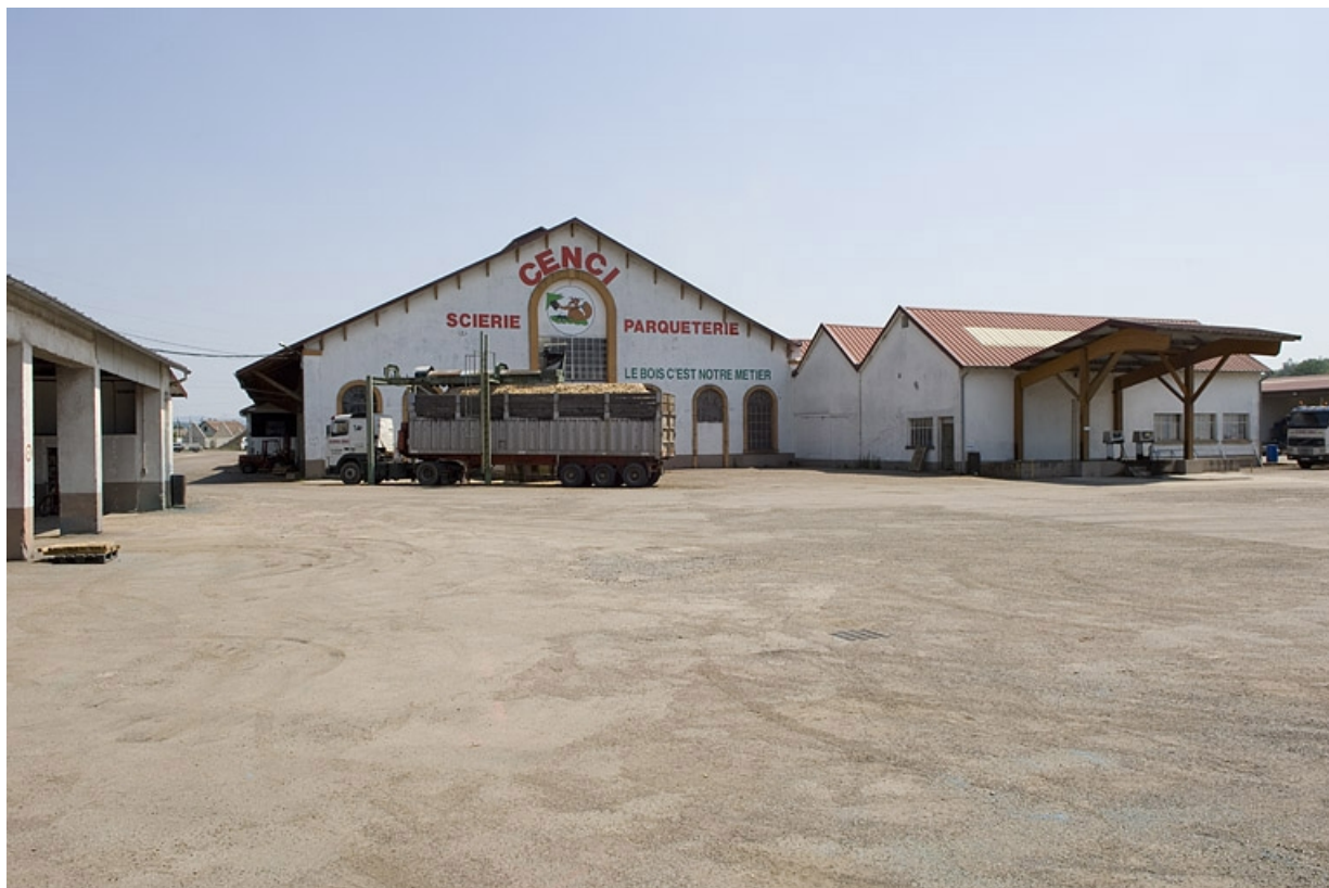
Vue d'ensemble depuis l'ouest.