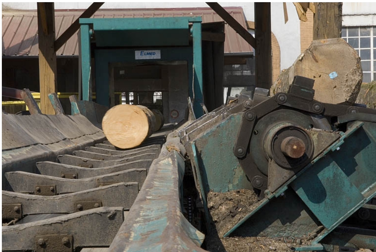
Admission d'une grume pour écorçage. 70, Ronchamp, 43 rue des Mineurs