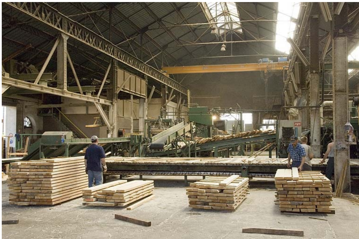
Atelier de sciage (ancien atelier de fonderie). Vue intérieure.