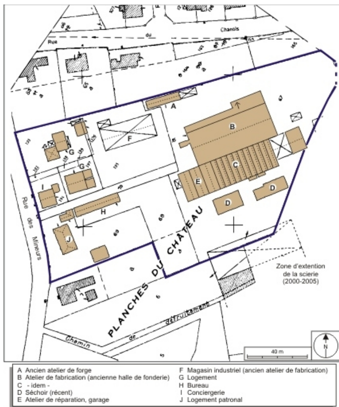
Plan-masse et de situation. Extrait du plan cadastral numérisé, 2008, section AM, échelle 1:1000 réduit à 1:1250. Source : Direction générale des Finances Publiques - Cadastre ; mise à jour : 2008. 70, Ronchamp, 43 rue des Mineurs