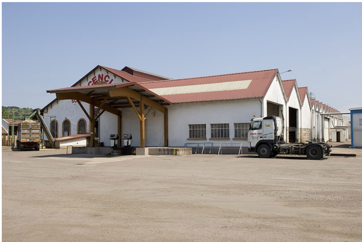
Ateliers de fabrication vus depuis le sud-ouest.