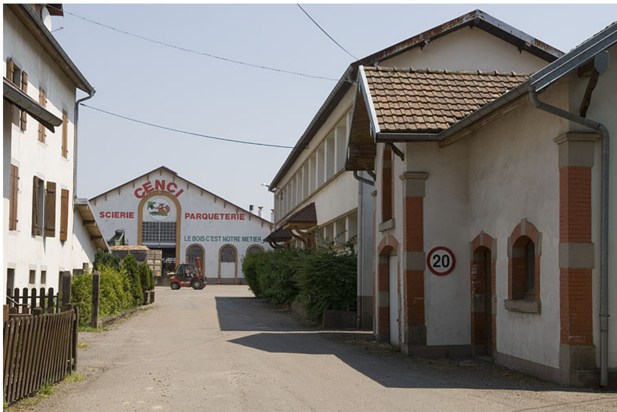
Vue d'ensemble depuis l'entrée.