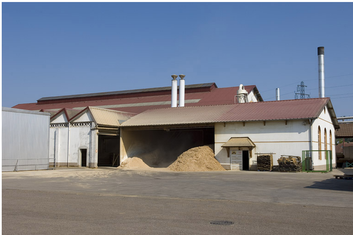
Atelier de réparation et entrepôt industriel vus depuis le sud.