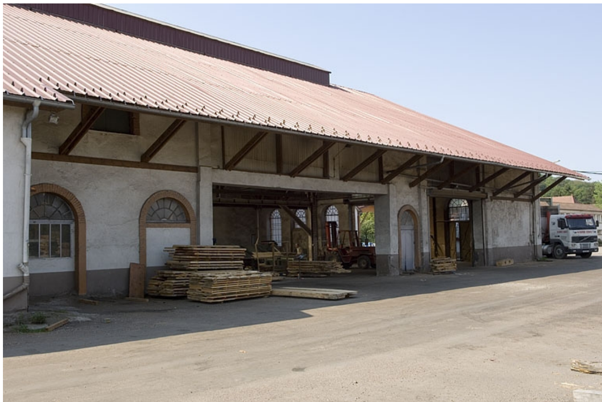
Façade nord de l'atelier de fabrication.