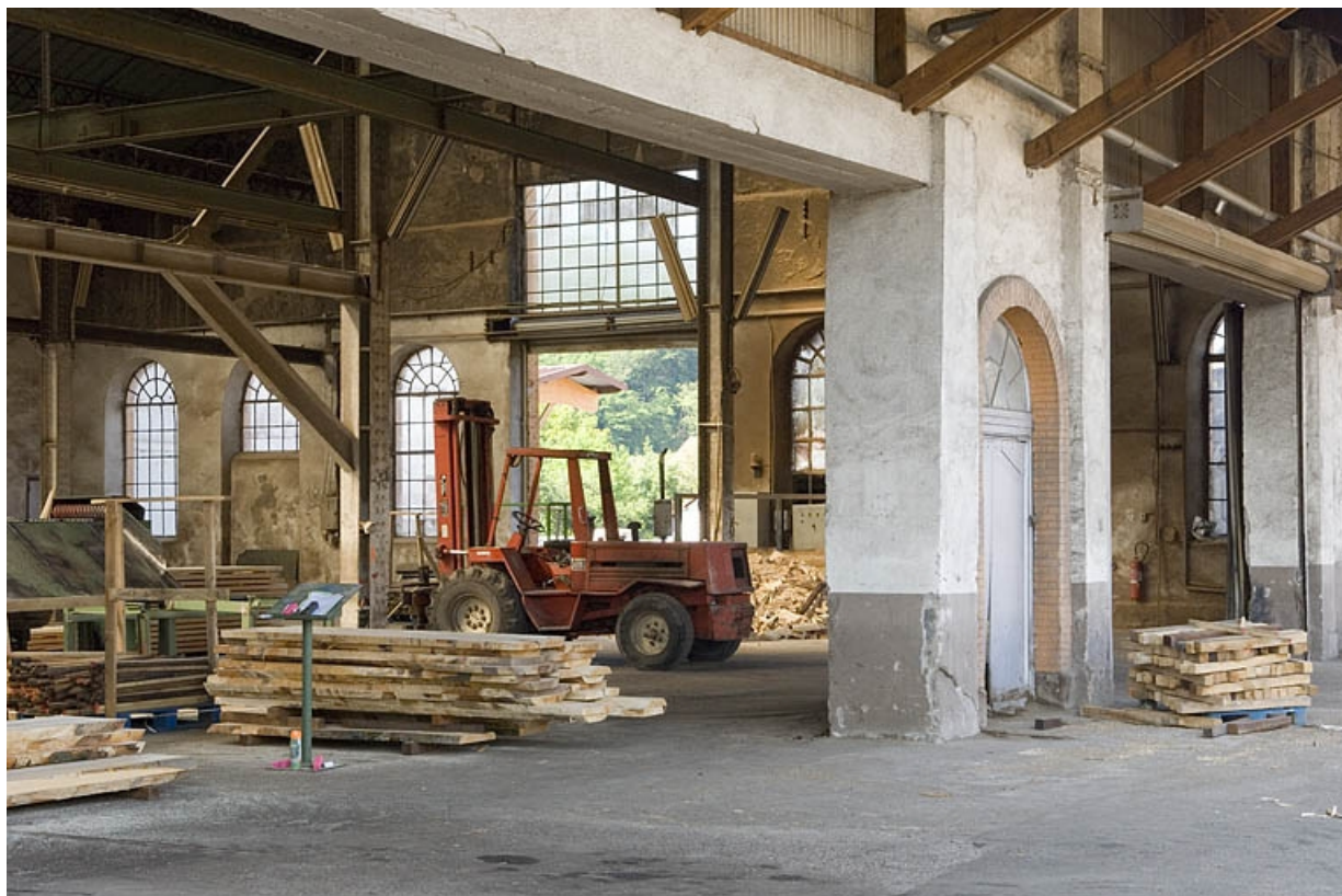
Intérieur de l'atelier de sciage. Vue sur le pignon.