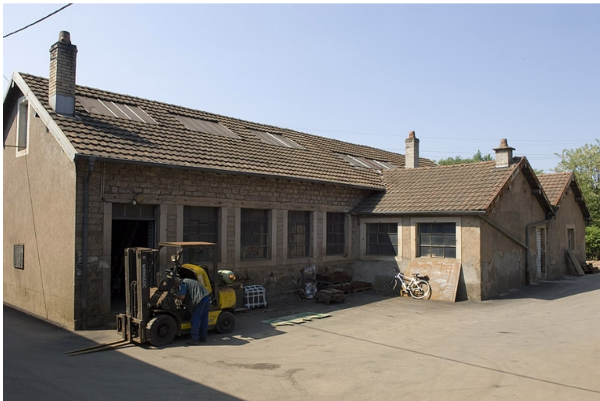
Atelier de fonderie primitif depuis le nord. 70, Ronchamp, 14 rue des Mineurs