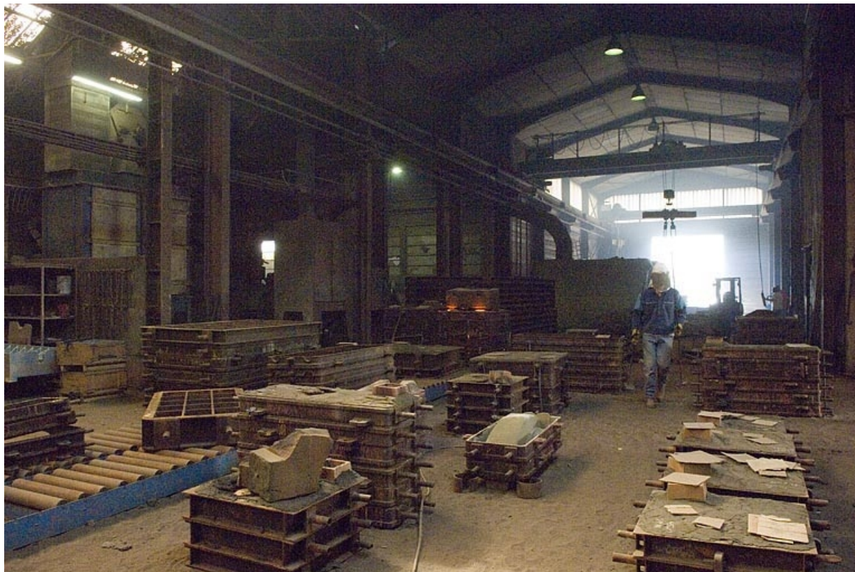
Vue intérieure de l'atelier de fonderie.