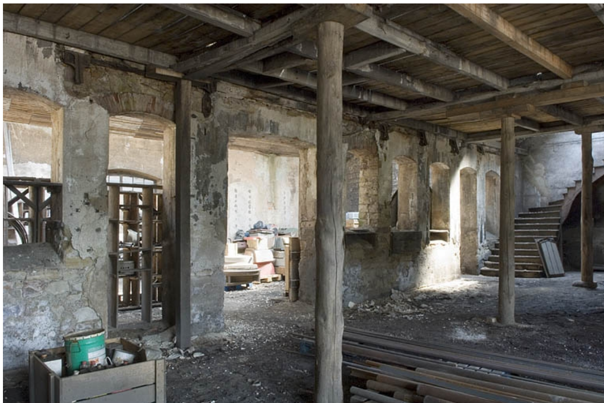
Vue intérieure de la fonderie primitive. Atelier de fabrication.