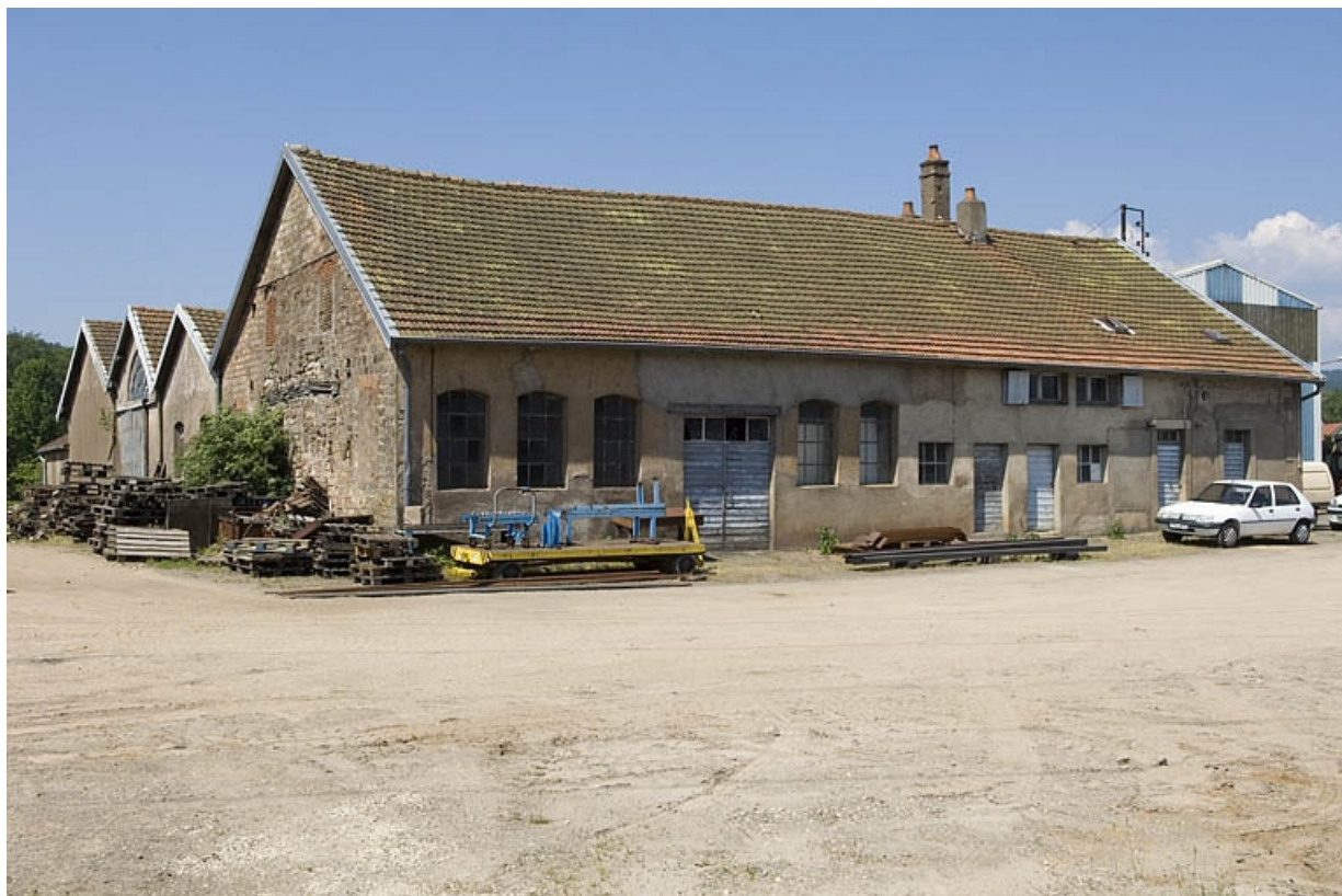
Atelier de fonderie primitif vu depuis le sud. 70, Ronchamp, 14 rue des Mineurs