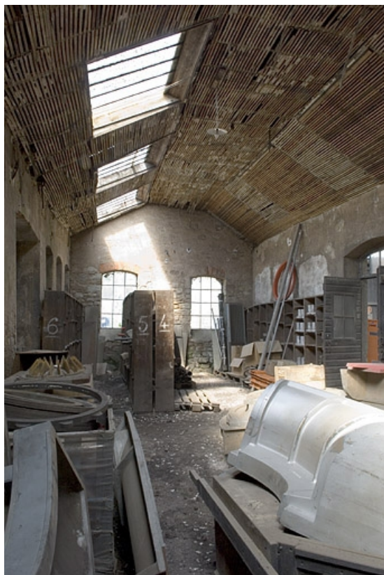
Vue intérieure de la fonderie primitive. Magasin industriel.