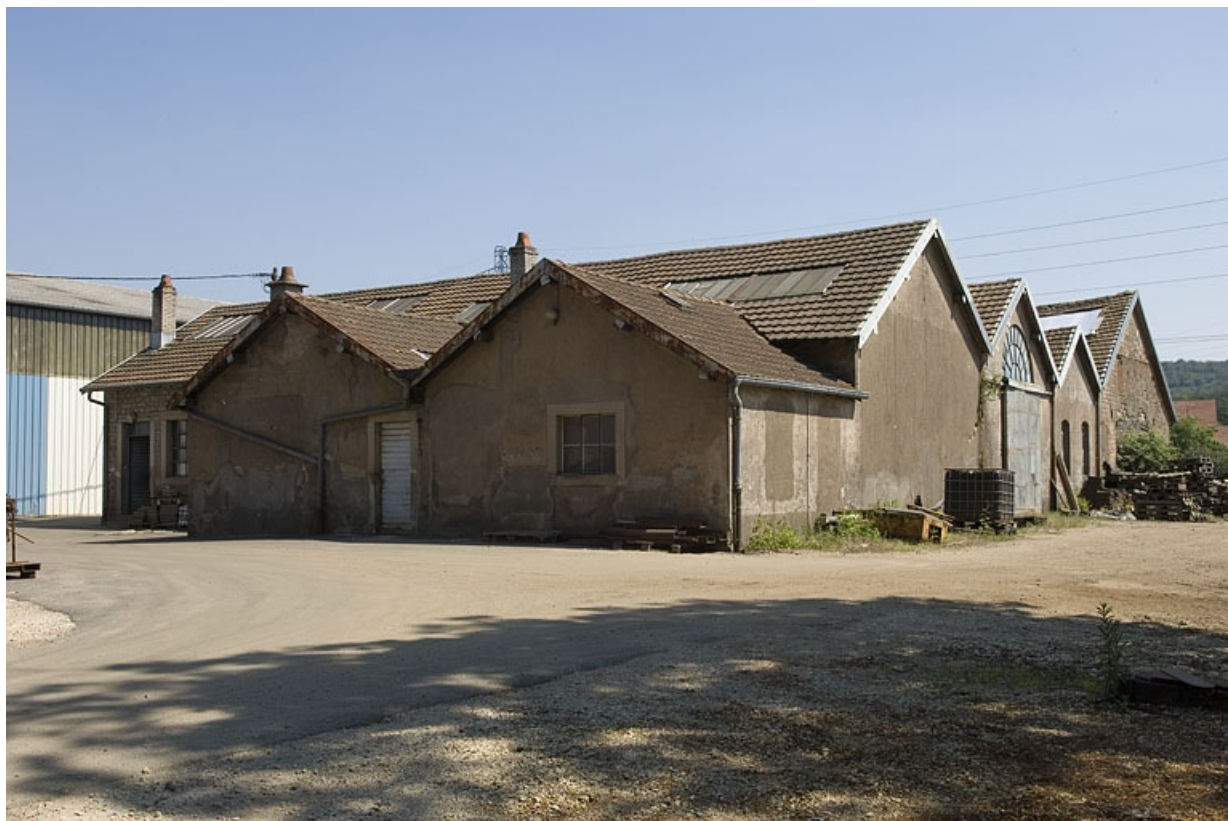
Atelier de fonderie primitif vu de trois quarts arrière.