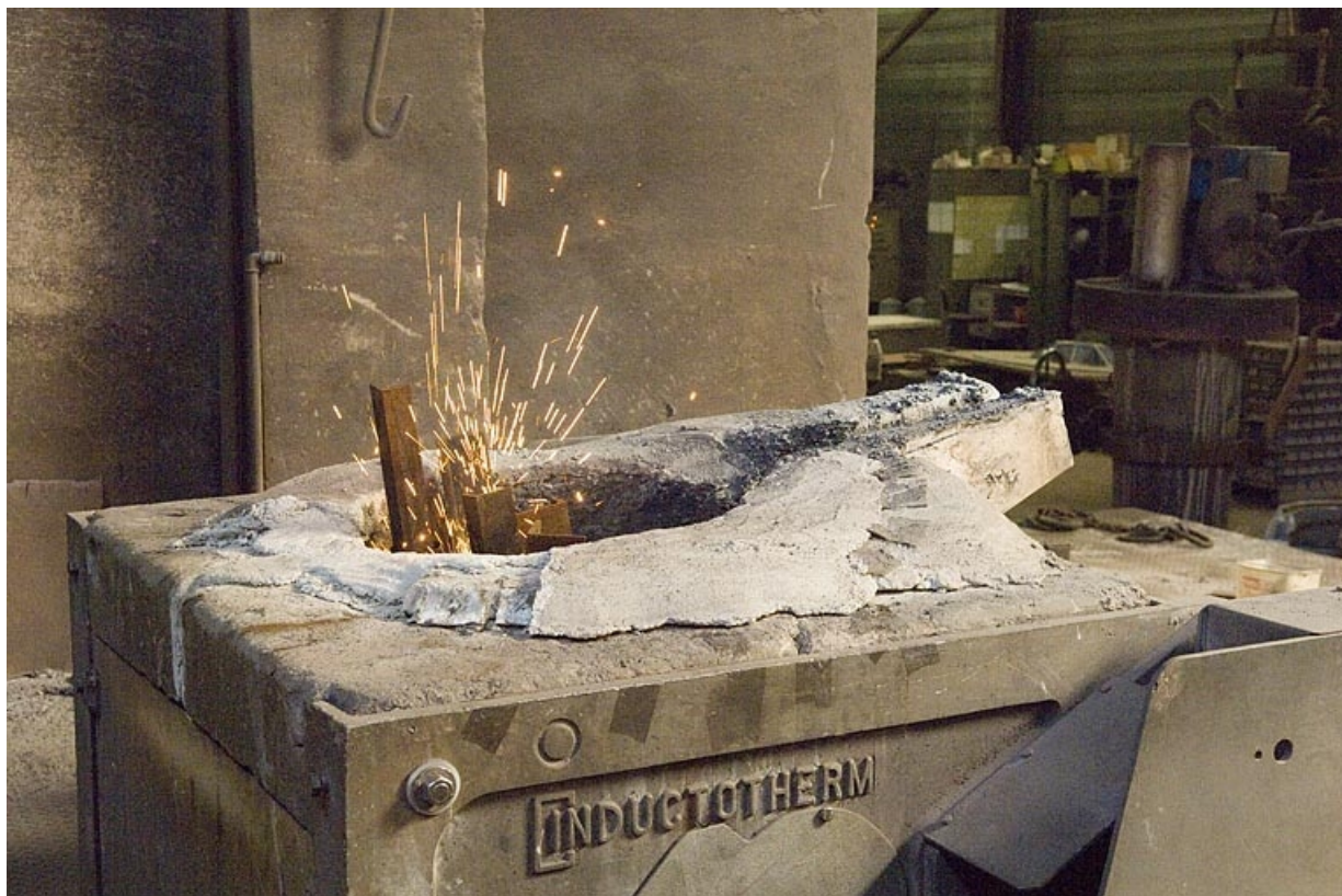
Fusion de pièces métalliques diverses dans un four.