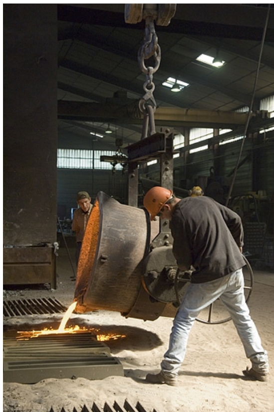
Coulée. Vue rapprochée.