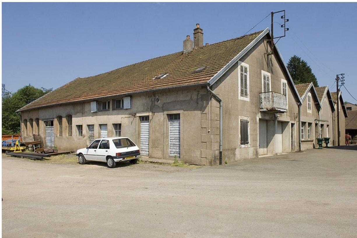
Vue de trois quarts de l'atelier de fonderie primitif.