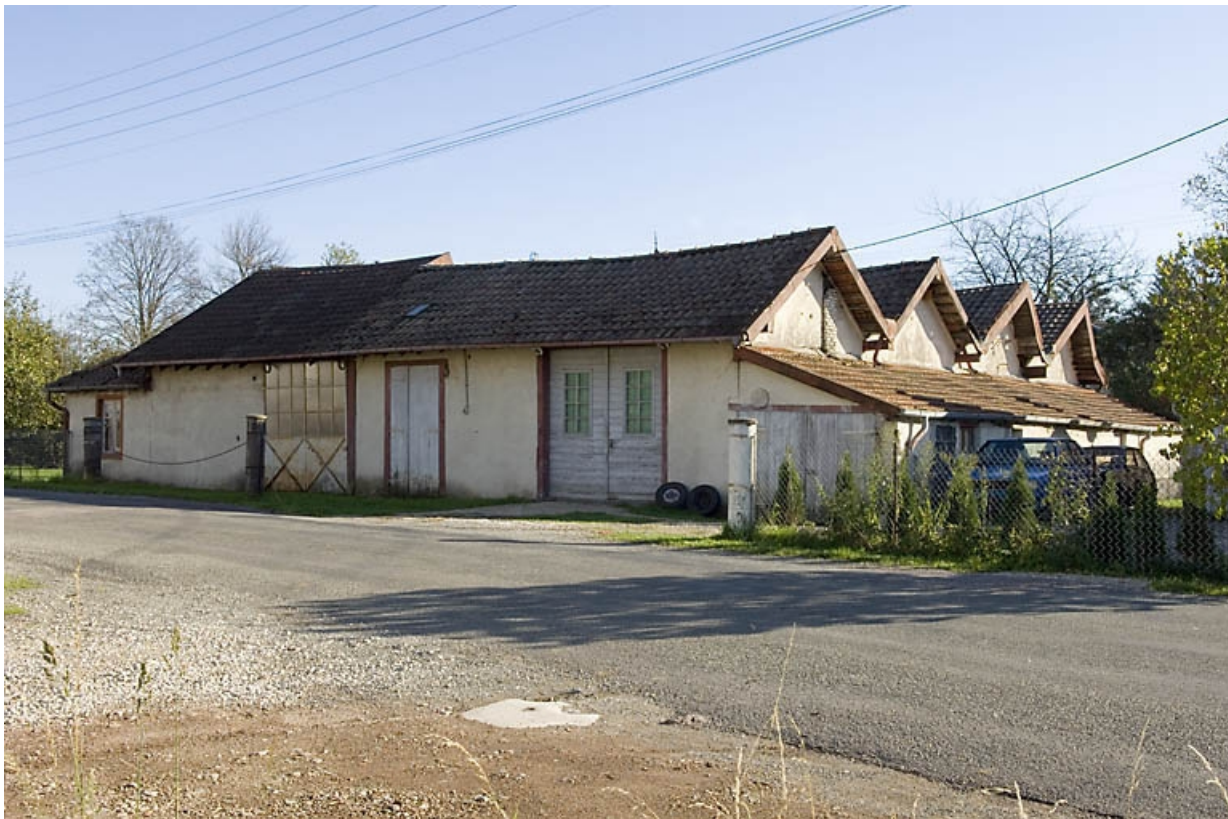
Vue de trois quarts de l'atelier de fabrication.