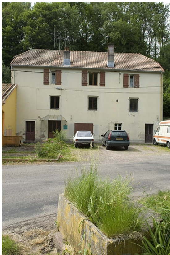
Façade antérieure de l'ancienne saboterie. 70, Clairegoutte, 3 à 9 rue de la Soierie