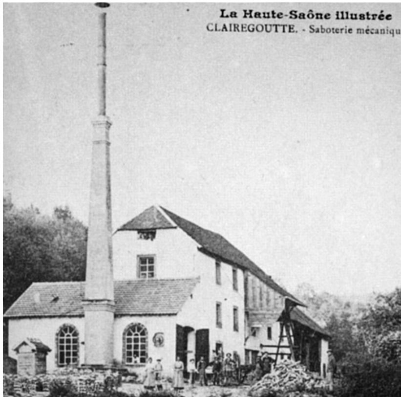
Clairegoutte. - Saboterie mécanique. 70, Clairegoutte, 3 à 9 rue de la Soierie