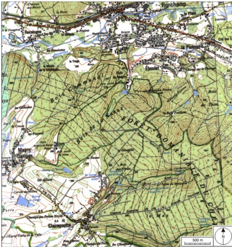
Carte de localisation. Carte topographique au 1:25000, I.G.N., Ballon d'Alsace, 3520 ET. SCAN 25 © IGN - 2008, Licence n°2008CISE29-68.

70, Clairegoutte, 3 à 9 rue de la Soirie