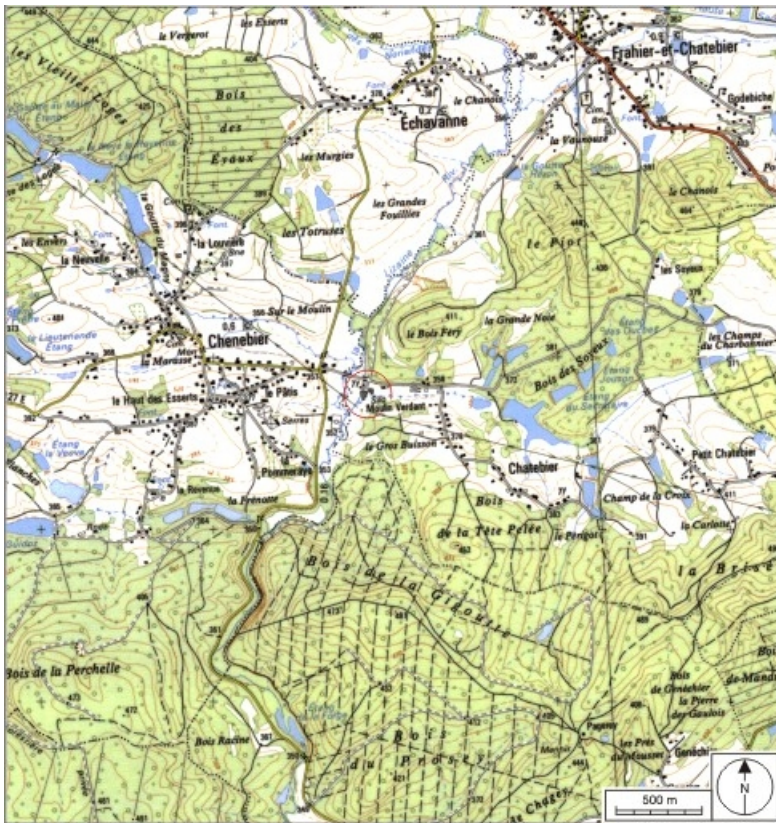
Carte de localisation. Carte topographique au 1:25000, I.G.N., Belfort, 3621 OT. Licence n°2008CISE29-68. 70, Frahier-et-Chatebier, 33, 35 rue du Moulin, lieudit : le Moulin