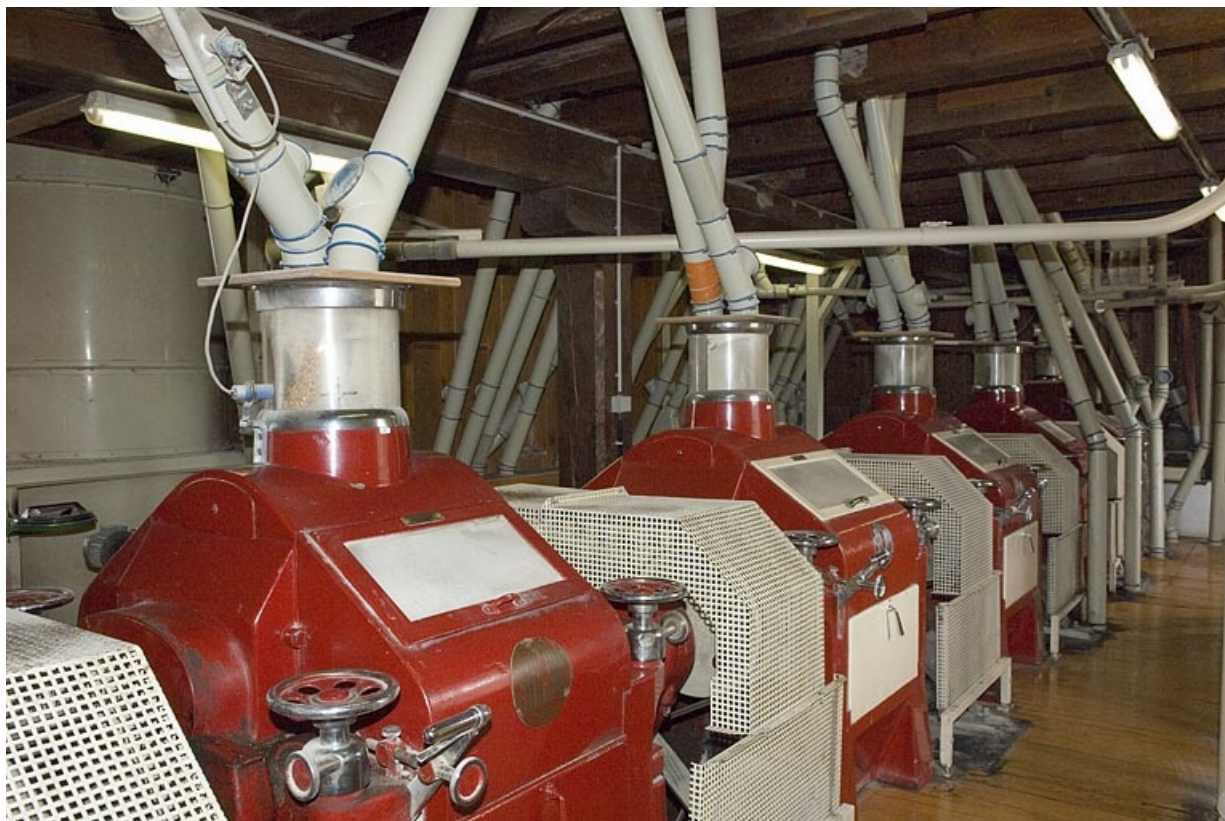
Les appareils à cylindres.

70, Frahier-et-Chatebier, 33, 35 rue du Moulin, lieudit : le Moulin