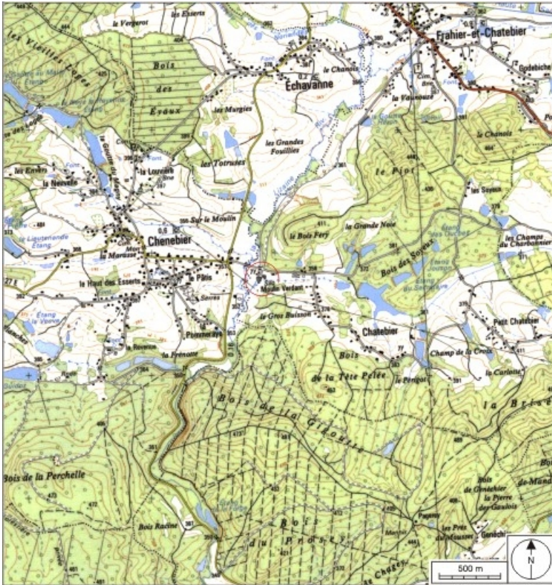
Carte de localisation. Carte topographique au 1:25000, I.G.N., Belfort, 3621 OT. Licence n°2008CISE29-68. 70, Frahier-et-Chatebier, 33, 35 rue du Moulin, lieudit : le Moulin