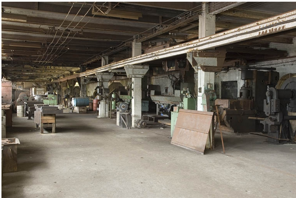
Atelier de fabrication primitif. Atelier de taillage (1er étage).

70, Haut-du-Them-Château-Lambert, 4 impasse des Maîtres de Forge