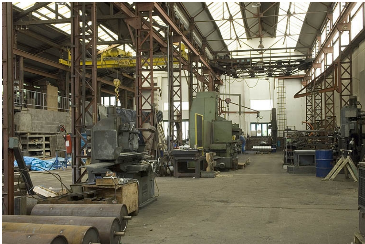
Atelier de mécanique. Vue intérieure.

70, Haut-du-Them-Château-Lambert, 4 impasse des Maîtres de Forge