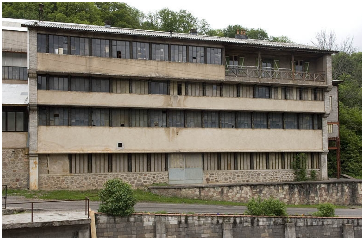
Façade sur rue de l'atelier de fabrication primitif.

70, Haut-du-Them-Château-Lambert, 4 impasse des Maîtres de Forge