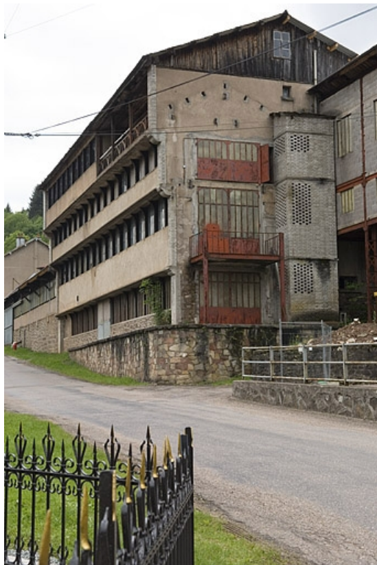
Élévation sud-est de l'atelier de fabrication primitif.

70, Haut-du-Them-Château-Lambert, 4 impasse des Maîtres de Forge