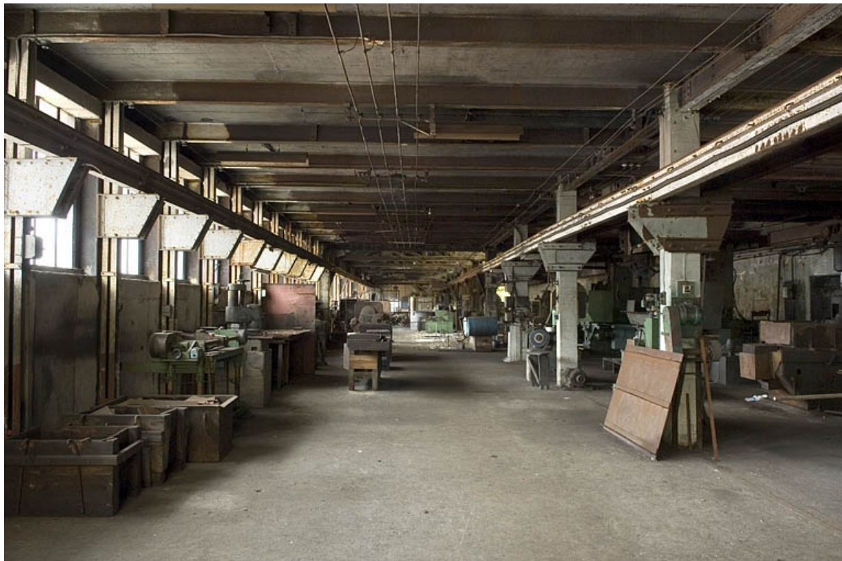
Atelier de fabrication primitif. Vue d'ensemble des ateliers de planage et de tournage (1er étage). 70, Haut-du-Them-Château-Lambert, 4 impasse des Maîtres de Forge