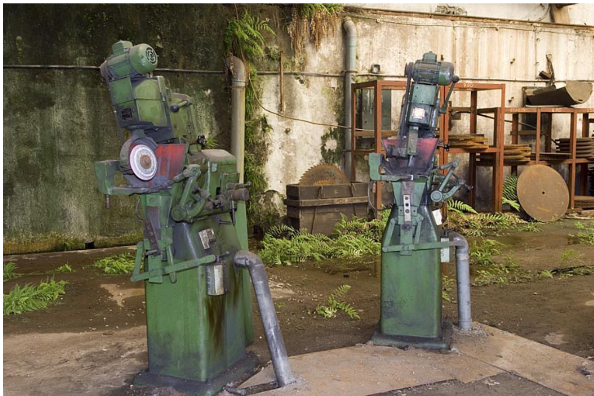
Machines à affûter Cha et Sady (Vincennes).

70, Haut-du-Them-Château-Lambert, 4 impasse des Maîtres de Forge