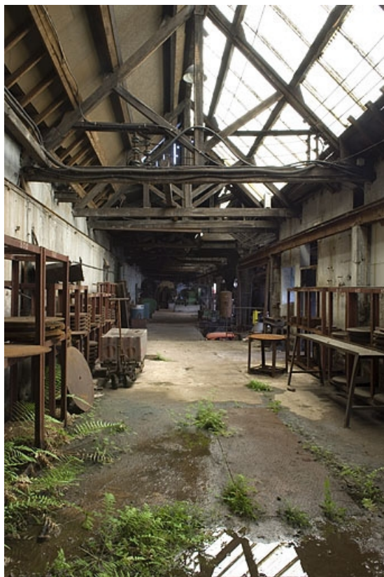
Extension occidentale de l'atelier de fabrication. Vue intérieure.

70, Haut-du-Them-Château-Lambert, 4 impasse des Maîtres de Forge