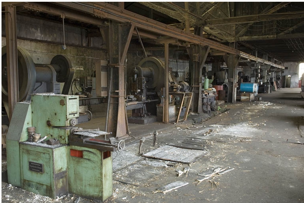
Atelier de fabrication primitif. Atelier de taillage. Vue depuis l'ouest. 70, Haut-du-Them-Château-Lambert, 4 impasse des Maîtres de Forge