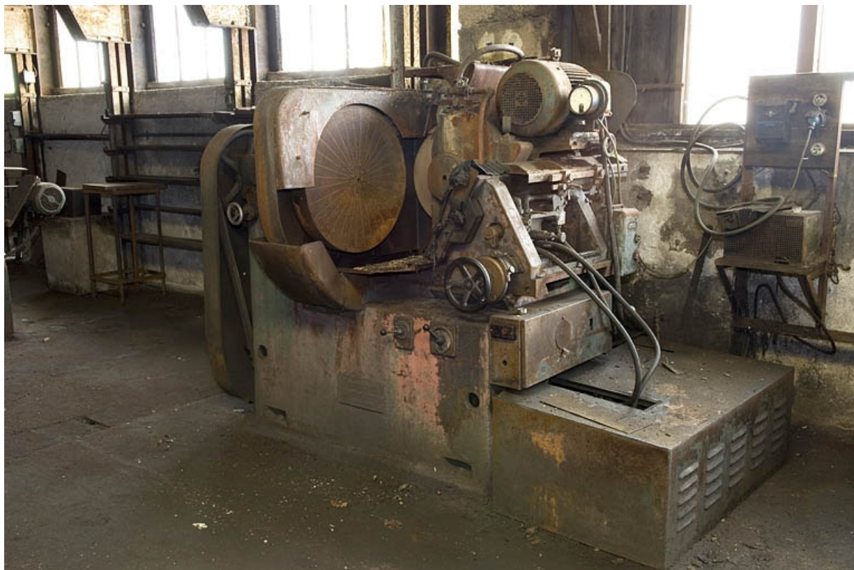
Rectifieuse de lames de scie, dite machine à planer Engeländer et Beyer (Remscheid). 70, Haut-du-Them-Château-Lambert, 4 impasse des Maîtres de Forge