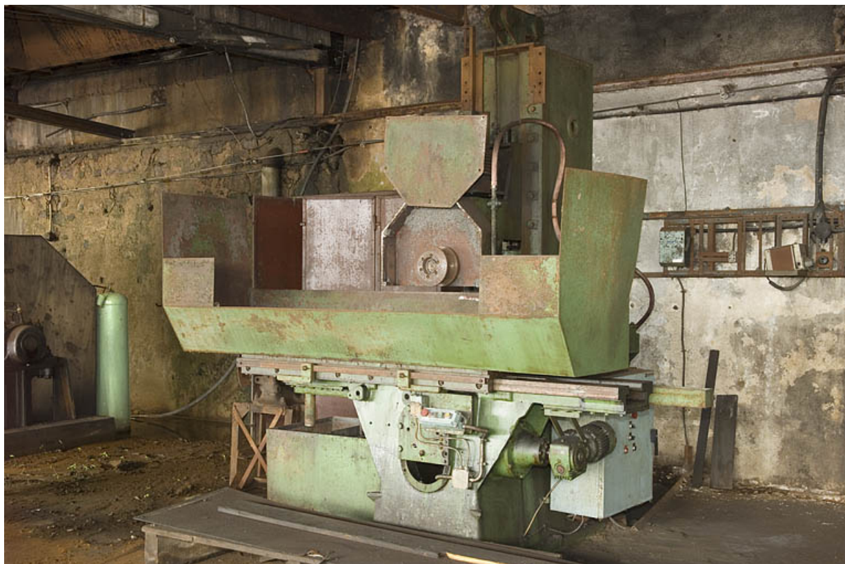
Rectifieuse de lames de scie, dite rectifieuse plane.

70, Haut-du-Them-Château-Lambert, 4 impasse des Maîtres de Forge