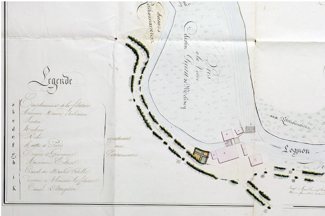
Plan exométrique de l'emplacement d'une filature devant être construit sur celui d'un ancien moulin dit moulin Fidelle [...] 70, Saint-Barthélemy, lieudit : sous le Mont de Vannes