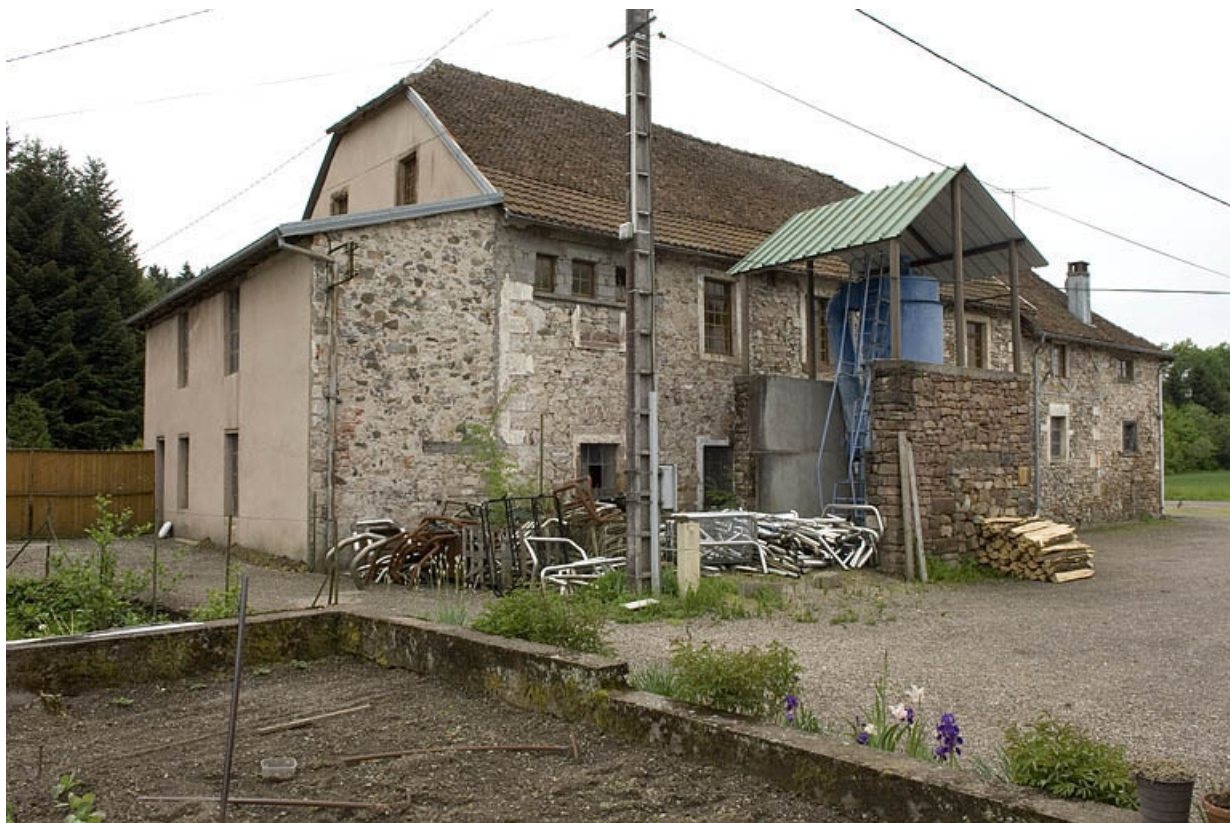
Façade nord de l'atelier de filature.

70, Saint-Barthélemy, lieudit : sous le Mont de Vannes