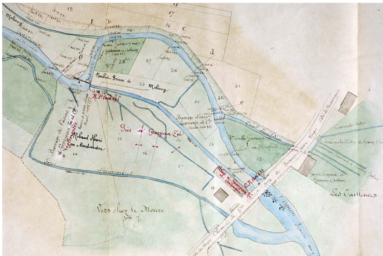
Usine à Zoé Grosjean et Cie. Plan et détails [plan-masse et de situation].

70, Servance, 16 avenue du Général de Gaulle