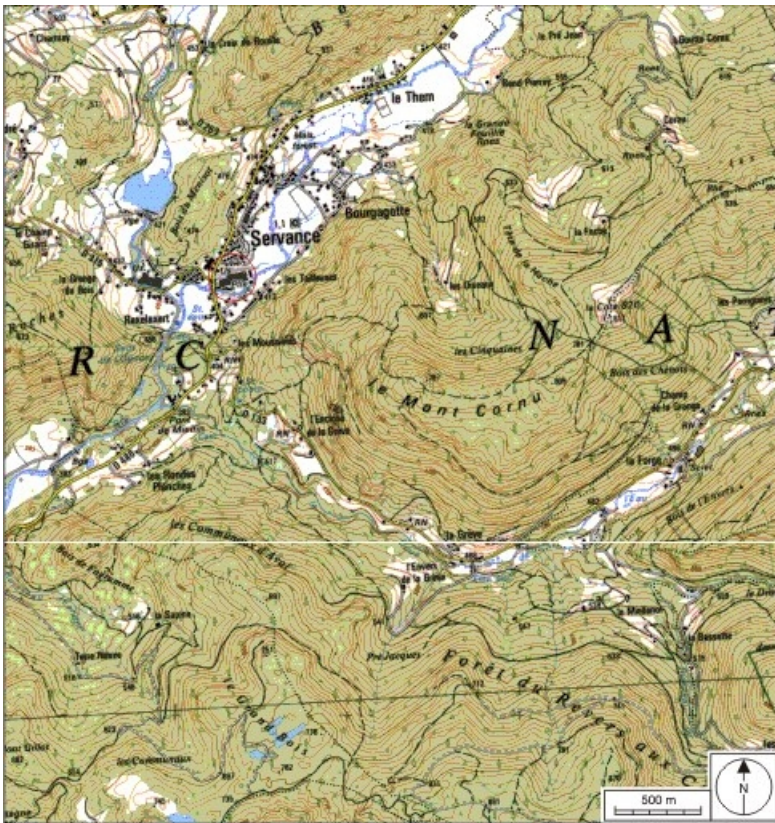
Carte de localisation. Carte topographique au 1:25000, I.G.N., Ballon d'Alsace, 3520 E. SCAN 25

70, Servance, 16 avenue du Général de Gaulle