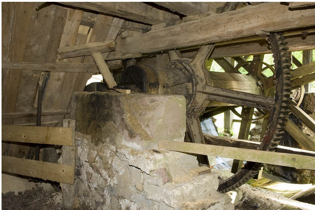
Etage de soubassement. Détail de la transmission par engrenage. 70, Servance, lieudit : la Grève