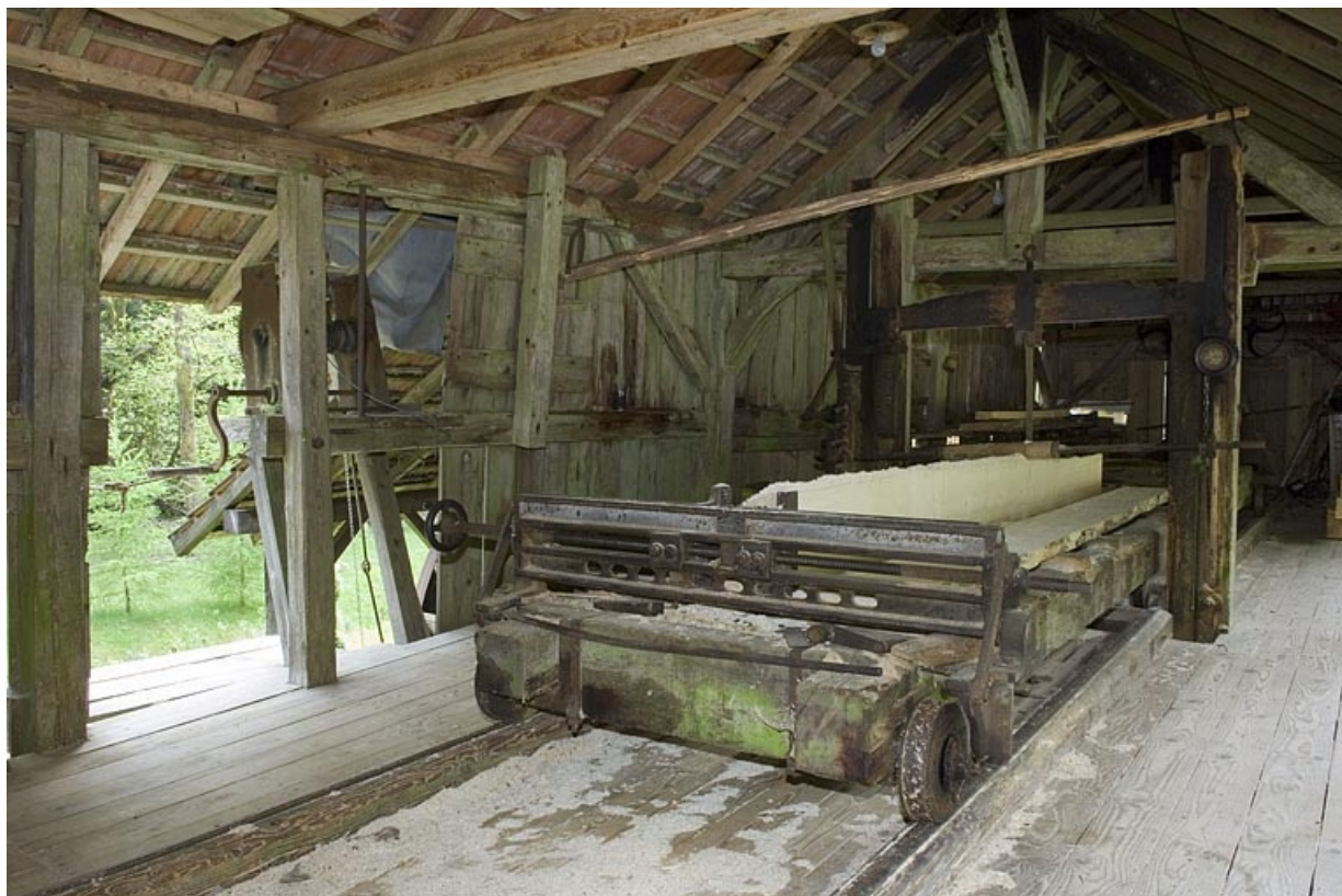
Intérieur de l'atelier. Détail du chariot depuis l'ouest.