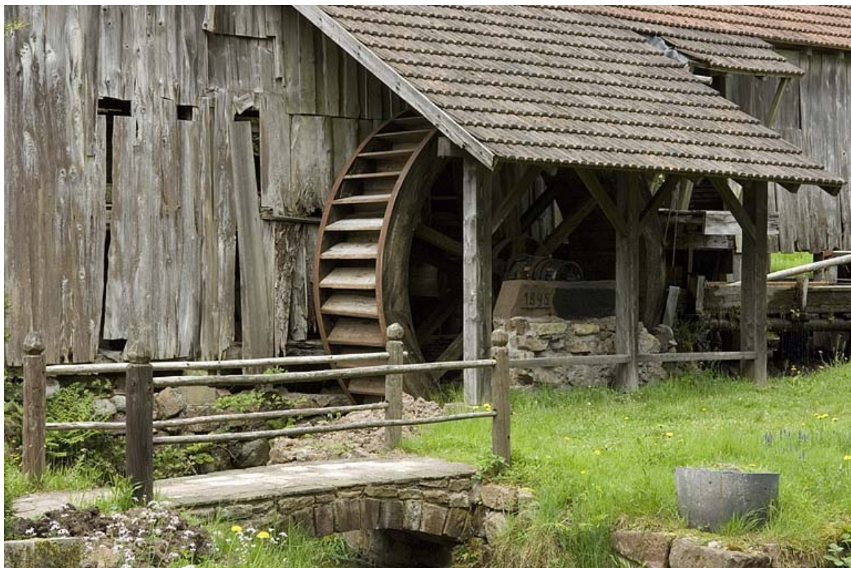
Façade sud. Détail de l'appentis abritant la roue hydraulique.