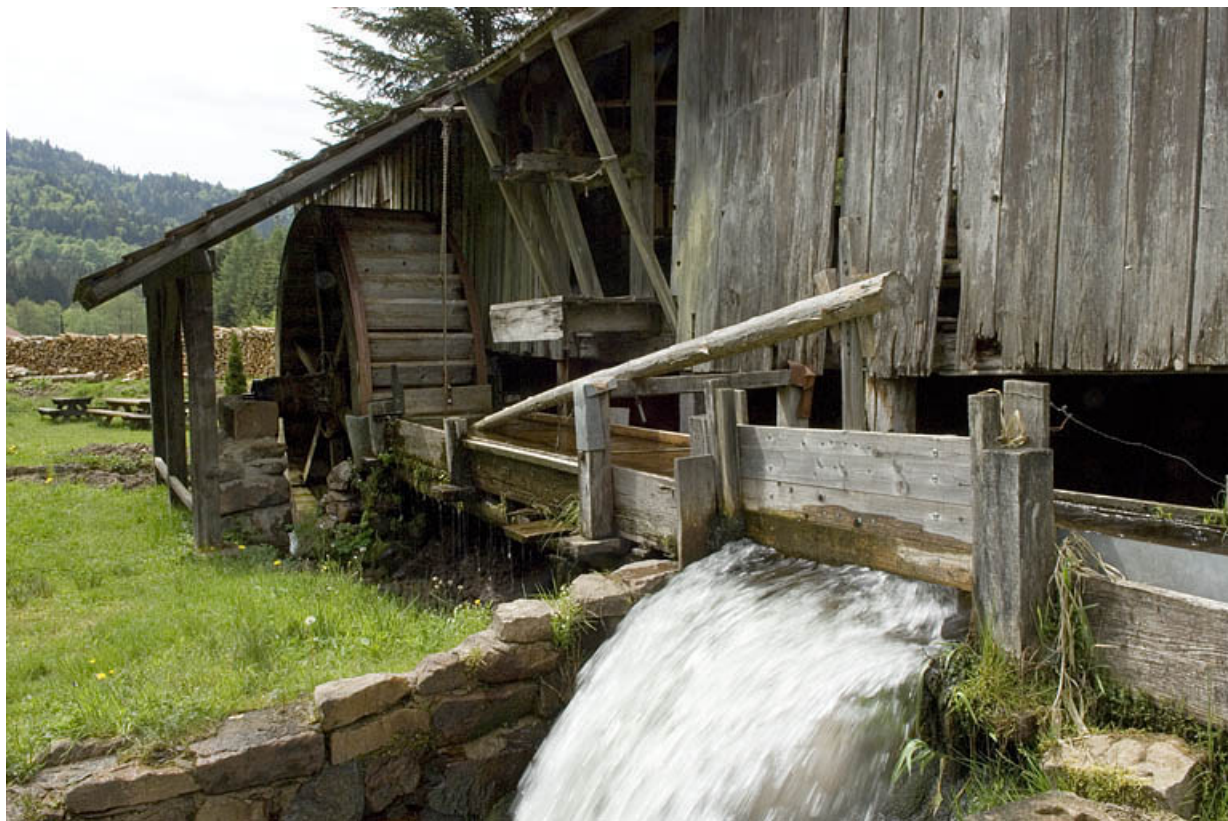
Façade sud. Détail de la huche et du déversoir.