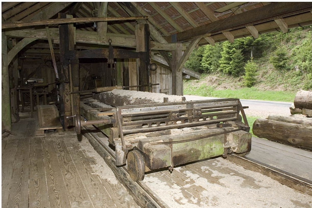
Intérieur de l'atelier. Le chariot vu de trois quarts.