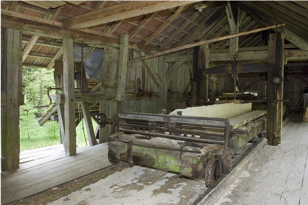
Intérieur de l'atelier. Détail du chariot depuis l'ouest.