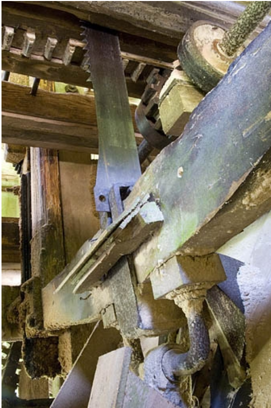
Etage de soubassement. Détail de la transmission : manivelle et lame de la scie vues du dessous. 70, Servance, lieudit : la Grève