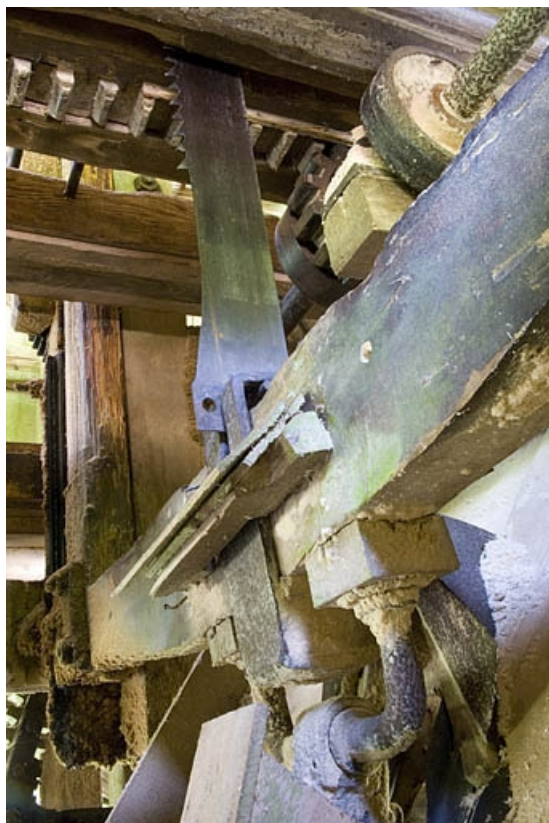
Etage de soubassement. Détail de la transmission : manivelle et lame de la scie vues du dessous. 70, Servance, lieudit : la Grève