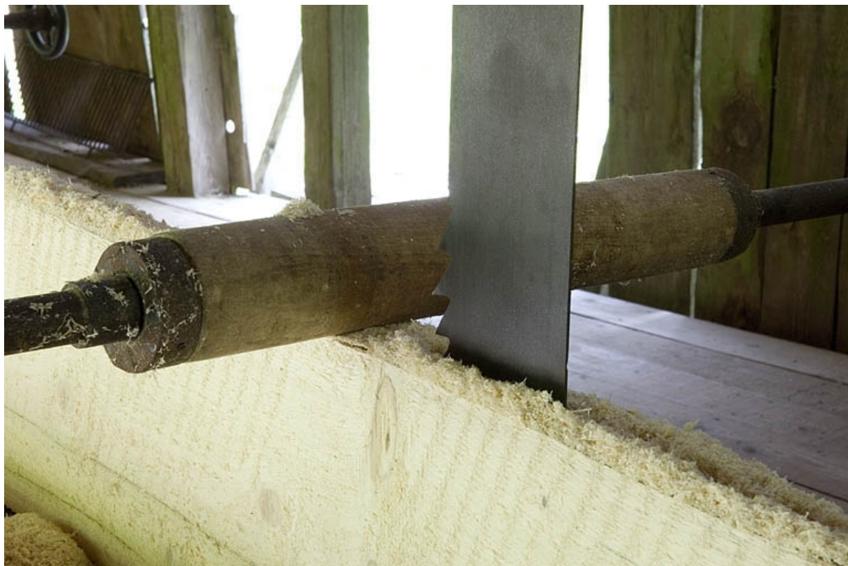
Détail de la scie du châssis.