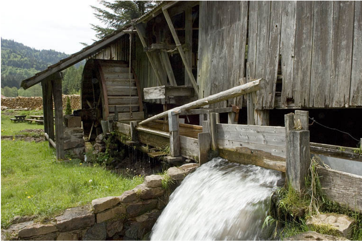
Façade sud. Détail de la huche et du déversoir. 70, Servance, lieudit : la Grève