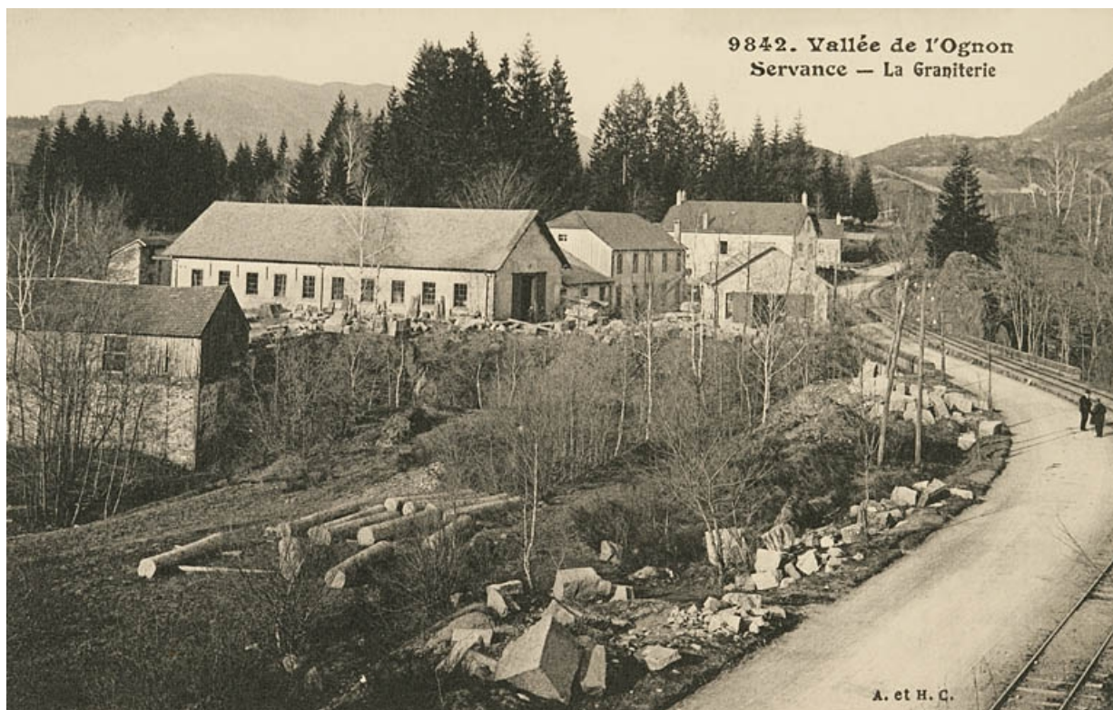
Vallée de l'Ognon. Servance - La graniterie.