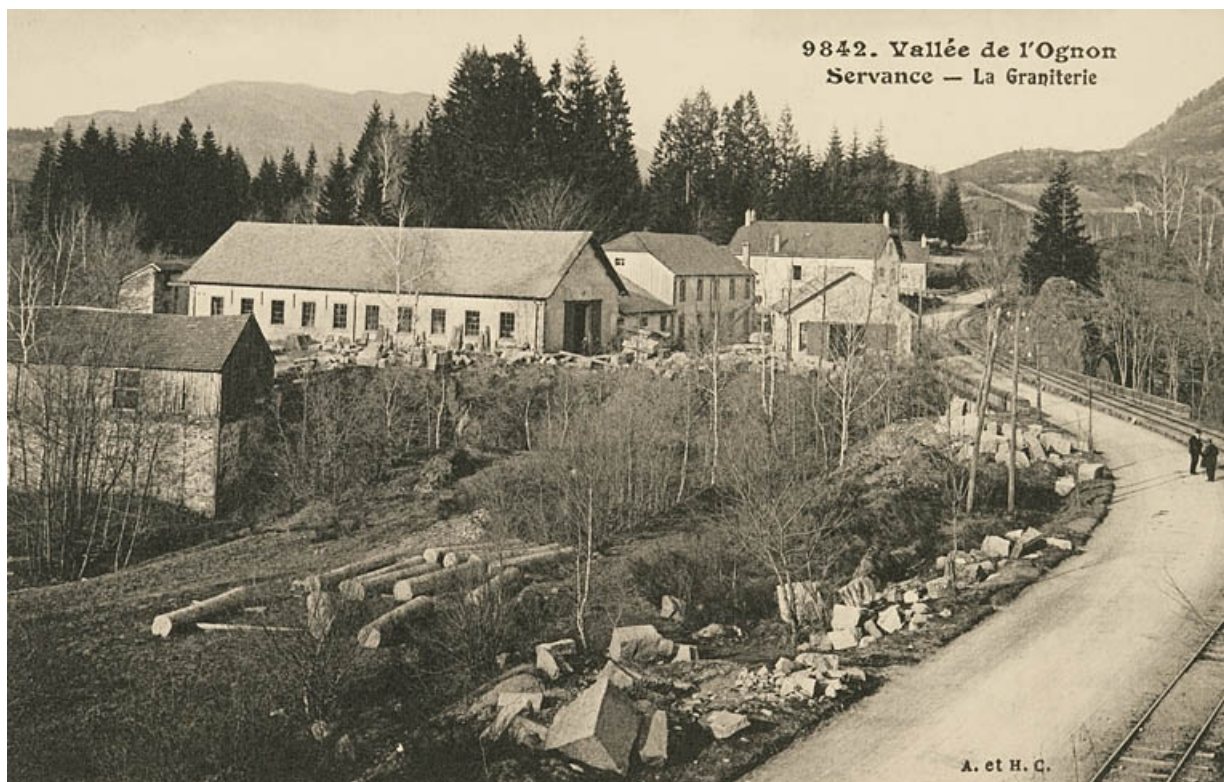
Vallée de l'Ognon. Servance - La graniterie.