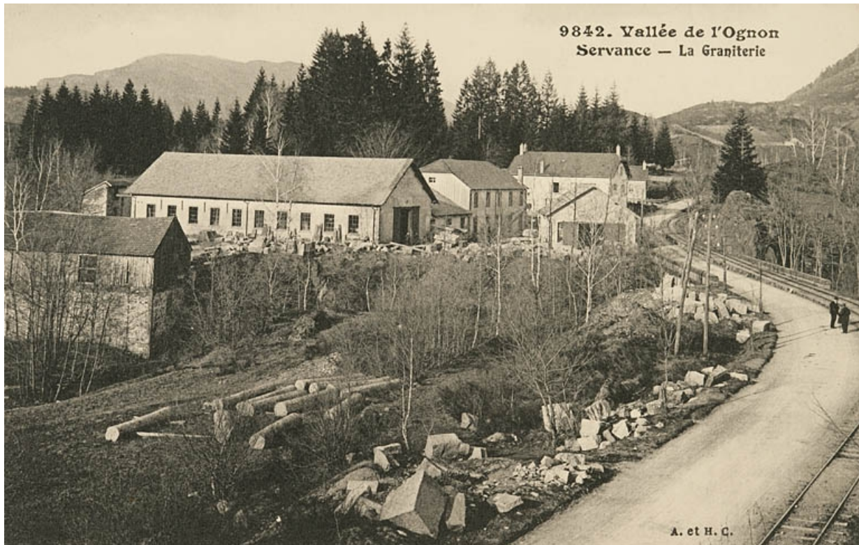
Vallée de l'Ognon. Servance - La graniterie.