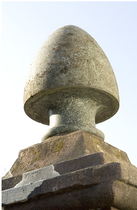
Élément décoratif en granit coiffant un des piliers de l'entrée.

70, Servance, lieudit : le Pont de Miellin