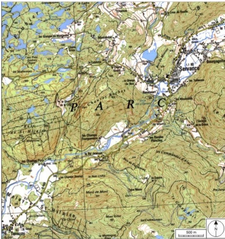
Carte de localisation. Carte topographique au 1:25000, I.G.N., Ballon d'Alsace, 3520 E. SCAN 25 © IGN - 2008, Licence n°2008CISE29-68.

70, Servance, lieudit : le Pont de Miellin