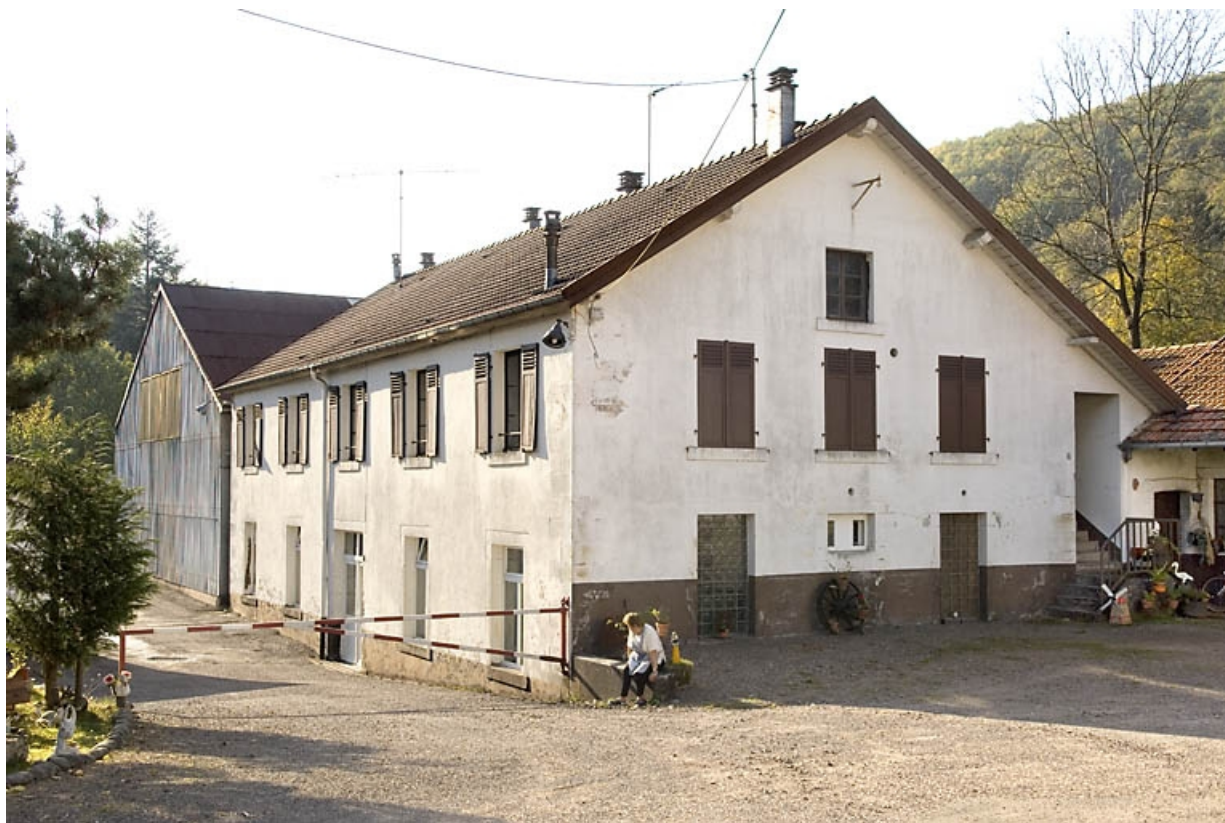
Vue d'ensemble depuis l'entrée.